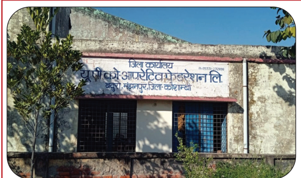
पौरीएफ कार्यालय का दृश्य