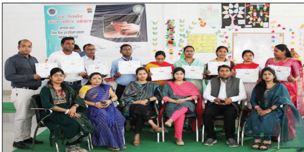
कार्यक्रम में उपस्थित प्रवक्ता