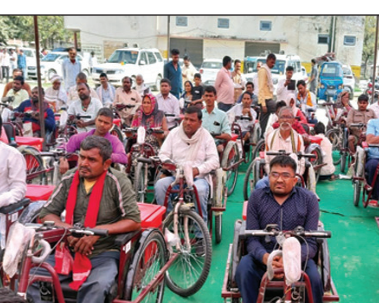
ट्राई साईकिल मिलते ही दिव्यांग जनों के खिले चेहरे

कौशाम्बी। सांसद विनोद सोनकर ने विकास भवन परिसर में आयोजित कार्यक्रम में 60 दिव्यांगजनों को मोटराइज्ड ट्राई साईकिल वितरित किया सांसद ने कार्यक्रम को सम्बोधित करते हुए कहा कि आज 60 दिव्यांगजनों को मोटराइज्ड ट्राई साईकिल वितरित किया गया है। उन्होंने शेष रह गये जनपद के दिव्यांगजनों को मोटराइज्ड ट्राई साईकिल के साथ ही अन्य सभी दिव्यांगजनों को कुत्रिम अंग/सहायक उपकरणों से लाभान्वित कराये जाने के लिए जनपद में ब्लॉकवार कैम्प का आयोजन करने के निर्देश दिये। उन्होंने कहा कि दिव्यांगजनों को आगामी 07, 08 एवं 09 अप्रैल 2023 को आयोजित होने वाली कौशाम्बी महोत्सव में भी कुत्रिम अंग/सहायक उपकरण से लाभान्वित किया जायेगा। उन्होंने कहा कि सभी पात्र दिव्यांगजनों को प्रधानमंत्री आवास योजना से भी लाभान्वित किया जायेगा तथा केंद्र व प्रदेश सरकार की मंशा है कि दिव्यांगजनों को मुख्यधारा से जोड़ने के लिए अधिक से अधिक जनकल्याणकारी योजनाओं से लाभान्वित किया जाय सांसद ने केन्द्र व प्रदेश सरकार द्वारा संचालित अनेक जनकल्याणकारी योजनाओं की विस्तार से जानकारी देते हुए कहा कि केन्द्र व प्रदेश सरकार द्वारा सभी पात्र लोगों को शौचालय की सुविधा उपलब्ध करायी गई, उज्वला योजना के तहत गैस कनेक्शन दिया गया एवं आयुष्मान भारत योजना के तहत निःशुल्क ₹0 5 लाख तक इलाज की सुविधा उपलब्ध करायी जा रही है। उन्होंने कहा कि