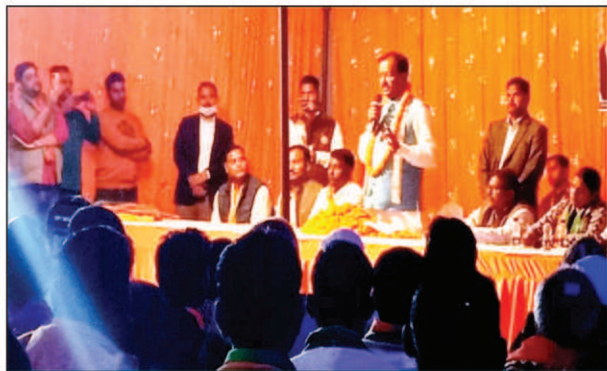
उपस्थित भीड़ को सम्बोधित करते डिप्टी सीएम केशव प्रसाद मौर्य

कल्यानपुर में त्रिदेव संगम कार्यक्रम के आयोजन में योगी मोदी सरकार की उपलब्धियों को डिप्टी सीएम ने बताया