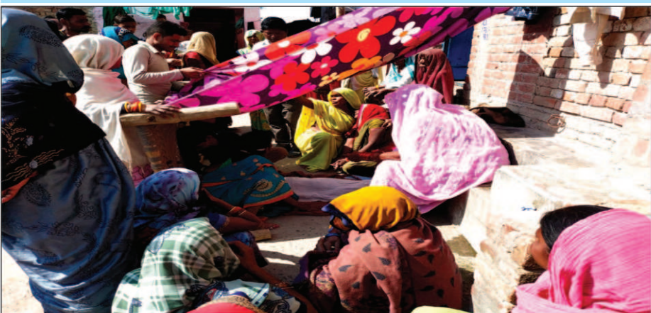
मासूम की मौत पर रोते बिलखते परिजन

अड्डुवा चौकी पुलिस ने मय चालक वाहन हिरासत में लेकर शव पोस्टमार्टम को भेज दिया