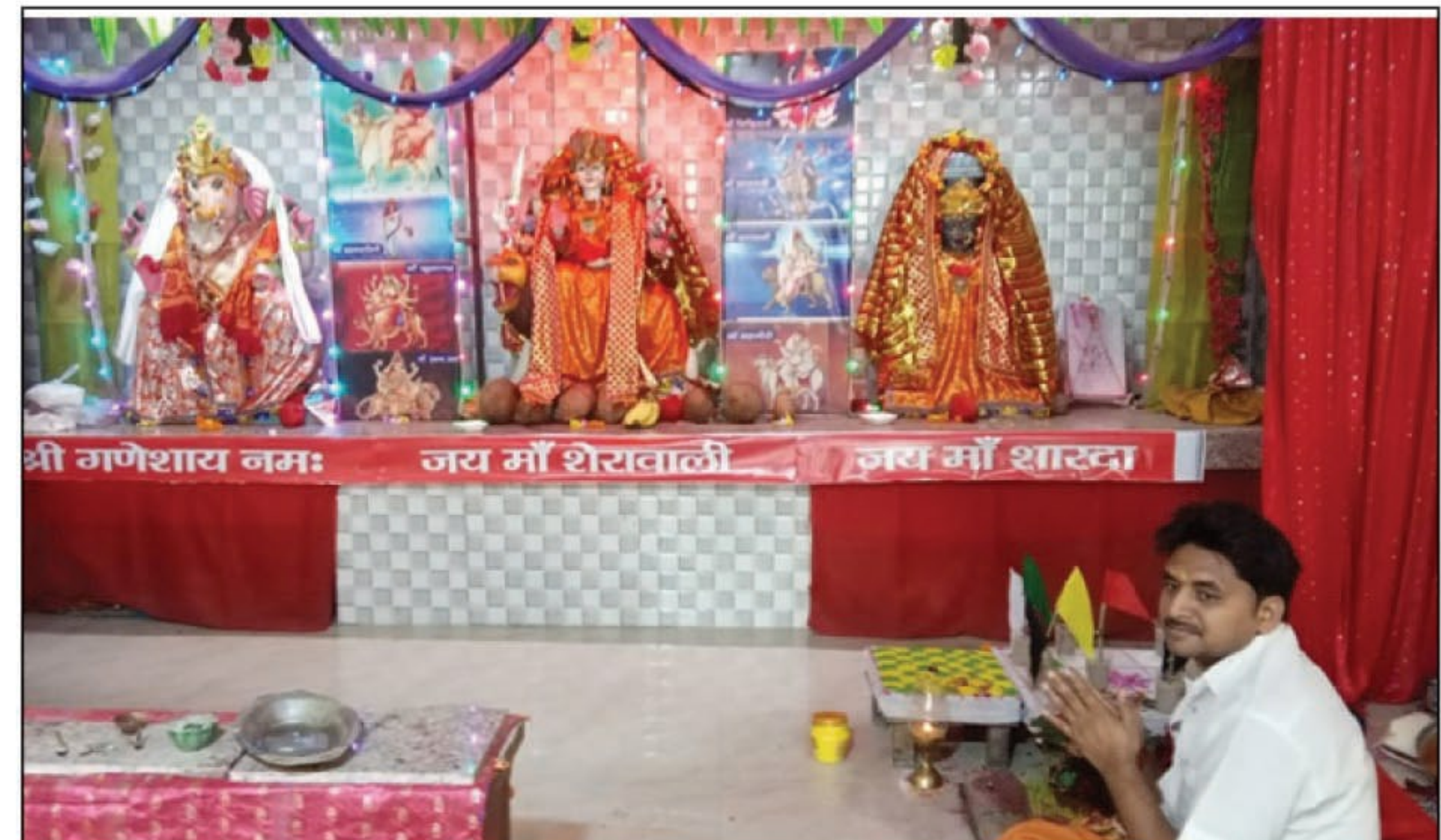
पूजन अर्चना करता भक्त

जारी। नवरात्र पर्व पर गुरुवार को देवी मंदिरों और पूजा पंडालों में मां दुर्गा के षष्ठम स्वरूप कात्यायनी की पूजा-अर्चना विधि विधान से की गई। शोसल डिस्टेंसिंग का पालन करते हुए बच्चे, महिला, बुजुर्ग सभी लोग का सुबह से देर रात तक आस्था का सैलाब प्रतिदिन उमड़ रहा है। जारी बाजार एवं क्षेत्र के विभिन्न स्थानों पर स्थापित की गई दुर्गा प्रतिमाएं लोगों के श्रद्धा व आकर्षण का केंद्र बनी हुई हैं। मां कात्यायनी की कृपा के लिए जगह-जगह रात्रि जागरण और जप का आयोजन हुआ दुर्गा पूजा महोत्सव में गुरुवार को मां दुर्गा के छठे स्वरूप मां कात्यायनी देवी का पूजन-अर्चना श्रद्धालुओं ने विधि विधान से किया गया। मां कात्यायनी को अजन्मा माना गया है। ऐसी मान्यता है कि मां