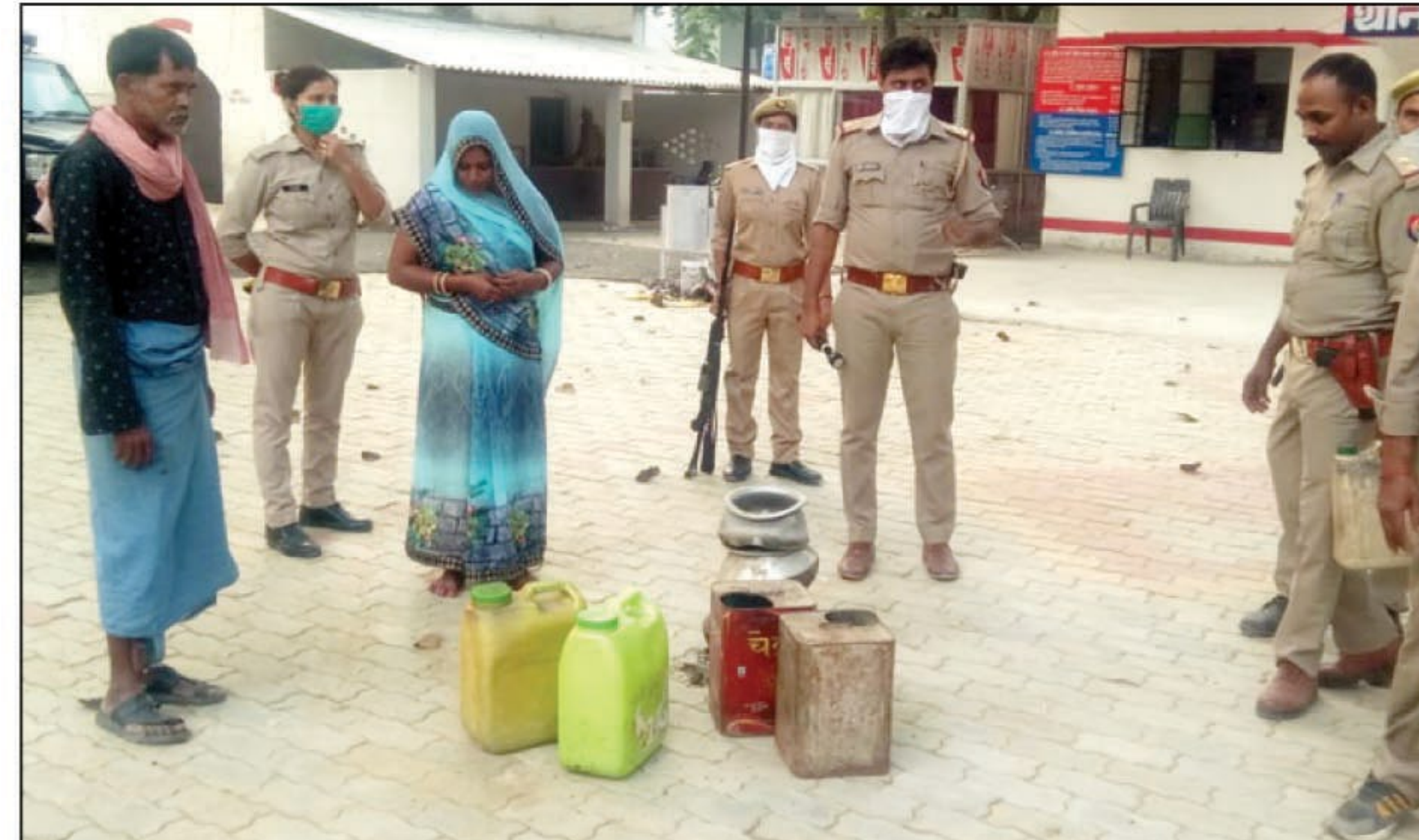
बरामद अवैध शराब व आरोपी

पूजा पंडालों में सुबह से ही श्रद्धालुओं की कतार लगी रही। जारी के काली चौरा, बड़े हनुमान मंदिर, बाबा गोविंद दास, समेत आदि स्थानों पर स्थापित की गयी।