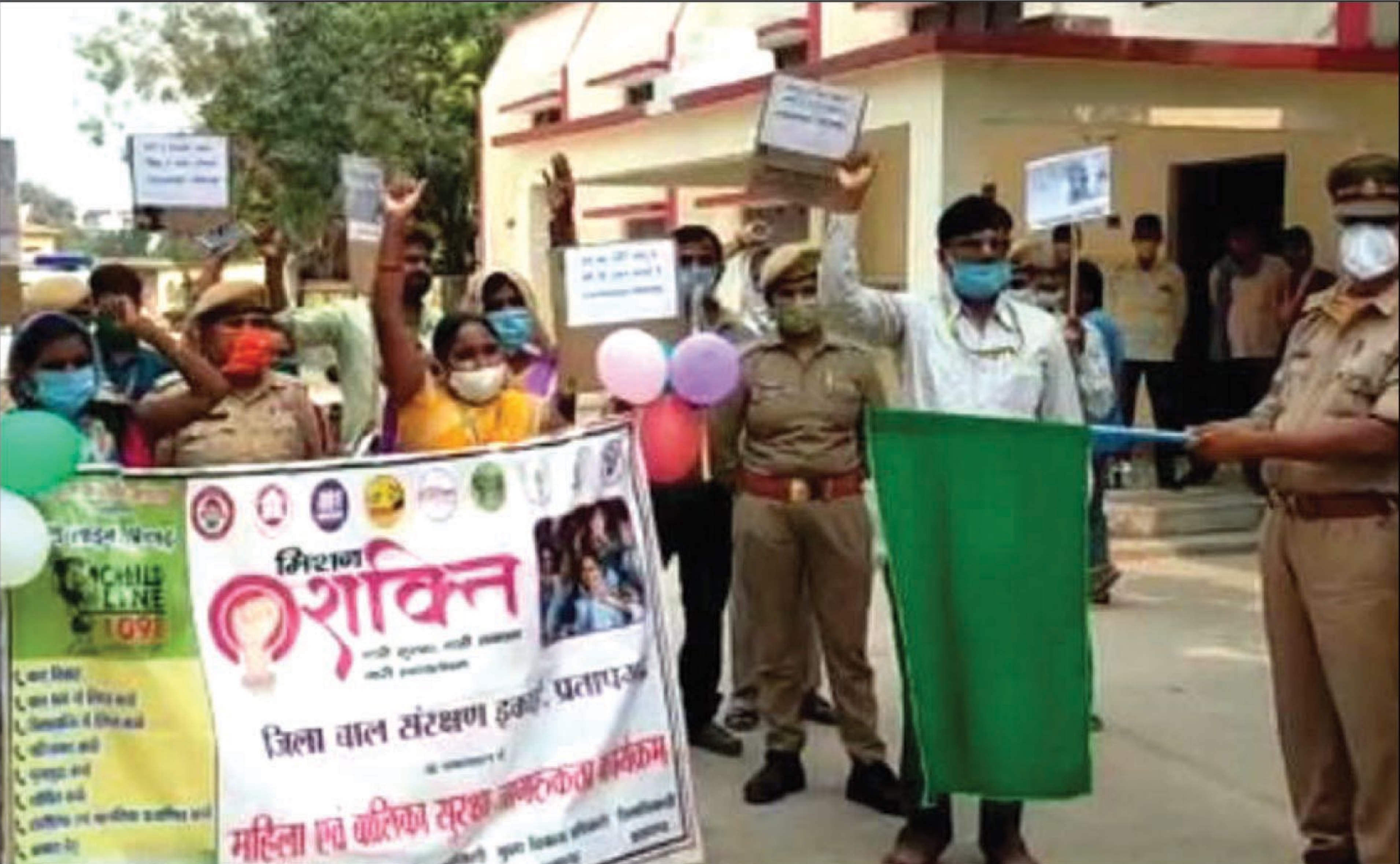
जागरूकता रैली को हरी झण्डी दिखाकर रवाना करते

कराना जन जागरूकता पैदा करना। मुख्य मंत्री के आदेशों का पालन