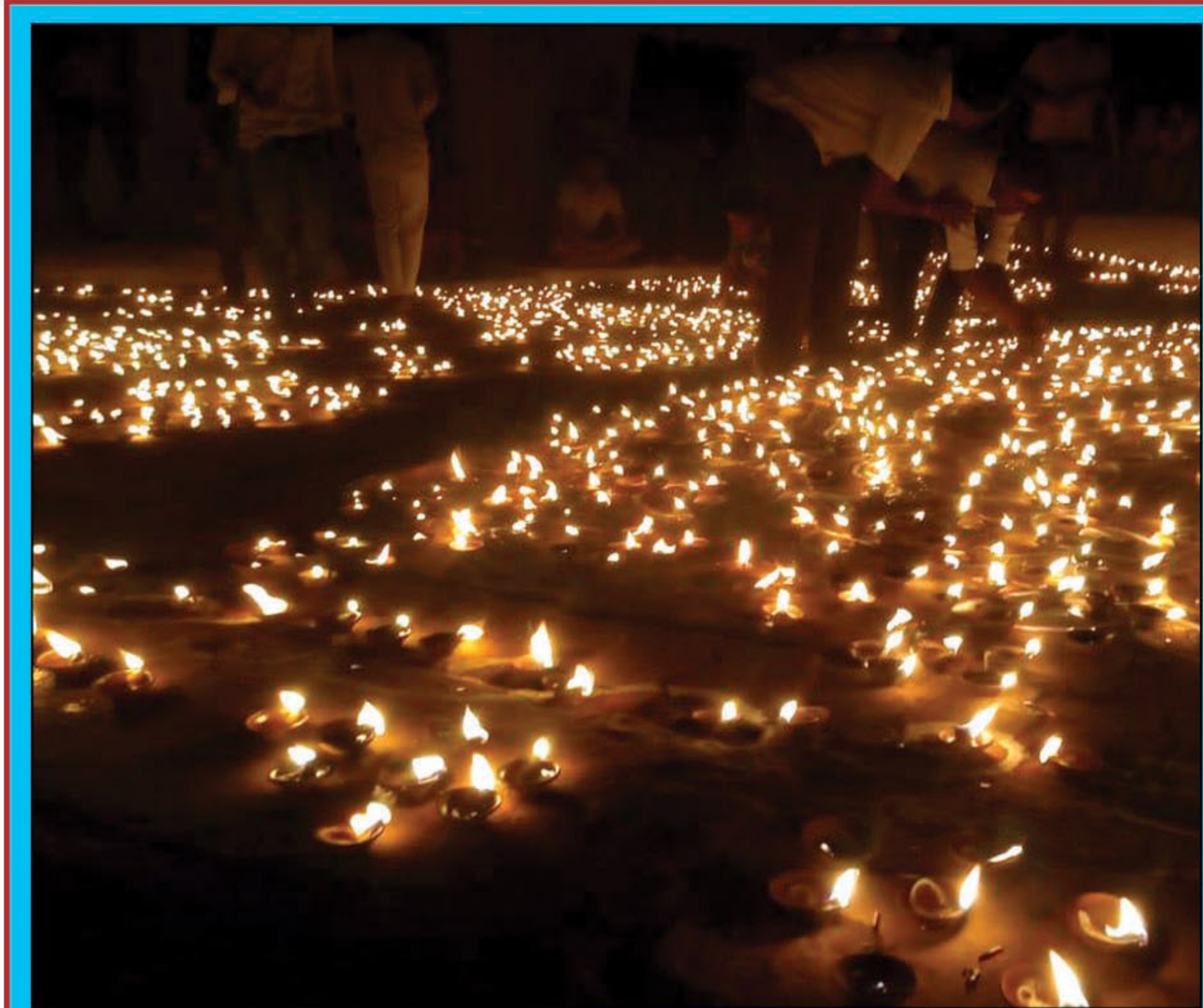
जलते दीप का दृश्य

कौशांबी। दिव्यांगजनों को कॉक्लर इम्प्लान्ट सर्जरी (05 वर्ष तक के बच्चों जो श्रवणबाधित हो) क्रॉक्टिव सर्जरी/कृत्रिम अंग एवं सहायक उपकरण प्रदान करने के लिए चिन्हांकन हेतु समस्त विकास खण्ड स्तर पर शिविर का आयोजन किया जायेगा विकास खण्ड परिसर-मंझनपुर में 28 अक्टूबर को विकास खण्ड परिसर- सरसवा में 29 अक्टूबर को विकास खण्ड परिसर कौशांबी में 31 अक्टूबर को विकास खण्ड परिसर चायल में 04 नवम्बर को विकास खण्ड परिसर नेवादा में 05 नवम्बर को विकास खण्ड परिसर मुरतगंज में 06 नवम्बर को और विकास खण्ड परिसर सिराधू में 07 नवम्बर को तथा विकास खण्ड परिसर कड़ा में 10 नवम्बर को शिविर आयोजित है रजिस्ट्रेशन हेतु आवश्यक अभिलेख लाना आवश्यक है 40 प्रतिशत से अधिक का दिव्यांगता का प्रमाण पत्र।आय प्रमाण पत्र (ग्रामीण क्षेत्र में रु0 46080.00 वार्षिक एवं शहरी क्षेत्र में रु0 56460.00 वार्षिक तक) आधार कार्ड मोबाइल नम्बर पासपोर्ट साइज 01 फोटो के साथ जिन दिव्यांगजनों के दिव्यांगता प्रमाण-पत्र नहीं है, वे भी शिविर में दिव्यांगता प्रमाण-पत्र निर्गत कराते हुये ऑनलाइन आवेदन कर सकते हैं।