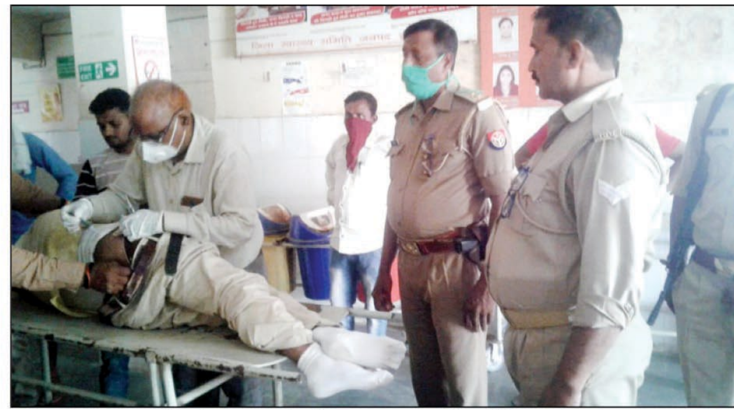
घायलों को इलाज के लिए अस्पताल में भर्ती कराती पुलिस

होलागढ़। होलागढ़ थाना क्षेत्र सुल्तानपुर अखबर गांव के समीप गारापुर मोड़ के पास एक चारपहिया ने बाइक में टक्कर मार दिया जिससे बाइक पर सवार दो अधिवक्ता गंभीर रूप से घायल हो गए।