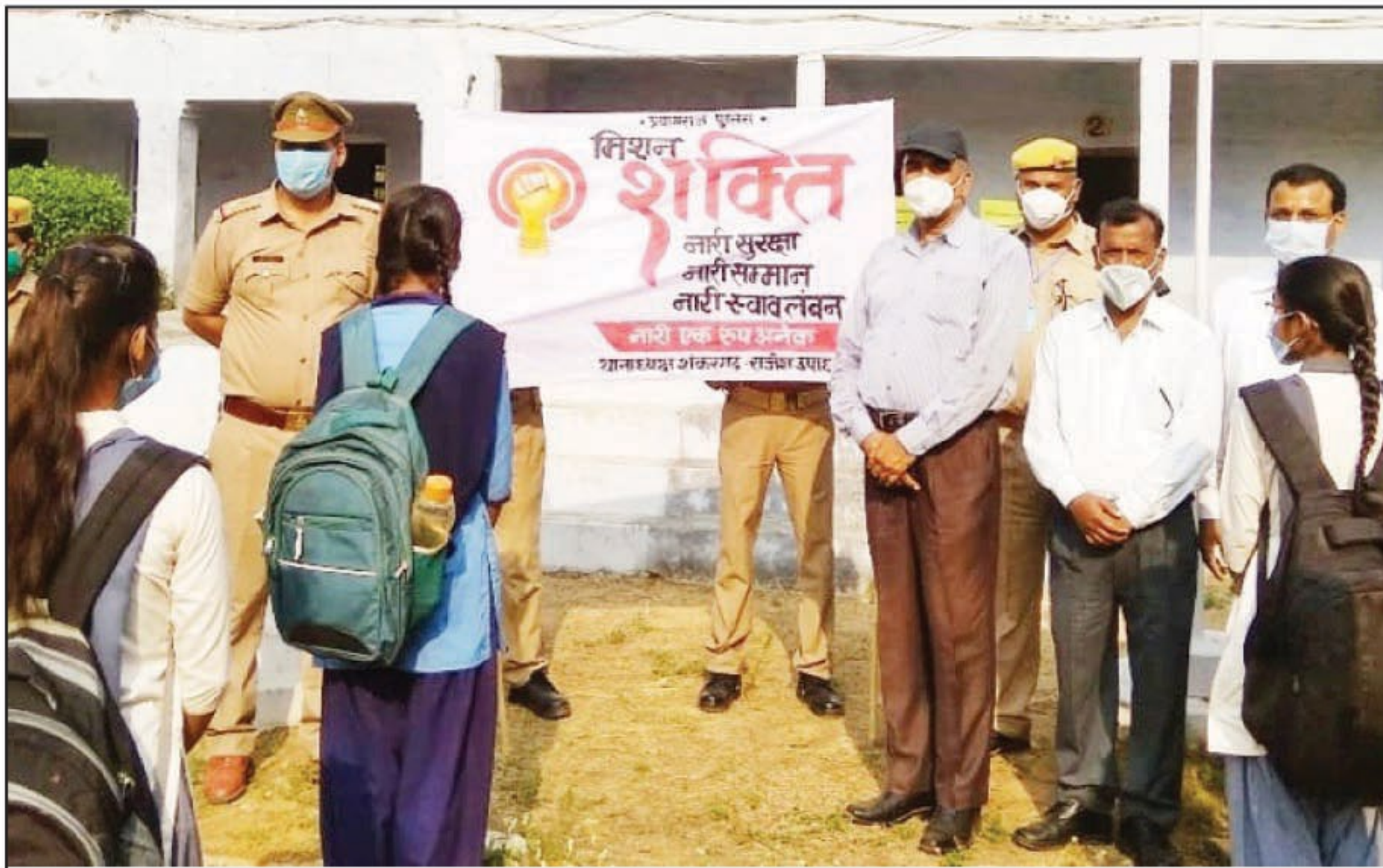
छात्राओं को जागरूक करते हुए

मिशन शक्ति के तहत छात्राओं को दिए सुरक्षा संबंधी कई टिप्स