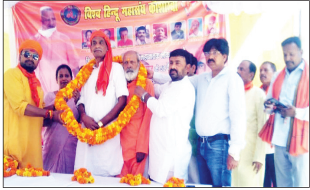
योगी आदित्यनाथ के जन्मदिन पर हिंदू महासभा के लोग