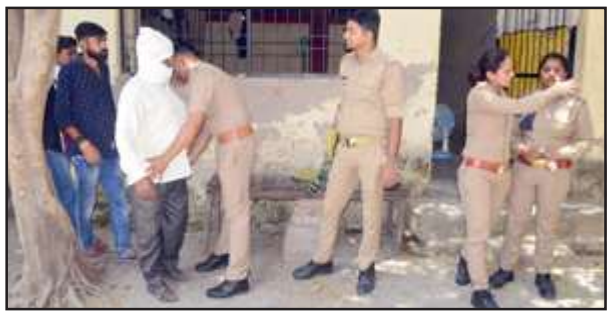
न्यायालय परिसर के गेट पर तलाशी लेते पुलिस कर्मी।

के गेट नं०-3 को पीब्ल्यूडी की तरफ खुलता है तथा गेट नं०-5 जो कचहरी व दीवानी के बीच में है, दोनों गेटों पर पुलिस तलाशी ले रही थी। आज शुक्रवार को प्रातः से ही पुलिसजनों की चहलकदमी न्यायालयों में शुरू हो गई थी। वैसे