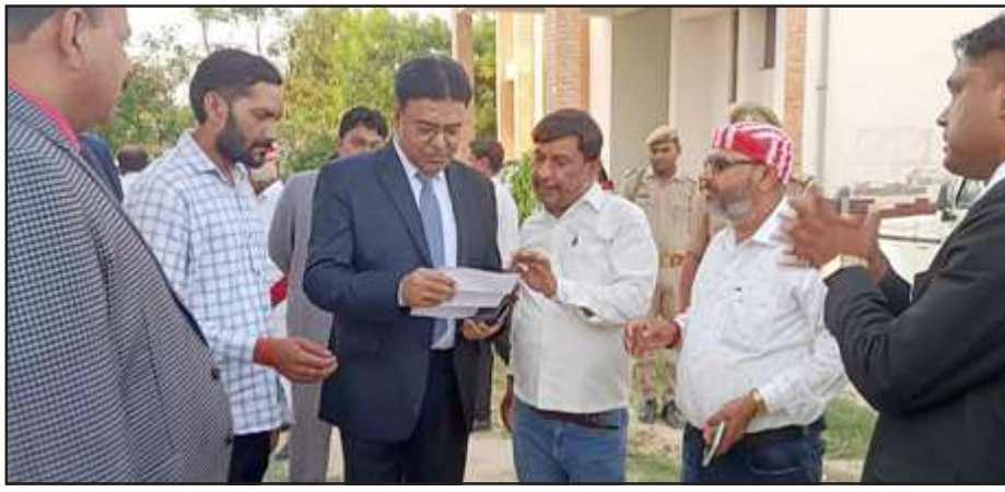
जिला जज को ज्ञापन सौपते लालगंज के अधिवक्ता।

जिला जज ने निर्माण कार्य का अवलोकन करते हुए कार्यदायी संस्था को गुणवत्ता के लिए भी आगाह किया। उन्होंने निर्माणधीन अदालत भवनों में अग्निरोधक संयंत्र तथा सुरक्षित विद्युत्तीकरण व भूकम्परोधी उपकरणों को लेकर भी दिशा निर्देश दिये। वहीं जिला जज ने सिविल न्यायालय परिसर का भी निरीक्षण