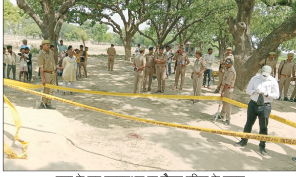
हत्या के बाद घटनास्थल पर मौजूद पुलिस के जवान