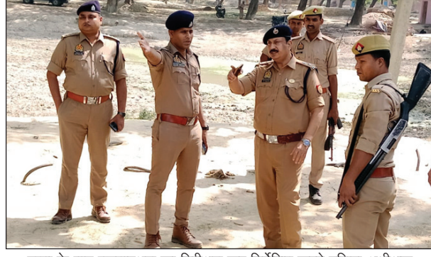
हत्या के बाद घटनास्थल का निरीक्षण कर निर्देशित करते पुलिस अधीक्षक