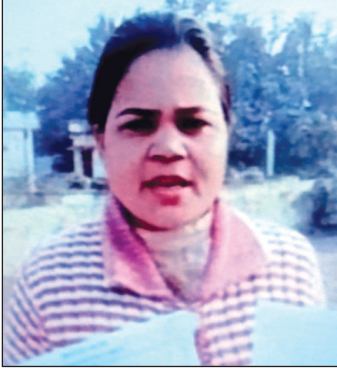
मुतका की फाइल फोटो