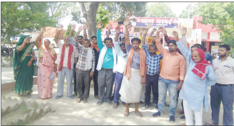
हत्या मामले में थरवई थाने पहुंचकर प्रदर्शन कर रहे ग्रामीण।