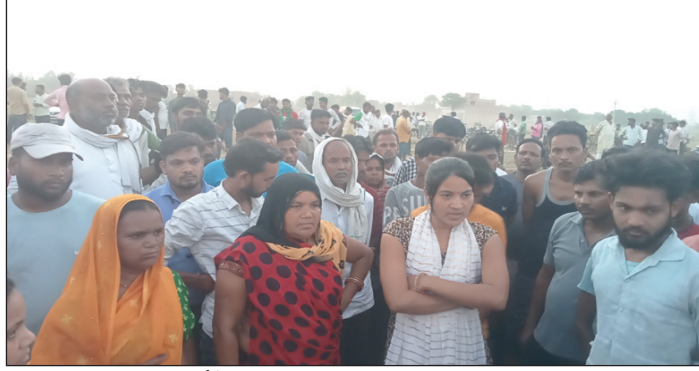
मौके पर जमा भारी भीड़ व गमजदा परिजन