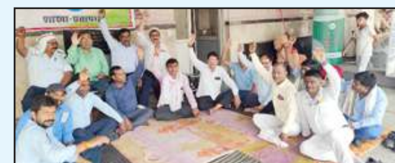
लांबी में धरना प्रदर्शन करते मजदूर यूनियन के पदाधिकारी।