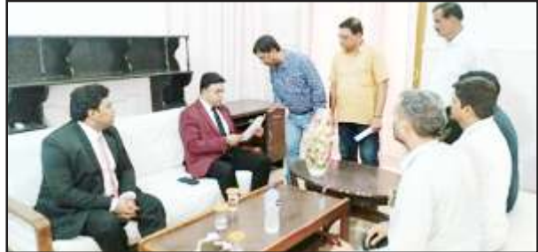
लालगंज निरीक्षण गृह में जिला जज से मुलाकात करते अधिवक्ता।