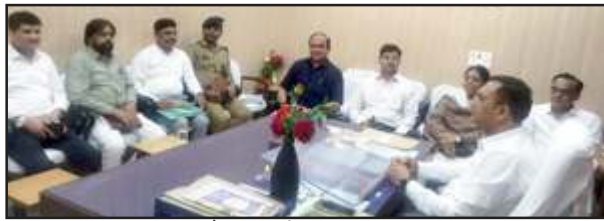
बैठक करते जिला जज।