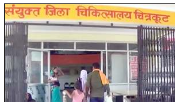
अस्पताल में मरीजों की भीड़।

चित्रकूट। गर्मी और गर्म हवाओं के थपेड़ों से जनजीवन अस्त-व्यस्त हो गया है। यहां हीटवेब व लू लगने से दो दिन में चार लोगों की मौत हुई है, जबकि 24 से ज्यादा लोगों को अस्पताल में भर्ती कराया गया है। लगातार मौसम का पारा बढ़ने से लोग चिंतित हैं। गर्मी से लोगों का घरों से बाहर निकलना मुश्किल हो रहा है। शुकुवार की शाम मानिकपुर के सुभाषनगर के होटल में हलवाई