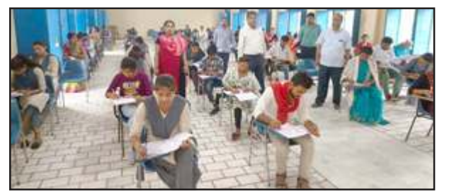
परीक्षा देते छात्र-छात्रायें।

नोडल केंद्र पर महाविद्यालय के साथ सीपी गौतम महाविद्यालय तेंदुवा खुर्द रामनगर के छात्र-छात्राओं की भी परीक्षायें हो रही हैं। इस केंद्र के विश्वविद्यालय के