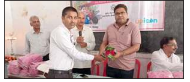
ई-रिक्शा प्रशिक्षण समाप्त।

शनिवार को जिला पिछड़ा वर्ग कल्याण अधिकारी ने कहा कि ये प्रशिक्षण महिलाओं के आर्थिक विकास में अहम भूमिका निभा सकता है। रोजगार के अवसर बढ़ेंगे, धनोपार्जन कर परिवार की आर्थिक मदद कर सकती है। जिला