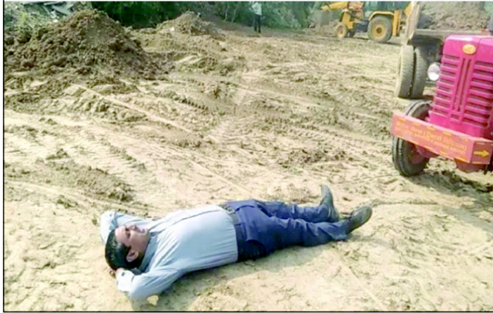
ट्रैक्टर के सामने लेटे सिंचाई विभाग के कर्मचारी

ग्रामीण अनजाने में उक्त कार्यवाही को सही बताते रहे। हालांकि काफ़ी विरोध के पश्चात नाले को पाटना बंद कर दिया गया।