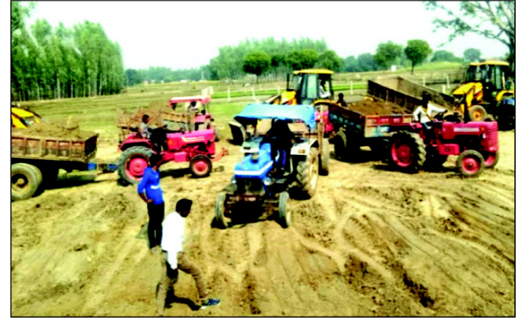
ट्रैक्टर से पाटा जा रहा नाला