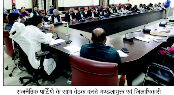
राजनैतिक पार्टियों के साथ बैठक करते मण्डलायुक्त एवं जिलाधिकारी

प्रयागराज। मण्डलायुक्त संजय गोवाल की अध्यक्षता में बुधवार को संगम सभाघर में विभिन्न राजनैतिक दलों के प्रतिनिधियों के साथ विधानसभा निर्वाचन क्षेत्रों की निर्वाचक नामावतियों के विशेष संक्षिप्त पुनरीक्षण कार्यक्रम के सम्बंध में बैठक आयोजित की गयी। बैठक में मण्डलायुक्त ने सभी राजनैतिक दलों के प्रतिनिधियों से चल रहे संक्षिप्त पुनरीक्षण कार्यक्रम में सहयोग प्रदान करने के लिए कहा है। उन्होंने कहा कि कोई भी पात्र व्यक्ति मतदाता बनने से छूटने न पाये। उन्होंने कहा कि जो भी लोग 01 जनवरी, 2022 तक 18 वर्ष की आयु पूर्ण कर रहे हैं, ऐसे युवाओं का मतदाता सूची में नाम दर्ज कराने में सहयोग करें।