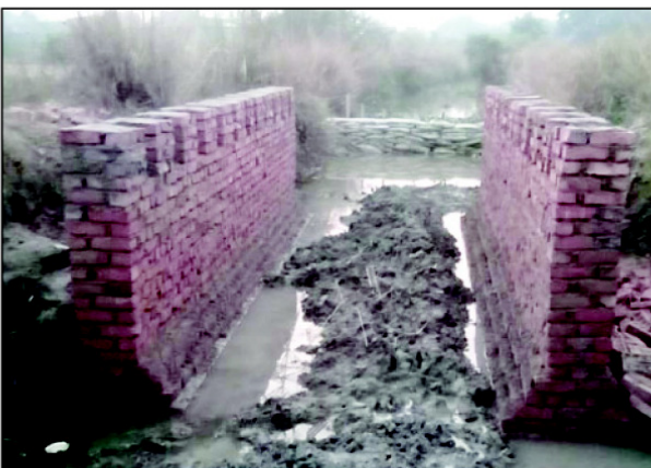
अवैध रूप से बनाए जा रहे सरकारी नाले के उपर पुलिस

धूरपुर क्षेत्र के सेमरा कल्बना व गौहनिया के वार्डर के बीच हावई से सटे सरकारी नाला को सकरा कर भूमाफिया विगत चार दिन पूर्व से अवैध पुलिया बना रहे थे। नाला सकरा करने से बाहिर का पानी जमा होने से किसानों की खेतों में जहां पानी भर जाने का चिंता था तो वहीं