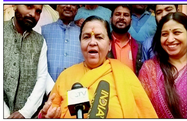
अखंड भारत संदेश

प्रयागराज। पूर्व केंद्रीय मंत्री उमा भारती ने बुधवार को प्रयागराज में मुख्यमंत्री योगी आदित्यनाथ की जमकर तारीफ की। उन्होंने कहा कि सीएम योगी के नेतृत्व में विधानसभा चुनाव में भाजपा के आगे कोई भी दल नहीं टिकेगा। सीएम योगी को लेकर उन्होंने कहा कि वह उन्हीं के