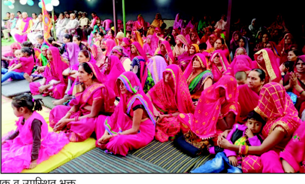
व्यास मंच पर कथा वाचक व उपस्थित भक्त

से कथा व्यास ने सभी को रसशिक कर दिया।उन्होंने बताया कि महारास लीला का श्रवण करने और इसकी कथा सुनने से मानव मात्र में निष्ठापूर्ण प्रेम के जागृति होती है। ऐसी कथा का अमृतपान करने से मन में दुर्भावना,कपट और दूषित भाव दूर होते है और प्रेम का संचार होता है।