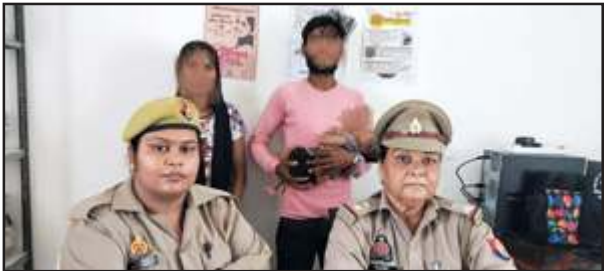
सुलह कराती पुलिस।

डॉग स्कॉयड व एलआईयू की संयुक्त टीम ने सुरक्षा के लिहाज से जिला मुख्यालय के बस स्टैंड, रामघाट, परिक्रमा मार्ग रेलवे स्टेशन आदि स्थानों पर जांच की। जांच में टीम को कोई आपत्तिजनक वस्तु नहीं मिली।