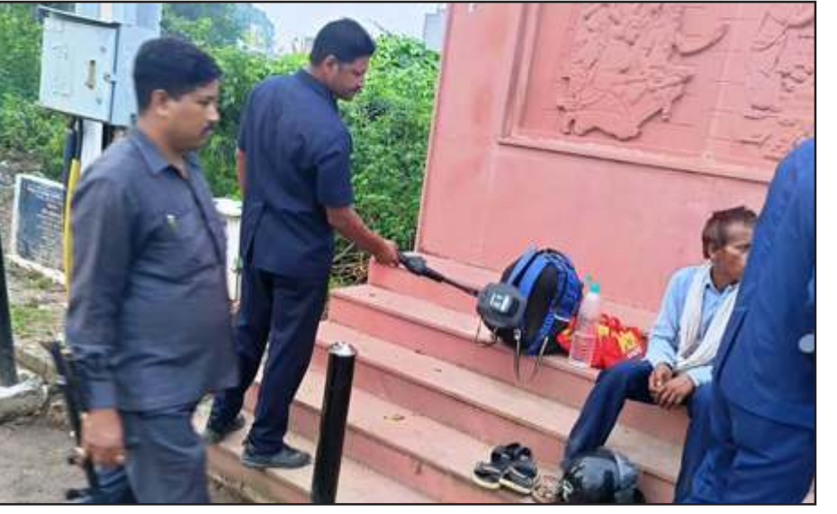
सुरक्षा की जांच करती टीम।