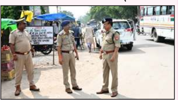
एसपी के साथ मेला का जायजा लेते डीआईजी।