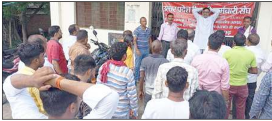
मांगों को लेकर प्रदर्शन करते बिजली कर्मचारी।