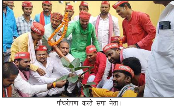
पौधरोपण करते सपा नेता।