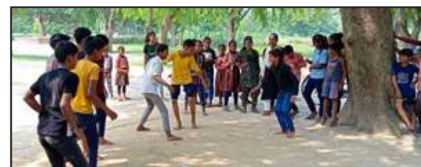
मैत्रीपूर्ण खेल प्रतियोगिता में भाग लेती छात्र-छात्राएं।

गांव में एक बाज़ार, शहीद स्मारक, सरस्वती विद्या मंदिर और संविलित विद्यालय, सीनियर बैरिक स्कूल है। भारतीय इतिहास के गौरव गाथा से आधुनिक पीढ़ी को परिचित कराने के लिए शिक्षकों द्वारा नित्य नए प्रयास किये जा रहे हैं। उच्च प्राथमिक विद्यालय, कांपा मधुपुर, ब्लॉक बाबा बेलखर नाथ धाम, प्रतापगढ़ के छात्र-छात्राओं की शैक्षिक