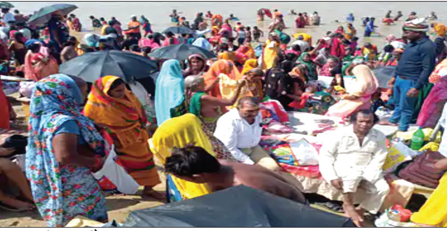
अखंड भारत संदेश

सुहागिन महिलाओं ने पति की लंबी उम्र के लिए पूजा की, पीपल की फेरी लगाई