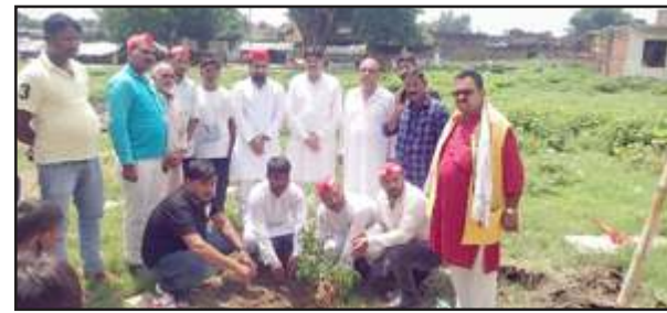
नगर पंचायत सिटी में वृक्षारोपण करते सपाईं।

एक दर्जन दुर्घटित हो गए उनके इलाज की प्रतिपूर्ति नहीं दी गई, करीब 10 कर्मचारी जो विद्युत दुर्घटना से मृतक हो गए उन्हें तात्कालिक सहायता की धनराशि का भुगतान जो तत्काल किया जाना था अब तक नहीं किया गया है। इस मौके पर सैकड़ों की संख्या में कर्मचारी मौजूद रहे।