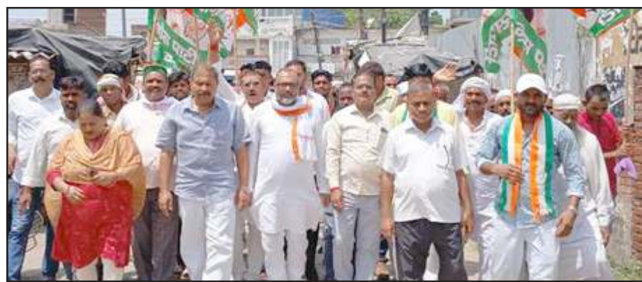
विद्युत कटौती के विरोध में प्रदर्शन करते कांग्रेसी।

जिलाध्यक्ष ने कहा गड़बारा पावर हाउस से एक 33000 लाइन पांच करोड़ की लागत से दीवानी न्यायालय परिसर तक बनी