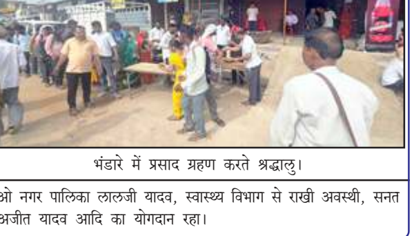
भंडारे में प्रसाद ग्रहण करते श्रद्धालु।