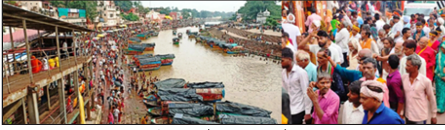
रामघाट में स्नान करते व परिक्रमा लगाते श्रद्धालु।

चित्रकूट। भदई सोमवती अमावस्या मेला पर श्रद्धालुओं का भारी सैलाब उमड़ा। प्रशासन ने दस लाख श्रद्धालुओं के दर्शन का दावा किया है। सोमवार देर शाम तक ये तादाद बीस लाख पहुंचने के आसार हैं। भदई सोमवती अमावस्या को बड़ी अमावस्या माना जाता है। इसमें उत्तर प्रदेश, मध्य प्रदेश, छत्तीसगढ़, महाराष्ट्र, पंजाब, हरियाणा व राजस्थान से लाखों श्रद्धालु आते हैं।