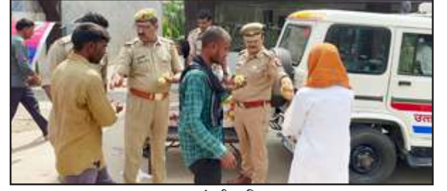
फल बांटती पुलिस।