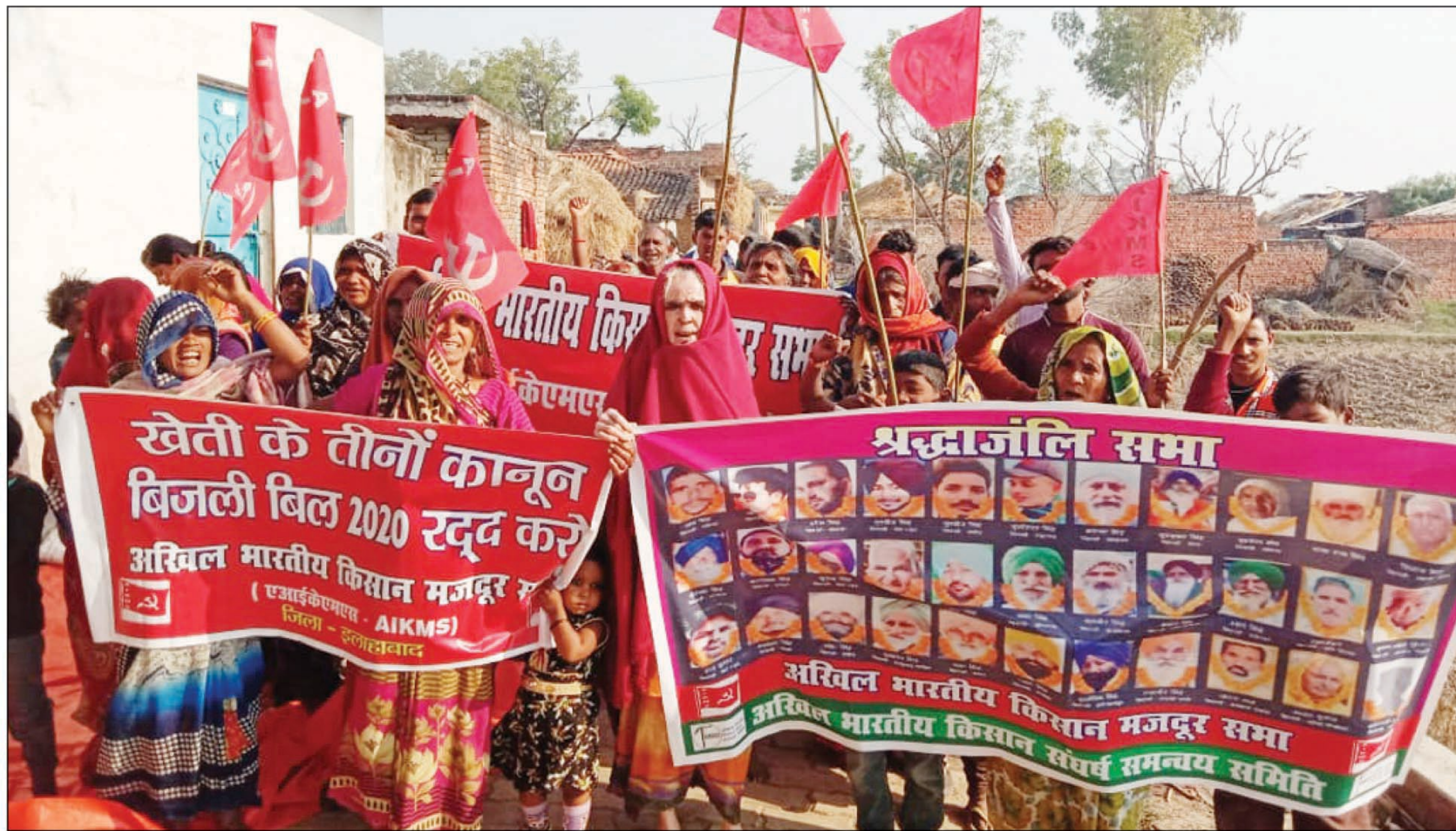
घूरपुर में कृषि के तीन कानून के खिलाफ विरोध प्रदर्शन करते एकेआईएमएस के सदस्य

सभाओं का प्रारम्भ शहीद किसानों के सम्मान में श्रद्धांजलि अर्पित कर नरि लगाकर किया गया। आंदोलन रत शहीद किसान अमर रहे, शहीद किसानों को लाल सलाम, खेती के तीन नए कानून रद्द करो, बिजली बिल 2020 रद्द करो, 24 जून 2019 का वोट पर लगी रोक वापिस लो, आंदोलन में किसानों पर दर्ज सभी केस वापिस लो, कारपोरेट पक्षधर नीतियां रद्द करो, गरीबों को खेती-आवास के पट्टे दो, सभी गरीबों को आवास दो आदि के नारे बुलंद किए गए। सभा के दौरान वक्ताओं ने कहा खेती के तीन नए कानून खेती व मण्डियों में कारपोरेट का कब्जा कराकर किसानों व व्यापारियों को बर्बाद कर देगी।