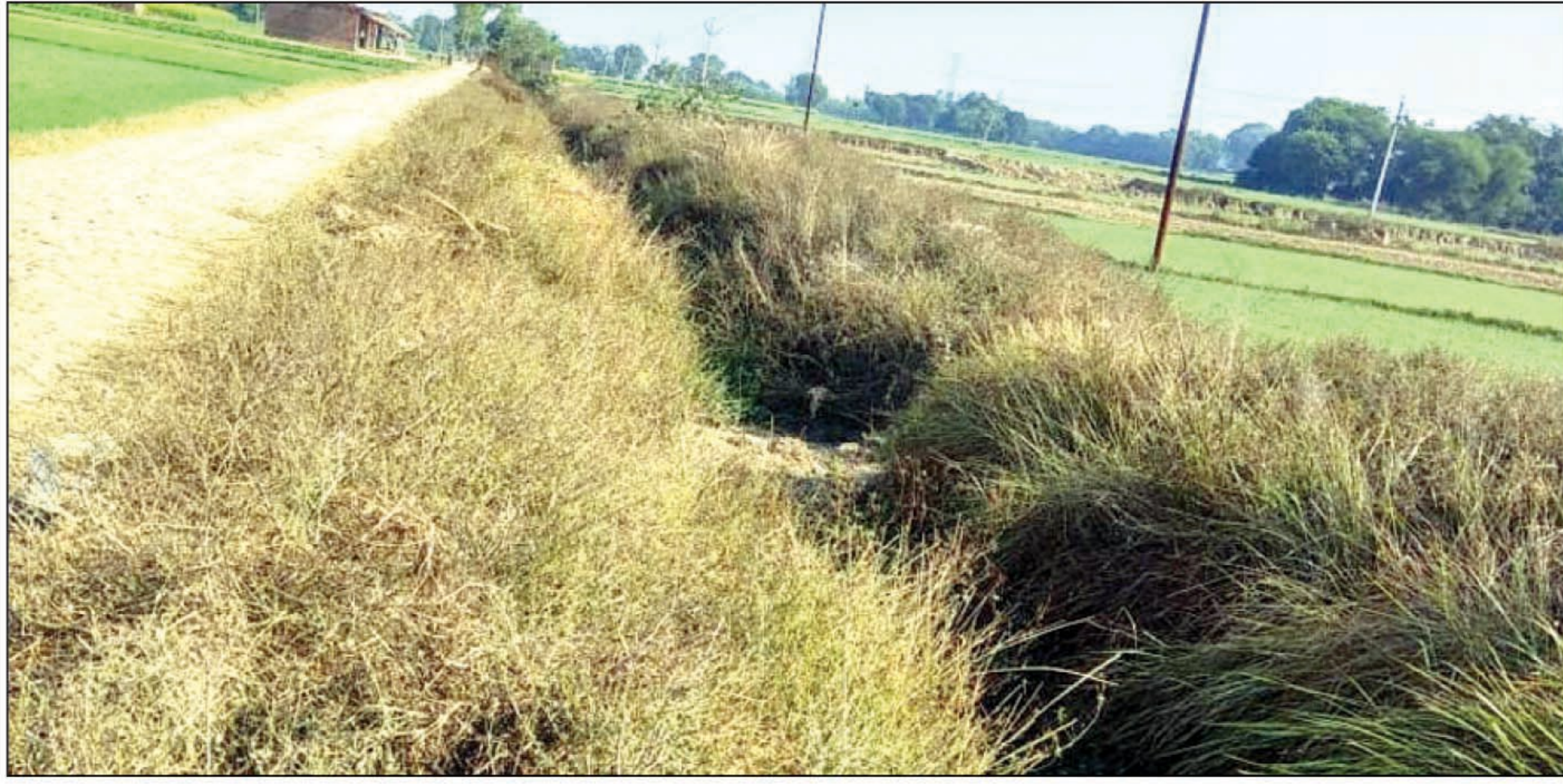
रजबहा व नदियों में उड़ रहा है धूल, किसानों में आक्रोश

जेठवारा। रबी फसल की पहली सिंचाई का समय चल रहा है लेकिन हीरगंज रजबहा व लोनी नदी में अभी भी धूल उड़ रही है। नहर में अब सिल्ट सफाई का काम शुरू हुआ है, लेकिन सम्बंधित ठेकेदार नहर की सफाई में भी खेल कर रहा है। क्षेत्र के किसानों ने ठेकेदार के इस कारनामे की शिकायत किया तो अधिकारियों ने अनसुनी कर दिया। बाबागंज क्षेत्र की शारदा सहायक नहर से निकल कर मान्यता बर्नाक के बगियापुर गांव के पास बकुलाही नदी में गिरने वाली करीब पैंतीस मील लम्बी इस नहर में पिछले ढाई दशकों से टेल पर बसे करीब दर्जनभर गांव के किसानों की सिंचाई के लिए पानी नहीं मिल पा रहा है।बाघराय से लेकर बगियापुर तक हीरगंज रजबहा की वर्षों से मरमत्त नहीं हुई।और हमेशा की तरह इस बार भी सिंचाई विभाग के अधिकारी और ठेकेदार ने मिलकर नहर की सफाई के नाम पर खेल करते हुए बिना सफाई किए ही धन की बंदरबांट किया।अब किसानों की शिकायत को भी अधिकारी अनसुनी