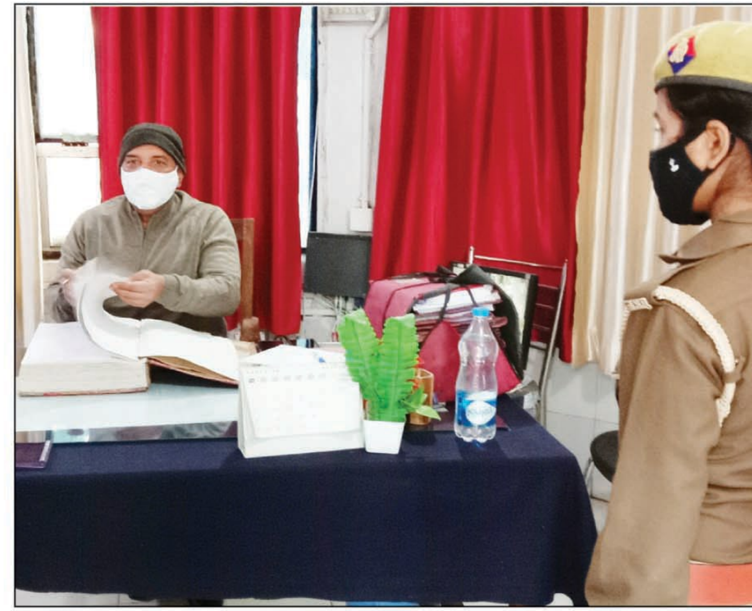
घूरपुर थाने के अभिलेखों की जांच करते एडीजी जोन

अपने कामों में जुट गए। एडीजी ने सबसे पहले थाने में खुले महिला हेल्थ डेस्क में प्रवेश किया और वहां तैनात महिला कर्मी से महिलाओं से संबंधित शिकायतों और उनके निस्तारण के बारे में जानकारी ली। उसके बाद उन्होंने थाने में लॉबि मुकदमों के बारे में जानकारी ली। और अभिलेखों की गहनता से जांच की। इस बीच मौजूद पुलिस कर्मियों को लगन और निष्ठा के साथ अपनी जिम्मेदारियों को निभाने की हिदायत दी। इस बीच थाने में हड़कप मचा रहा।