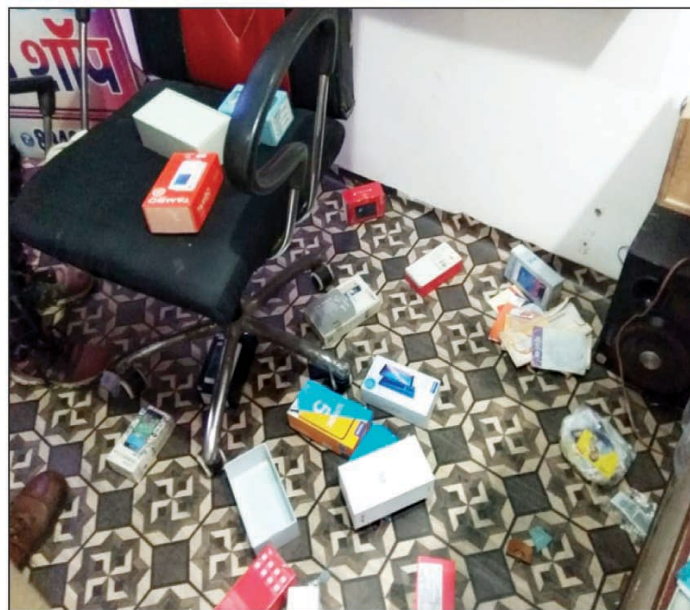
मोबाइल शॉप में चोरी के बाद बिखरा सामान व सूचना के बाद मौके पर पहुंची पुलिस

सोरांव। शिवगढ़ चैराहे पर स्थित अजीत नामक मोबाइल शॉप की दुकान को चोरों ने निशाना बनाते हुए ताला तोड़कर नगदी समेत लाखों का माल खंगाल ले गये। सुबह मोबाइल की दुकान से चोरी की खबर लोगों में पहुंची, तो खलबली मच गई। चोरी की खबर पाकर मौके पर दुकान का स्वामी पहुंचकर दुकान के अंदर अस्त-व्यस्त सामान देखकर दंग रह गया। सूचना मिलने के बाद पुलिस मौके पर पहुंचकर मामले की तहकीकात में जुट गई है। जबकि चोरी के बाद लोगों में दहशत बना रहा। पुलिस अज्ञात चोरों पर रिपोर्ट दर्ज कर