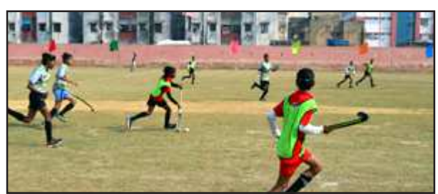
जीआईसी ग्राउण्ड पर हाकी मैच खेलती लड़कियां।

प्रतापगढ़। ग्रास्रूट हाकी प्रमोशन एन्ड डेवलपमेंट प्रोग्राम के अंतर्गत अनवर हाकी सोसाइटी प्रतापगढ़ के जी आई सी ग्राउंड पर दो दिवसीय मैत्री हाकी श्रृंखला का आयोजन हो रहा है जिसमें भीलवाड़ा एकेडमी राजस्थान, आर के राय हाकी एकेडमी पटना, पडिला हाकी एकेडमी प्रयागराज, सुल्तानपुर हाकी एकेडमी एवम अनवर हाकी सोसाइटी प्रतापगढ़ की टीमो के बीच मैच खेला जा रहा है इस प्रतिवोगिता