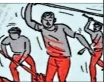
अखंड भारत संदेश

मामूली विवाद में दो पक्षों में जमकर हुई मारपीट