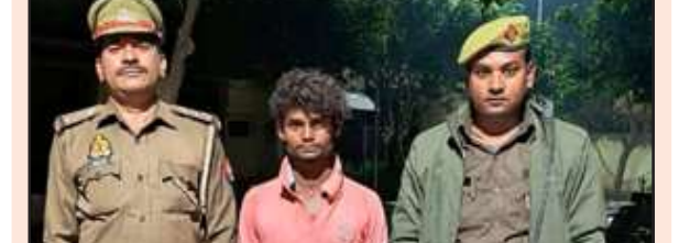
पुलिस गिरफ्त में दुष्कर्म आरोपी।