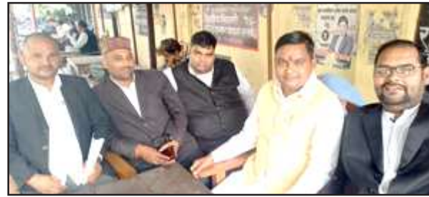
कचहरी में बैठक करते अधिवक्ता।