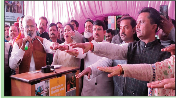
'मेरी कहानी मेरी जुबानी' कार्यक्रम में प्रतिभागियों ने साझा किए अनुभव