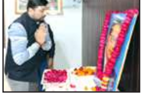
बाबा साहब को श्रद्धांजलि देते डीएम।

चित्रकूट। बाबा साहब डॉ भीमराव अंबेडकर के परिनिर्वाण दिवस पर जिलाधिकारी अभिषेक आनन्द ने कलेक्ट्रेट सभागार में श्रद्धांजलि अर्पित की। जिलाधिकारी ने कहा कि डॉ बाबा साहब भीमराव अंबेडकर ने अपने जीवन में कठिनाइयों से सामना करते हुए सामाजिक लड़ाई लड़ी थी।