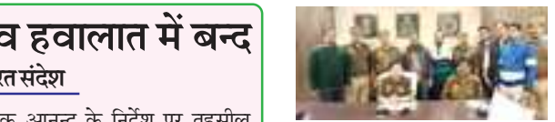
एसपी के नाम पर ठगी करने वाले दो शातिर दबोचे