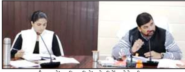
बैठक में अधिकारियों को निर्देश देते डीएम।

रहा है, एक सप्ताह में पूरा हो जायेगा। विशेष मरम्मत व नवीनीकरण भी हो रहे हैं, 15 दिसंबर तक पूरे हो जायेंगे। जिलाधिकारी ने कहा कि विशेष मरम्मत कार्यों में प्रगत कराएँ। लुक संपर्क मार्ग व ददरी संपर्क मार्ग को स्पेशल प्लान में प्रस्ताव बनाकर शासन को भेजकर मंजूर कराएँ। समीक्षा दौरान राष्ट्रीय राजमार्ग बांदा के सहायक अभियंता ने बताया कि जिले में 93 किमी सड़क है, सहायक अभियंता राष्ट्रीय राजमार्ग को डीएम ने निर्देश दिए कि खोह रेलवे क्रॉसिंग के पास सड़क बेहद खराब है, तत्काल ठीक कराएँ। एक्सईएन लोनिवि से कहा कि निरीक्षण कर कहीं-कहीं राष्ट्रीय राजमार्ग को सड़क पर गड्ढे हैं, आख्या दें। एनएच के अधिकारियों से कहा कि स्पीड