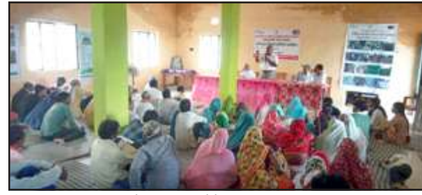
किसानों को प्रशिक्षण देते जिला कृषि अधिकारी।