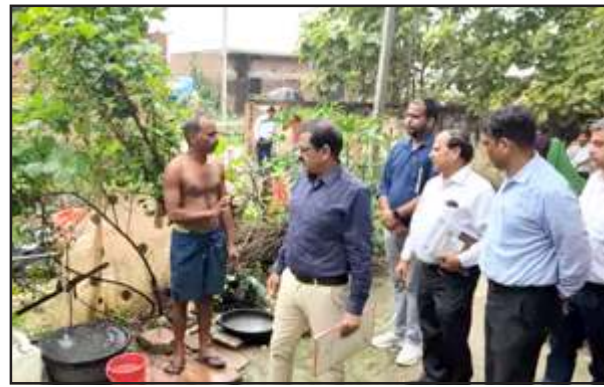
निरीक्षण करते अधिकारी।

बरहट गांव में 92 परिवारों को नल संयोजन प्रदान किया है। जल आपूर्ति की नियमितता सुनिश्चित करने बाबत संबंधित अधिकारियों व पम्प ऑपरेटर के मोबाइल नंबर ग्राम सभाओं में