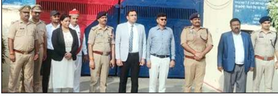
निरीक्षण करते अधिकारिगण।

गुरुवार को निरीक्षण के क्रम में जनपद न्यायाधीश ने महिला बैरक में निरुद्ध महिला बंदियों की विधिक समस्याओं को सुना। साथ ही जमानत, कानूनी सहायता सम्बन्धी आवश्यकताओं के लिए जेल अधीक्षक को उन बंदियों के प्रार्थना पत्र लेकर जिला विधिक सहायता प्राधिकरण के सहयोग से निवारण,