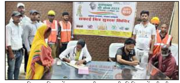
नगर पालिका परिसर में स्वास्थ्य परीक्षण करती चिकित्सकों की टीम।

बता दें कि शहर की गंदगी को साफ करने की जिम्मेदारी निधाने