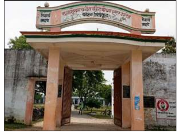
नाथूराम चंदेल संकट मोचन इंटर कॉलेज बछरन।