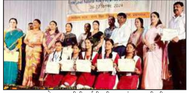
प्रमाण पत्र के साथ जीजीआईसी की छात्राएं व उनकी टीम।