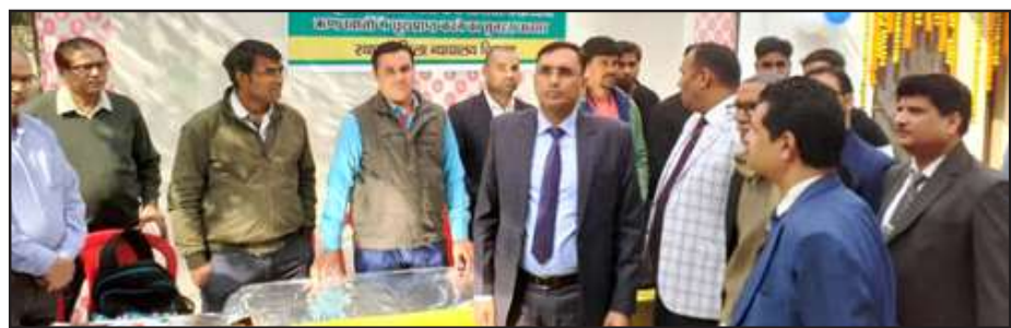
लोक अदालत में बोलते जिला जज।

अखंड भारत संदेश चित्रकूट। राष्ट्रीय लोक अदालत में सुलह-समझौते से 43398 मामलों का निस्तारण हुआ। अर्थदण्ड, प्रतिकर, बैंक ऋण वसूली में चार करोड़ सोलह लाख पच्चीस हजार पांच सौ सत्तर रूपए वसूल किये।