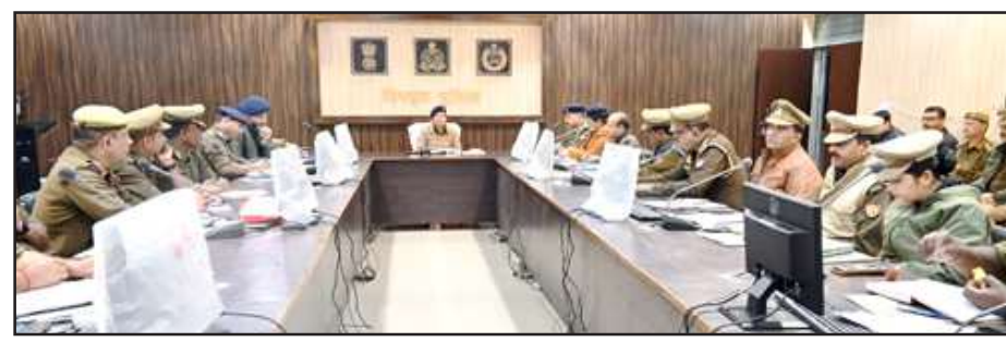
अपराध समीक्षा बैठक में बोलती एएसपी।

में पुलिस खासतौर पर सतर्क रहे। ऐसे लोगों पर कड़ी कार्यवाही की जाये। थाना प्रभारी को बताया कि मातहत तैनात पुलिस बल की गतिविधियों पर नजर रखें। कोई भी पुलिस कर्मी किसी भी तरह के अपराध में शामिल मिला तो कार्यवाही की जायेगी। उन्होंने कहा कि जितने मामले इस वर्ष दर्ज हुए हैं, विवेचना कर इसी वर्ष निस्तारित करें। संगीन अपराधों को खासतौर पर समीक्षा की। कहा कि लिम्बत विवेचना का निस्तारण किया जाये।