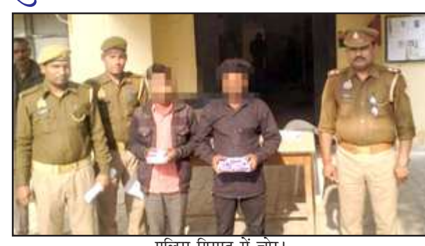
पुलिस गिरफ्त में चोर।