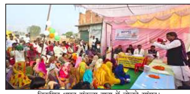
विकसित भारत संकल्प यात्रा में बोलते सांसद।