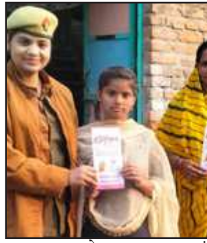
हेल्पलाइन नम्बर बांटती एंटी रोमियो टीम।