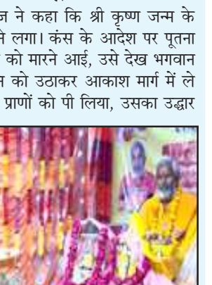
पांचवे दिन कथा व्यास की पूजा करते यजमान।