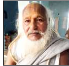
एसपी से सुलह की गुहार लगाते महंत। को दोनों को कोई अधिकार नहीं है, क्योंकि निर्माही अखाड़ा से इनका कोई लेना-देना नहीं है। उन्होंने कहा कि निर्माही अखाड़ा व मंदिर की सुलह व शांति को प्रभारी चैकी निरीक्षक खोही को निर्देश दें, ताकि वह तथा मंदिर के पुजारी के साथ कोई जोर-जबरदस्ती न हो सके, शांति व्यवस्था बहाल रहे। उन्होंने पुलिस अधीक्षक से मांग किया कि चैकी प्रभारी खोही को शांति व्यवस्था व परस मंदिर के पुजारी की सुलह करने का आदेश दिया जाये।