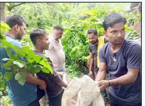
सफाई करते समिति के लोग।