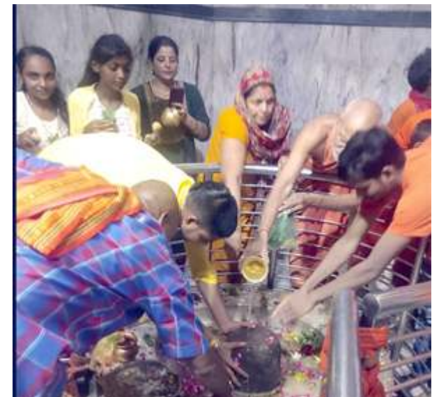
रविवार को बाबा धाम में जलाभिषेक करते श्रद्धालु।

लालगंज, प्रतापगढ़। सावन के चौथे सोमवार को लेकर रविवार को दोपहर बाद से कांवड़िया श्रद्धालुओं का हुजूम बाबा धुइसरनाथ धाम में रौनक लिये दिखा। शिवभक्त डीजे की धुन पर नाचते गाते बाबा धाम पहुंचने लगे। मानिकपुर के अलावा प्रयागराज से भी पवित्र गंगा जल के साथ कांवड़ लेकर शिवभक्त बोल बम के जयघोष में मगन दिखे। महिला श्रद्धालुओं को भी कांवड़ यात्रा में उत्साहित देखा गया। कांवड़िया समूह की पैदल यात्रा को लेकर पुलिस प्रशासन भी दोपहर बाद से सतर्क दिखा। लालगंज चैक पर बैरिकेटिंग कर बड़े वाहनों को रूट डायवर्जन से धुइसरनाथ रोड के बगल मार्गों से निकाला गया। बाबा धाम में भी सई तट से लेकर परिसर में पुलिस को सतर्क देखा गया। सांगीपुर के देउम चौराहे पर भी पुलिस का भारी बंदोबस्त दिखा। लीलापुर के सगरा सुन्दरपुर बाजार में पुलिस दोपहर बाद से हर स्थिति पर नजर जमाये दिखी। वहीं सावन के चौथे सोमवार को बाबा धाम में बड़ी संख्या में शिवभक्तों की ओर से रूद्राभिषेक को लेकर मंदिर प्रबंधन समिति भी व्यवस्था की रूपरेखा में जुटी दिखी। इस बार सावन में पांच सोमवार को लेकर चौथे सोमवार को प्रशासन भीड़ के बढ़ने के अनुमान में व्यवस्था को चुस्त दुरूस्त बनाए रखने में मशक्कत में रविवार से ही देखा जा रहा है।