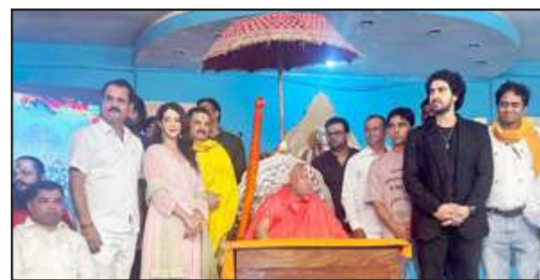
ट्रेलर लांच करते रामभद्राचार्य।

पश्चिम बंगाल की अशांत पृष्ठभूमि पर आधारित ये फिल्म बंगाल की उथल-पुथल भरी पृष्ठभूमि