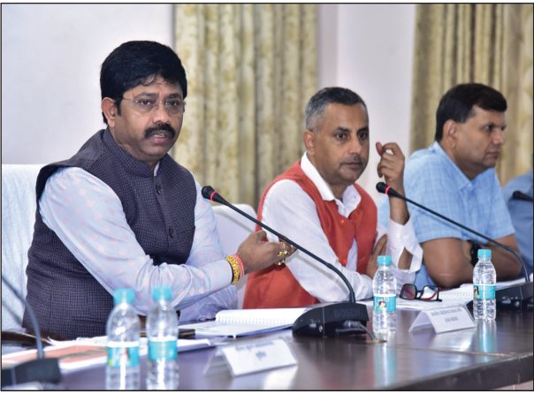
अखंड भारत संदेश

अधिकारियों के साथ कैबिनेट मंत्री ने सर्किट हाउस सभागार में की बैठक