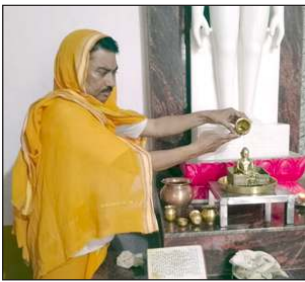
भगवान पार्श्वनाथ का अभिषेक करते अनुयायी।

प्रतापगढ़। श्री दिगम्बर जैन मन्दिर कटरा मेदनीगंज में जैन धर्म के 23वें तीर्थंकर भगवान पार्श्वनाथ का निर्वाण महोत्सव परम्परागत ढंग से मनाया गया। जैन मन्दिर में प्रातः सात बजे भगवान पार्श्वनाथ का अभिषेक मंगल मंत्रों, वाद्य यन्त्रों एवं जयकारों के बीच सम्पन्न हुआ। तत्पश्चात विश्व शांति की कामना के साथ भगवान का शांतिधारा अभिषेक हुआ। तत्पश्चात जैन मंदिर कटरा