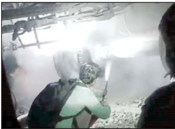
आग को बुझाते लोग।

जानकारी के अनुसार पदावत एक्सप्रेस रात करीब आठ बजे मां बेल्हा देवी धाम प्रतापगढ़ रेलवे स्टेशन से दिल्ली के लिए छूटी। इसके आधे घंटे बाद जगसरगंज और मां चंद्रिका देवी धाम रेलवे स्टेशन के बीच बोगी में यह हादसा हुआ। रेलवे के सूत्रों का कहना है कि चक्के का ब्रेक पैड लॉक होने के कारण ऐसा हुआ था। इसकी दो वजह हो सकती हैं। पहला चैन पुलिंग होने पर ब्रेक जाम हुआ होगा। दूसरा मां बेल्हा देवी धाम से चलते समय गाड़ी का ब्रेक रिलीज न