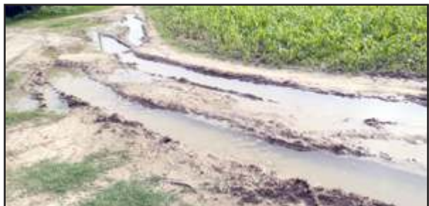
कीचड़ में तब्दील जगदीशगढ़ गांव को जाने वाला मार्ग।

पट्टी, प्रतापगढ़। गांव में जाने वाले मार्ग पर बरसात के पानी भरने की वजह से कीचड़ में तब्दील हो गया है। जिससे ग्रामीणों का आवागमन बाधित हो गया है। विकास खंड बाबा बेलखरनाथ धाम क्षेत्र के शीतलगंज उडैयाडीह मार्ग से जगदीशगढ़ गांव में जाने वाले मार्ग पर बरसात में कीचड़ हो गया है। ग्रामीणों को आने जाने में भारी कठिनाइयों का सामना करना पड़ रहा है। ग्रामीणों ने इस सड़क का निर्माण कराने के लिए कई बार जनप्रतिनिधियों को अवगत कराया लेकिन अभी तक इसे बनाया नहीं गया। एक किलोमीटर सड़क का निर्माण कार्य के लिए पूर्व मंत्री राजेंद्र