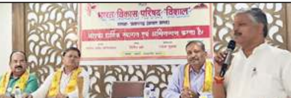
मोती महल सभागार में आयोजित बैठक में बोलते अतिथि।

उन्होंने कहा कि आज हमारे पास के देशों में खराब स्थितियों के पीछे यह ना होना दिख भी रहा है,