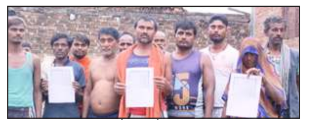
आरोप लगाते ग्रामीण।