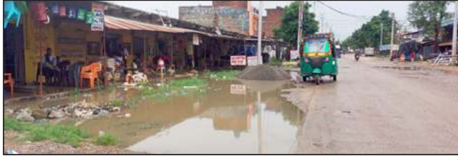
सड़क पर भरा पानी।