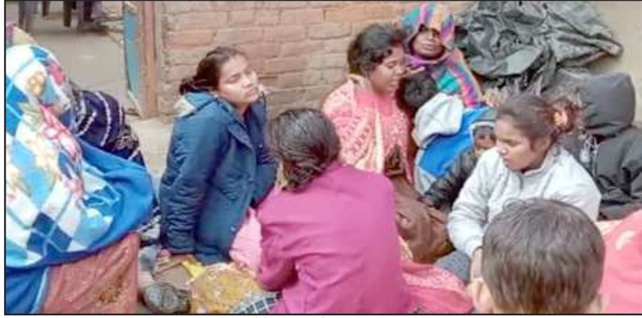
रोते बिलखते परिजन

कोखराज थाना क्षेत्र के बाबा चौराहे के पास सोमवार की रात्रि लगभग 10:00 बजे तेज रफ्तार वाहन ने बाइक सवारों को रौंद दिया है जिससे घटनास्थल पर 2 लोगों की दर्दनाक मौत हो गई है मामले की सूचना मिलते ही स्थानीय पुलिस घटनास्थल पर पहुंची है और दोनों लहलुहान शव को कब्जे में लेकर पोस्टमार्टम के लिए भेज दिया है घटना की जानकारी मिलते ही मृतक के परिजनों रिश्तेदारों में कोहराम मच गया है मृतकों के परिजन रिश्तेदार घटनास्थल पर पहुंच गए हैं घटनास्थल पर कोहराम मचा हुआ है।