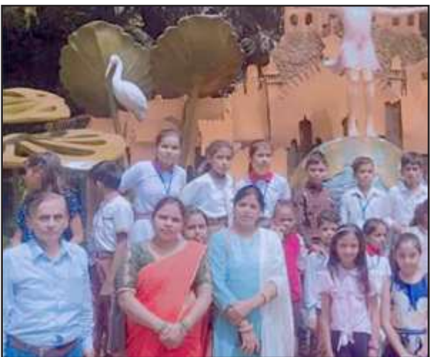
लखनऊ चिड़ियाघर के सामने मौजूद हैप्पी टाइम स्कूल के बच्चे व शिक्षकगण।

प्रतापगढ़। शहर के नया माल गोदाम रोड स्थित हैप्पी टाइम स्कूल के बच्चों ने रविवार को लखनऊ के चिड़ियाघर में विभिन्न प्रकार के जानवरों व पशु-पक्षियों को देखकर कई घंटे तक उसका लुफ्त उठाया। बच्चों ने चीता, बाघ, शेर, अजगर सांप, हिरन, गिद्ध सहित अनेक प्रजातियों के जानवरों को देखते रहे।