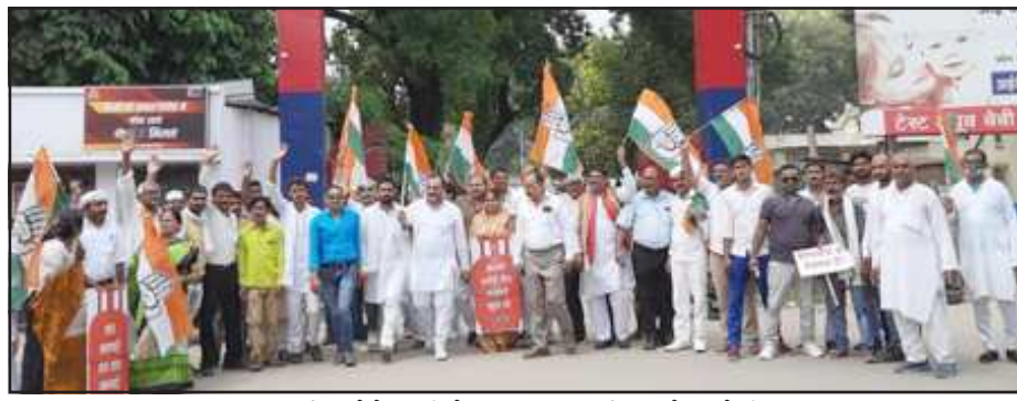
मंहगाई व बेरोजगारी के खिलाफ प्रदर्शन करते कांग्रेसी।

गिरफ्तारी के बाद पुलिस लाइन ले जाया गया कांग्रेसियों को