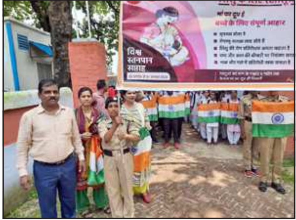
जनजागरूकता रैली में शामिल छात्र-छात्राएं।