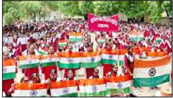
जीजीआईसी में आयोजित महोत्सव में शामिल छात्राएं।