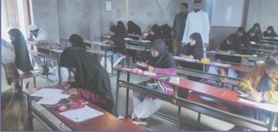
परीक्षा केन्द्र पर मदरसा बोर्ड की परीक्षा देते परीक्षार्थी।

अनुपस्थित नहीं रहा। मदरसा बोर्ड की परीक्षाएं आज शनिवार को नौ परीक्षा केन्द्रों पर शुरू हुईं जिसमें सेकेण्डरी फारसी में 485 परीक्षार्थी