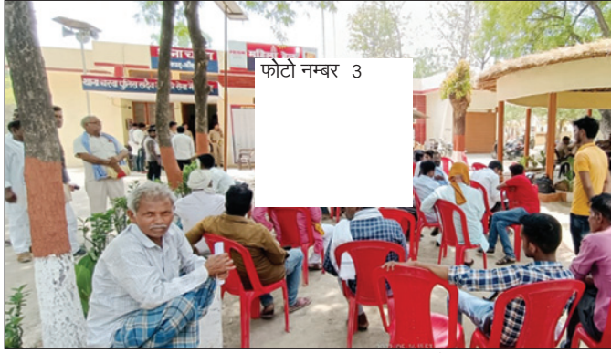
फोटो नम्बर 3