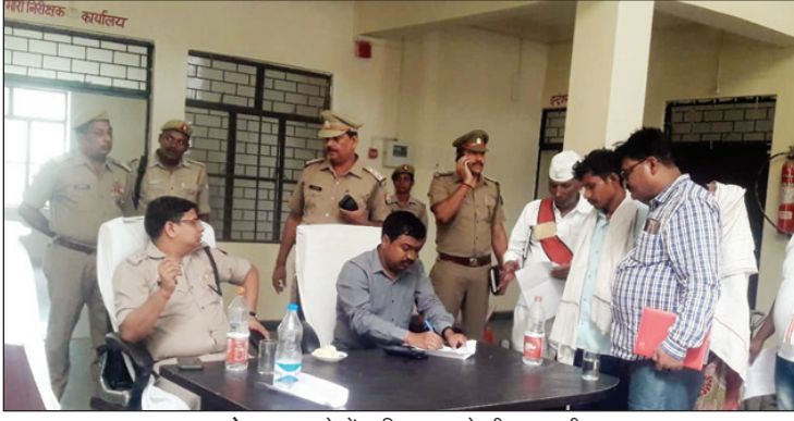
कोखराज थाने में फरियाद सुनते डीएम एसपी

डीएम एसपी ने कहा कि फरियादियों की समस्याओं के निस्तारण में किसी प्रकार की लापरवाही उदासीनता या पक्षपात बर्दाश्त नहीं किया जाएगा