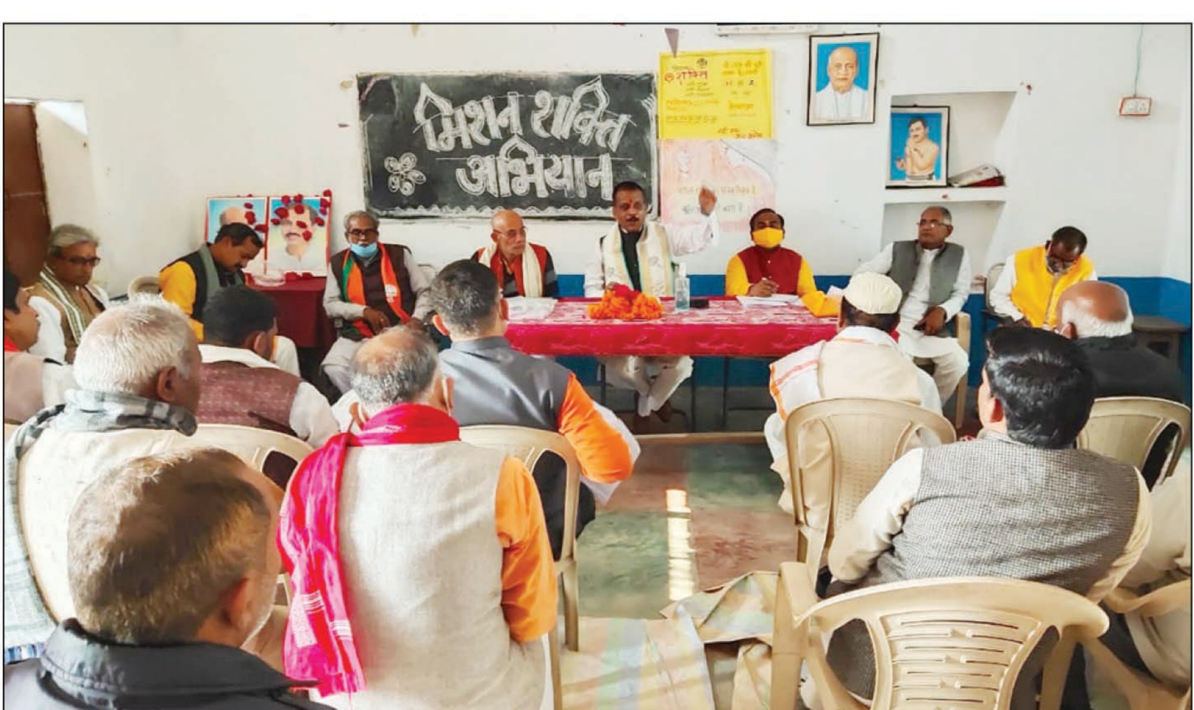
बैठक में शामिल भाजपा कार्यकर्ता