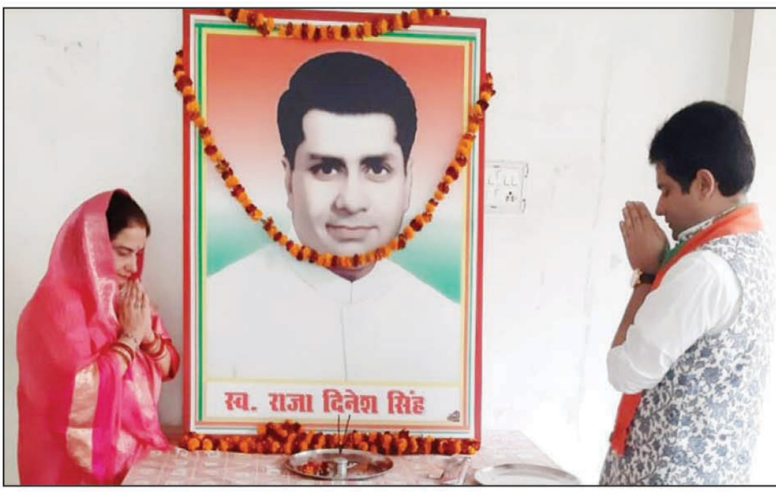
पूर्व विदेश मंत्री राजा दिनेश सिंह की पुण्यतिथि पर श्रद्धा सुमन अर्पित करते हुए

प्रतापगढ़। 30 नवम्बर 1995 को प्रतापगढ़ ही नहीं वरन भारत की भूमि को अपने कृत्यों से सुसज्जित कर दुनिया में भारत पहचान दिलाने वाले और 50 वर्ष मातृभूमि की सेवा में समर्पित करने वाले राजा दिनेश सिंह जी की पुण्यआत्मा ने परमात्मा के श्री चरणों प्रस्थान किया था। राजा दिनेश सिंह ने भारत की राजनीति के साथ ही जनता के दिलों में एक अलग स्थान बनाये थे जो उनके जाने के बाद रिक्त सा हो गया है जिसे भर पाना आज तक सम्भव नहीं हो पाया है। उनके जैसा राजनैतिक कुशल व्यक्तिव दुसरा दिखाई नहीं पड़ा। 19 जुलाई 1925 को