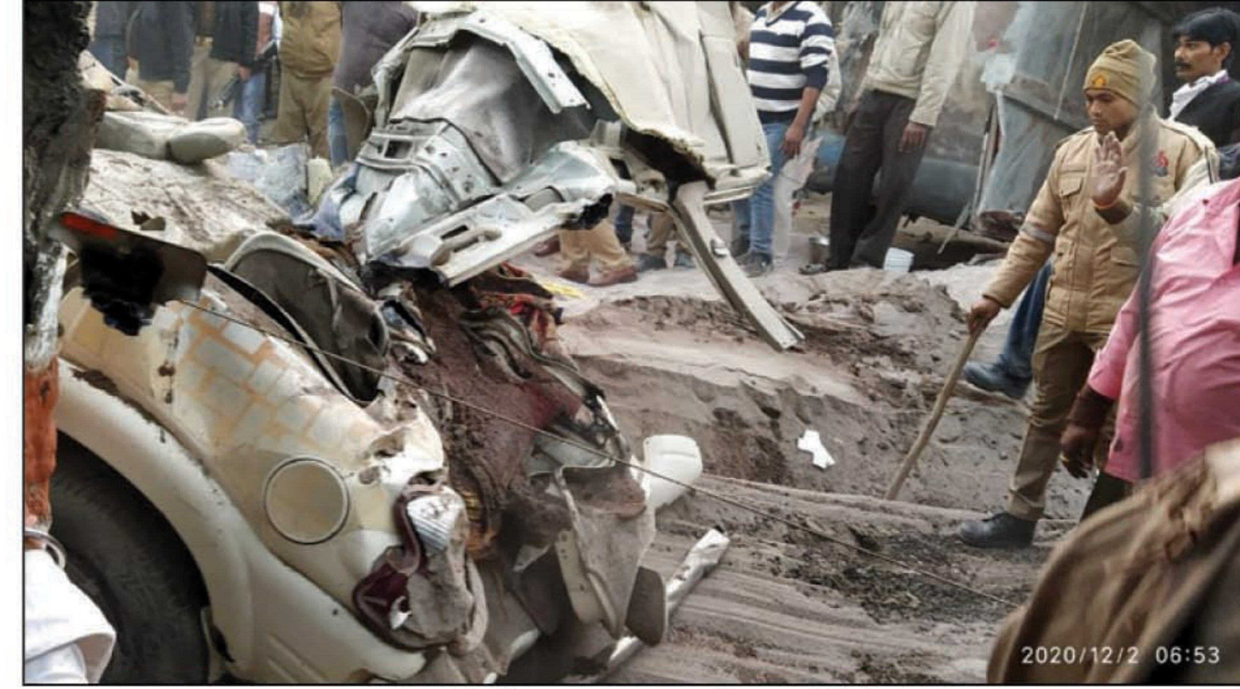
हादसे में चकनाचूर हुई स्कार्पियो

कौशांबी। कड़ा धाम कोतवाली क्षेत्र के देवीगंज चौराहे के पास स्कार्पियो सवार 8 लोगों पर ट्रक पलटने के पीछे ट्रक चालक का चलती ट्रक से कूद जाना मुख्य कारण बना है यदि परिवहन विभाग के चालक के नियमों की बात करें तो अपनी जान देने के बाद भी दूसरे की जान बचाना चालक का कर्तव्य है यदि चालक ने अपनी जान बचाने के लिए वाहन को सड़क पर चलते हुए छोड़ दिया है तो यह दुर्घटना नहीं मानी जाती है और सीधा आठ लोगों की मौत का जिम्मेदार चालक को माना जाता है क्या पुलिस आठ लोगों की मौत का जिम्मेदार चालक को मानेगी या फिर 8 लोगों की मौत को पुलिस हादसा मानकर इस गंभीर अपराध को जानबूझ कर करने वाले ट्रक चालक की दुर्घटना में गिरफ्तारी कर जेल भेजेगी या फिर चालक नियमावली के अंतर्गत चालक पर मुकदमा दर्ज कर उसके गुनाह पर उसे कठोर सजा दिलाएगी।