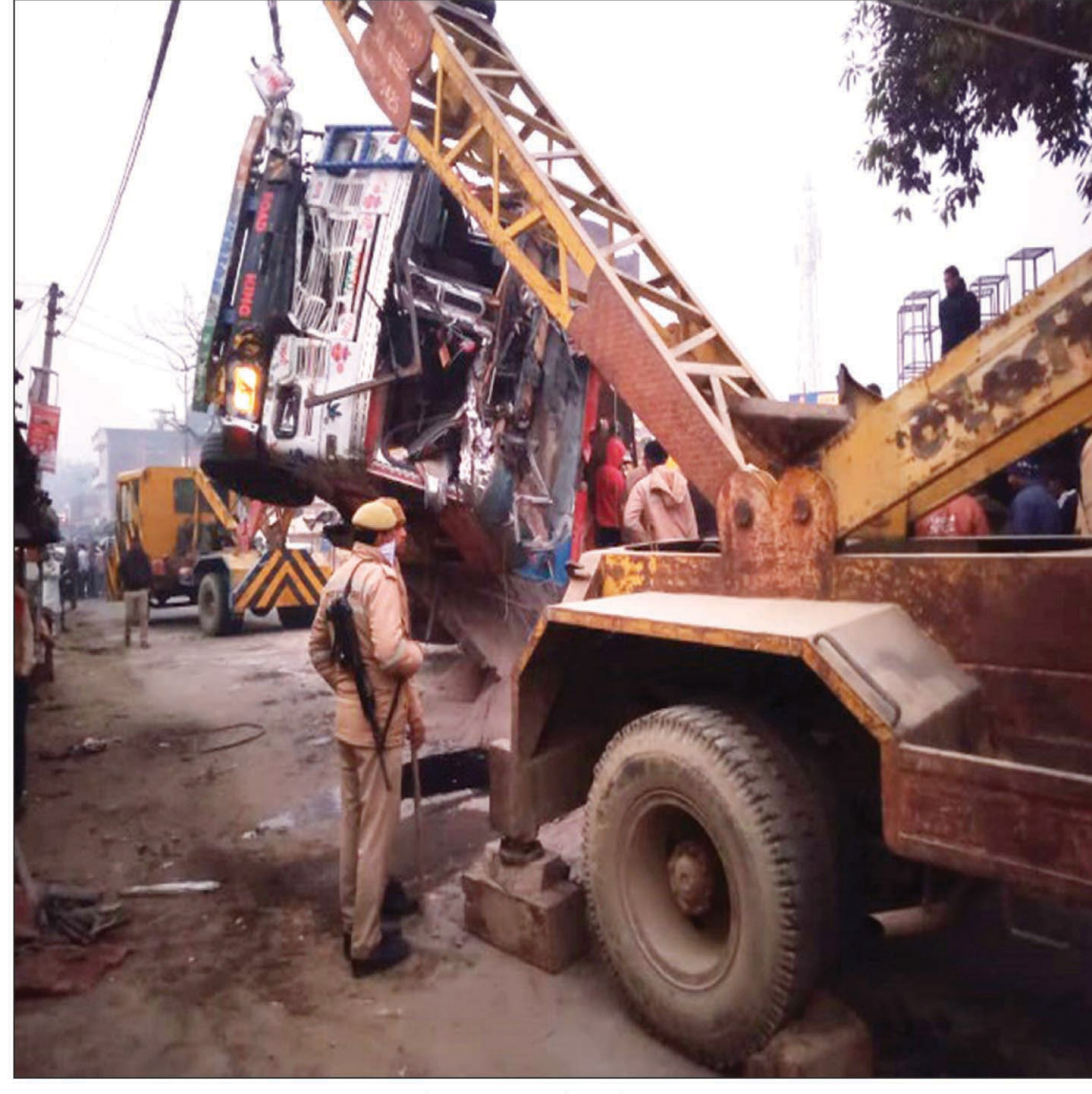
क्रेन द्वारा ट्रक को हटाते हुए