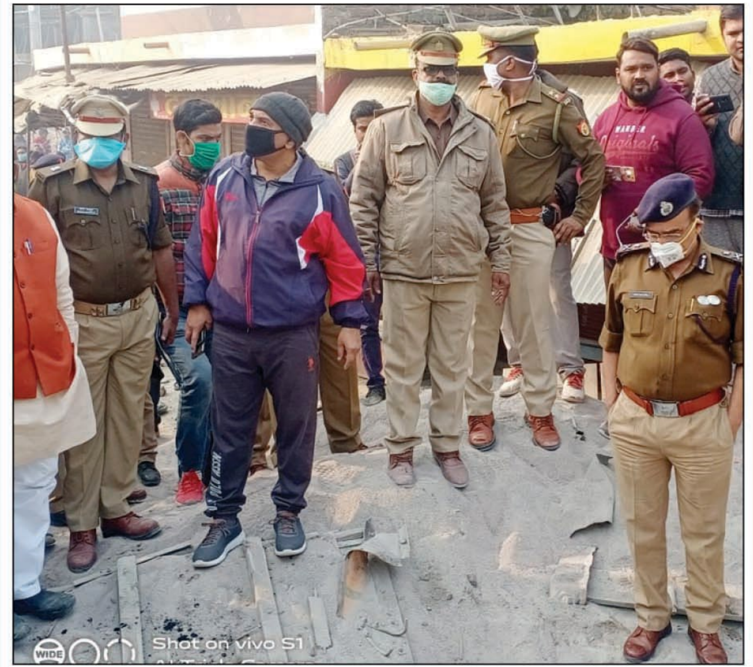
घटनास्थल पर पहुंच जायजा लेते एडीजी व डीआईजी

कौशांबी। कड़ा धाम कोतवाली क्षेत्र के देवीगंज चौराहे के पास ओवरलोड बालू लदे ट्रक के अनियंत्रित होने के बाद चालक के ट्रक से कूद जाने से बारातियों से भरी स्कार्पियो पर ट्रक पलट जाने के बाद 8 लोगों की मौत की