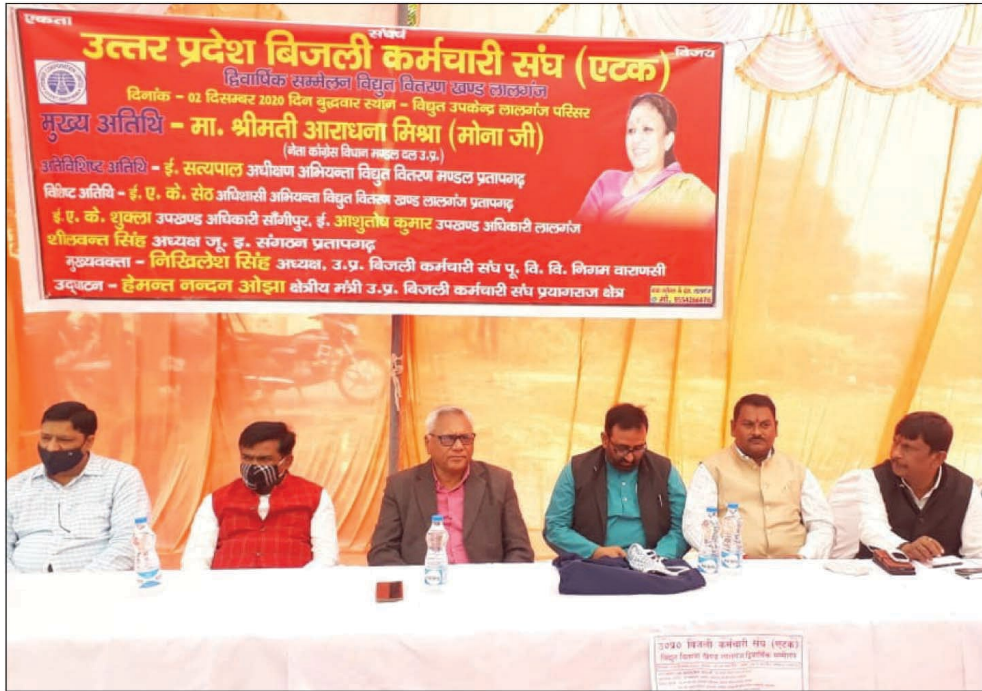
बिजली कर्मचारी संघ के सम्मेलन में परिचर्चा में शामिल हुए अतिथि व बिजली कर्मचारी संघ के सम्मेलन में प्रतिभाग करते विद्युत कर्म

प्रतापगढ़। नगर के एसडीओ विद्युत कार्यालय परिसर में बुधवार को उत्तरप्रदेश बिजली कर्मचारी संघ का द्विवार्षिक सम्मलेन संपन्न हुआ। सम्मेलन में संविदा तथा निविदा विद्युत कर्मियों के नियमतीकरण व पेंशन सुविधा एवं इपीएफ़ घोषाले की जांच व विद्युत निगमों के निजीकरण के