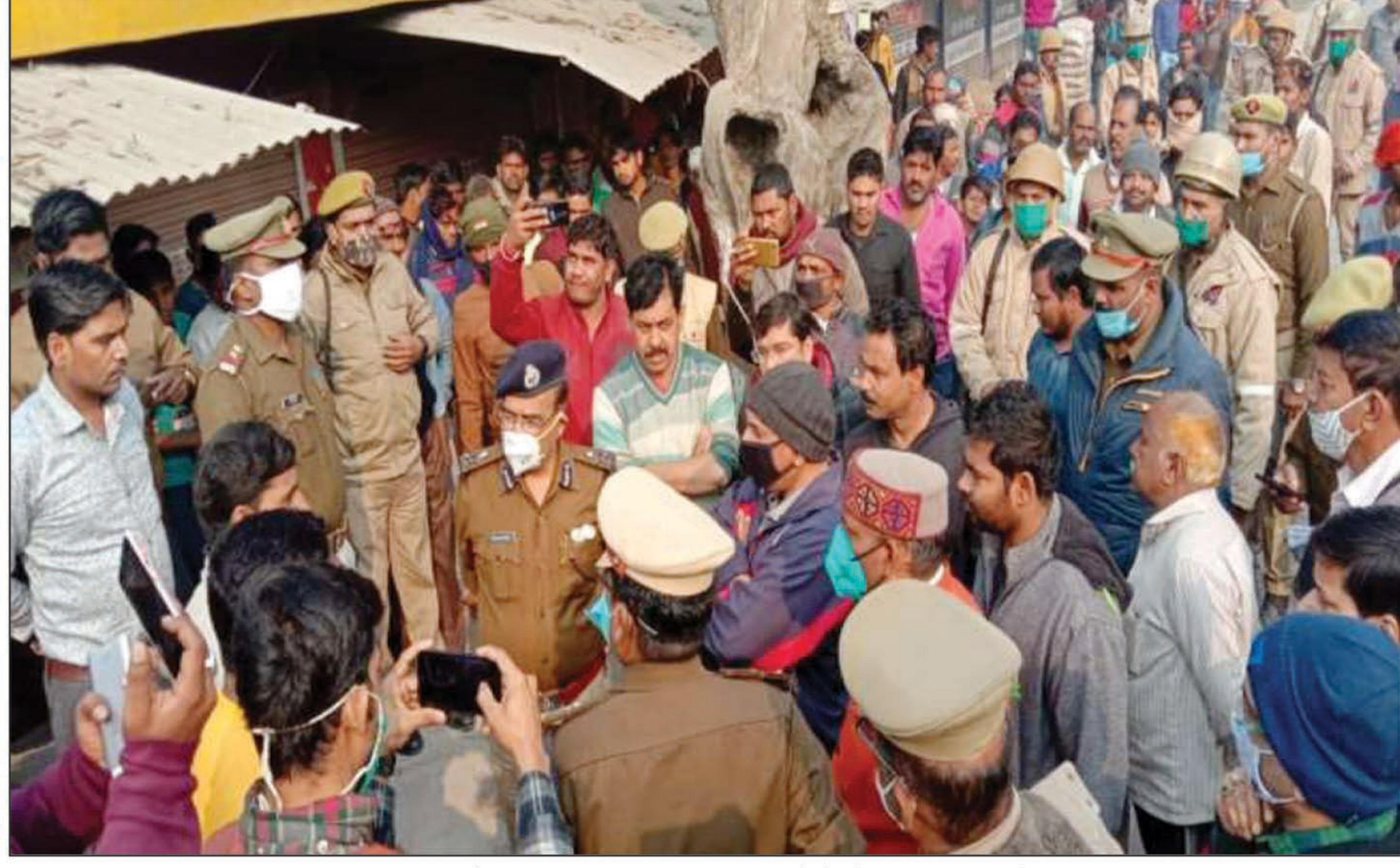
घटनास्थल पर मौजूद प्रशासनिक अधिकारी लोगों से पूछताछ करते हुए