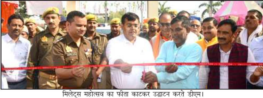
मिलेट्स महोत्सव का फीता काटकर उद्घाटन करते डीएम।

मिलेट्स महोत्सव/मेला में मिलेट्स पर आधारित स्वादिष्ट व्यंजनों एवं विभिन्न विभागों की