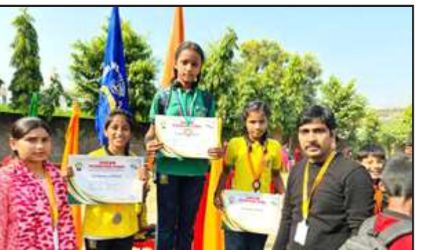
प्रमाण पत्र के साथ विजेता खिलाड़ीगण।

के खिलाफ घर में चोरी करने की घटना का लेकर तहरीर दी है। कोतवाल अवन दीक्षित का कहना है कि चोरी की घटनाओं को लेकर पुलिस छानबीन में जुटी है, जांच के बाद उचित कार्रवाई की जाएगी। उधर लीलापुर थानान्तर्गत शाहीपुर कटवड़ गांव में हुई। गांव