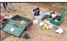
लालगंज के जटहा पुरेन्दन गांव में चोरी के बाद बिखरा सामान।

लालगंज कोतवाली अन्तर्गत रानीगंज कैथौला पुलिस चौकी क्षेत्र के अगई स्थित पौराणिक धाम दुर्गन भवानी में लगे पीतल के आधा दर्जन घण्टे चोर उड़ा ले गये। इस दौरान चोरों द्वारा चोरी की घटना को अंजाम देने का सीसी फुटेज मंदिर में लगे कैमरे में कैद हो गया।