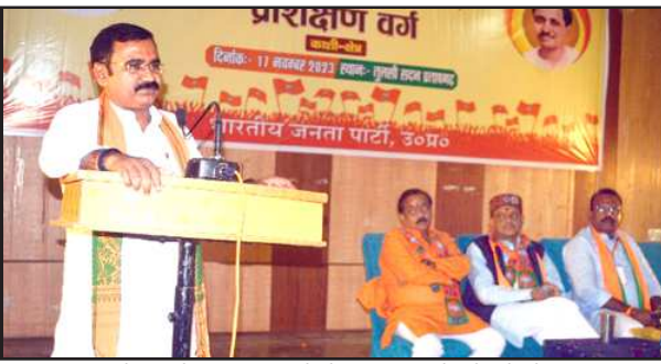
तुलसी सदन में आयोजित सभासदों के प्रशिक्षण में बोलते क्षेत्रीय अध्यक्ष।