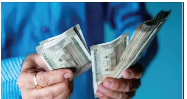
आदेश के अनुसार बढ़ा हुआ डीए 1 जुलाई से लागू होगा। लेकिन, जुलाई से सितंबर तक का एरियर

जयपुर राज्य सरकार के वित्त विभाग ने मंगलवार को कर्मचारियों के डीए बढ़ोतरी के आदेश जारी कर दिए। इसमें कर्मचारियों का डीए 42 से बढ़ाकर 46 प्रतिशत कर दिया गया है। आचार संहिता लगी होने के कारण प्रदेश सरकार ने डीए बढ़ोतरी का प्रस्ताव तैयार कर निर्वाचन आयोग को भेजा था। आयोग की मंजूरी मिलने के बाद मंगलवार को डीए बढ़ोतरी के आदेश जारी किए गए हैं। इस महीने से होगा लागू