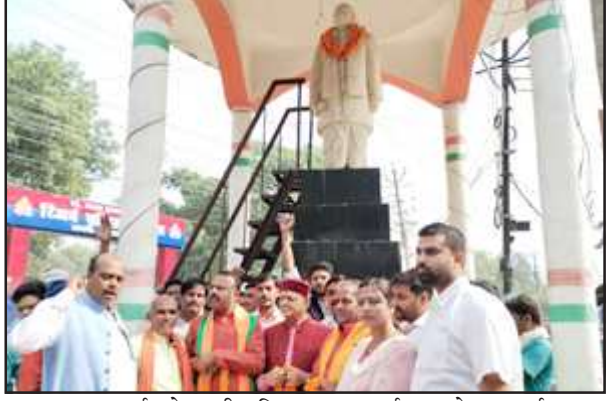
वल्लभभाई पटेल की प्रतिमा पर माल्यार्पण करते भाजपाईय।

भाजपाईयों ने मनाई सरदार वल्लभभाई पटेल की जयंती