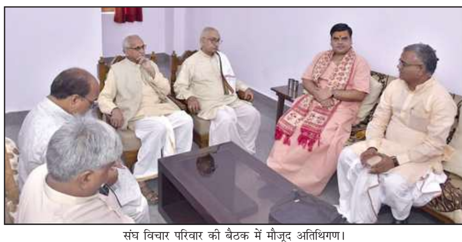
संघ विचार परिवार की बैठक में मौजूद अतिथिगण।