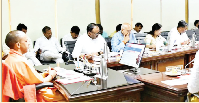
इंटरनेशनल विश्वविद्यालय को मान्यता प्रदान की गयी है। प्रदेश में तीन नए राज्य विश्वविद्यालय की स्थापना को मंजूरी दी गयी है। देवी पाटन मंडल, विन्ध्याचल मंडल, मुरादाबाद मंडल में एक-एक विश्वविद्यालय की स्थापना होगी। पीएम उज्ज्वला योजना: लाभार्थियों को मिलेगी निशुल्क सिलेंडर

थाना शाहगंज, गोरखपुर के कैम्पिंगरज में अग्निशमन केंद्र, जनपद मथुरा के वृन्दावन में नवीन थाना, लखनऊ गोमती नगर विस्तार के सेक्टर 04 में मॉडर्न थाना हेतु नवीन मॉडल बनाने को मंजूरी दी गयी है। कैबिनेट से प्राइवेट सुरक्षा अधिकरण नियामक बोर्ड को भी मंजूरी मिली है। योगी कैबिनेट ने जनपद रामपुर में मुर्तजा उच्चतर माध्यमिक विद्यालय में आवंटित भवन भूमि को मौलाना मो जौहर ट्रस्ट को वापस किये जाने के संबंध में प्रस्ताव को अनुमोदन दिया है। इस भूमि को सरकार द्वारा वापस ली जाएगी। भवन भूमि का स्वामित्व राज्य सरकार माध्यमिक शिक्षा विभाग में निहित किये जाने का अनुमोदन हुआ है। वहीं मथुरा में निजी क्षेत्र के एस के एस