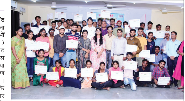
प्रशिक्षण समाप्त होने पर गंगा दूतों को प्रमाण पत्र देकर किया गया सम्मानित