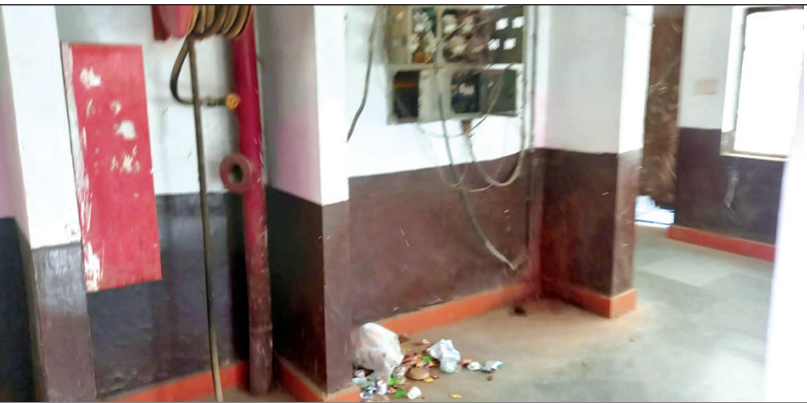
विकास भवन में बिखरा पड़ा कूड़ा

कौशाम्बी। स्वच्छता अभियान की सफलता को लेकर केंद्र और प्रदेश सरकार बार-बार निर्देश दे रही है आए दिन बड़े बड़े अधिकारी स्वच्छता अभियान को लेकर मीटिंग करके बड़े-बड़े निर्देश दे रहे हैं लेकिन सरकार का यह निर्देश हवा हवाई साबित हो रहा है जो गांव गांव गंदगी की क्या स्थिति होगी इसका सहज अंदाजा लगाया जा सकता है विकास भवन में दर्जनों विभाग के ऑफिस संचालित हो रहे हैं मुख्य विकास अधिकारी जिला विकास अधिकारी सहित विभिन्न बड़े अधिकारियों का कार्यालय भी इसी भवन से संचालित हो रहा है लेकिन उसके बाद भी विकास भवन की साफ सफाई में घोर लापरवाही बरती जा रही है बीते कई महीनों से विकास भवन के भीतर और उसके बाहर गंदगी को साफ कराने के प्रति जिम्मेदार अधिकारी गंभीर नहीं हैं हालांकि विकास भवन की देखरेख की जिम्मेदारी जिला विकास अधिकारी की है लेकिन उनकी भी व्यवस्था पर कुछ कहने को बचा नहीं है जिसका नतीजा यह है कि विकास भवन गंदगी से जूझ रहा है जगह-जगह कूड़े