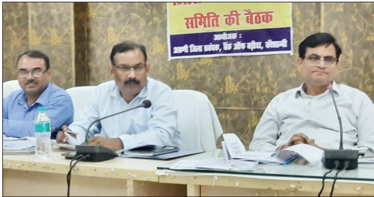
उपस्थित लोगों को संबोधित करते मुख्य विकास अधिकारी