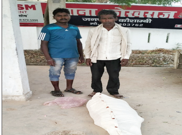
अधेड़ की लाश के साथ खड़े परिजन

बढ़ाए जाने से जहां परिवहन विभाग को आमदनी में तेजी से इजाफा होगा वही आम जनता को यातायात में सहूलियत होगी रोडवेज का व्यवसाय भी तेजी से बढ़ेगा लेकिन रोडवेज के अधिकारी अभी तक बस संख्या बढ़ाने में गंभीर नहीं हुए हैं क्षेत्र के लोगों ने योगी सरकार का ध्यान आकृष्ट कराते हुए रोडवेज बस की संख्या बढ़ाए जाने की मांग की है।