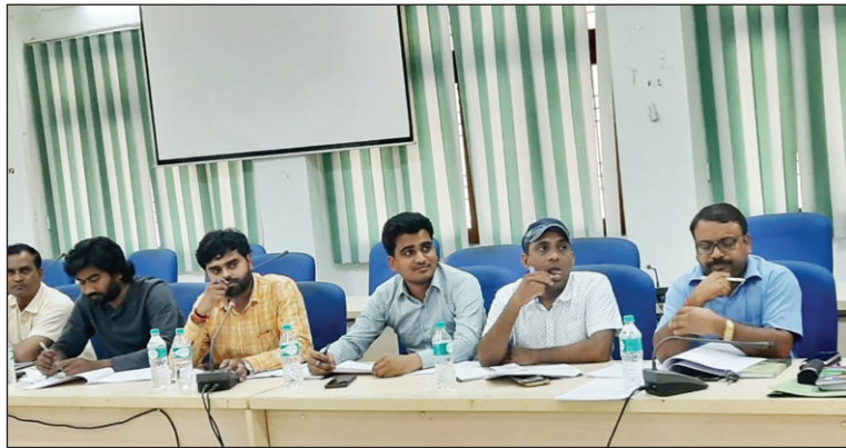
बैठक में उपस्थित विभिन्न विभाग के अधिकारी