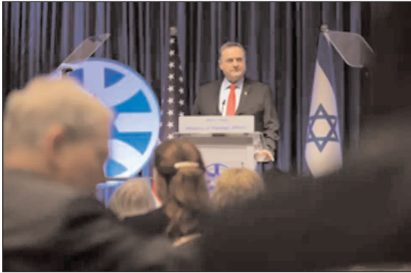
कैटज ने एक प्रेस बयान में कहा, "मैंने फिलिस्तीनी प्राधिकरण के संबंध में इजराइल में नॉर्वे के

यरूशलेम। इजराइल के विदेश मंत्री इजराइल कैटज ने गुरुवार को घोषणा की कि पिछले साल अक्टूबर में गाजा युद्ध शुरू होने के बाद से ओरस्तो के "इजराइल विरोधी व्यवहार" के कारण फिलिस्तीनी प्राधिकरण (पीए) में नॉर्वे के दूतों की राजनयिक स्थिति रद्द की जाती है। समाचार एजेंसी शिन्हुआ की रिपोर्ट के अनुसार, तेल अवीव में नॉर्वे के दूतावास को भेजे गए एक पत्र में, कैटज ने कहा कि पीए में नॉर्वे के आठ प्रतिनिधियों की राजनयिक स्थिति सात दिनों के भीतर रद्द कर दी जाएगी।