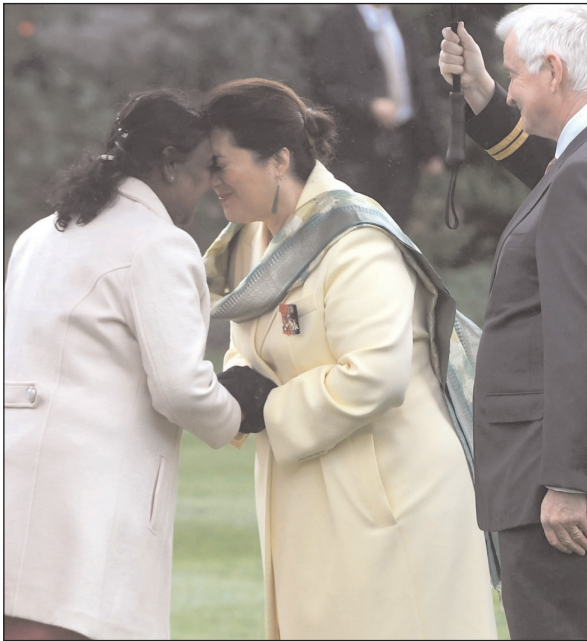
हजार भारतीय विद्यार्थी न्यूजीलैंड के विभिन्न संस्थानों में गुणवत्तापूर्ण

वेलिंगटन। भारत की राष्ट्रपति द्रौपदी मुर्मू तीन देशों की राजकीय यात्रा का पहला चरण फिजी में पूरा कर न्यूजीलैंड पहुंची हैं। उन्होंने यहां अंतरराष्ट्रीय शिक्षा सम्मेलन पूरी दुनिया को संदेश दिया। राष्ट्रपति ने कहा, "शिक्षा हमेशा मेरे दिल के करीब रही है। मैंने शिक्षा की परिवर्तनकारी शक्ति का प्रत्यक्ष अनुभव किया है। 21वीं सदी के भारत में शिक्षा प्रणाली की महत्वपूर्ण भूमिका है। शिक्षा ने विभिन्न क्षेत्रों को ऐसे नेता दिए हैं जो न केवल भारत, बल्कि दुनिया भर में योगदान दे रहे हैं।" उन्होंने कहा, "आज भारत में युवाओं की बड़ी संख्या है। उन्हें गुणवत्तापूर्ण शिक्षा का महत्व मालूम है। भारतीय माता-पिता भी अपने बच्चों को सर्वोत्तम शिक्षा दिलाने की आकांक्षा रखते हैं। यह वास्तव में स्वागत योग्य है। आज आठ