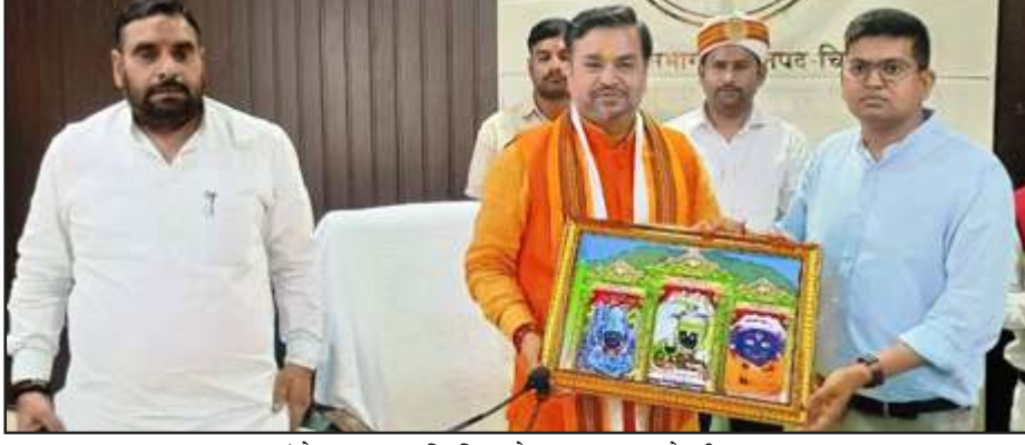
संयोजक का स्मृति चिह्न देकर स्वागत करते डीएम।

गुरुवार को कलेक्ट्रेट सभागार में हुई बैठक में संयोजक व समिति