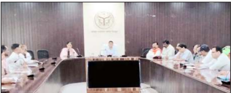
कर-करेतर की बैठक में बोले डीएम।

गुरुवार को कलेक्ट्रेट सभागार में बैठक की अध्यक्षता करते हुए डीएम ने आबकारी विभाग को