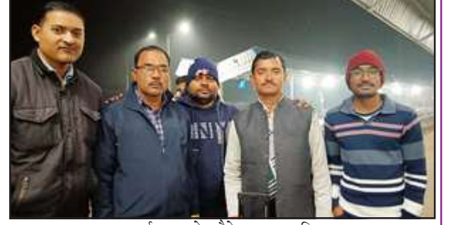
कार्यशाला से लौटते प्रधान आदि।

ये कार्यशाला 27 से 30 दिसम्बर तक चली है। कार्यशाला में देश के सभी आकांक्षी जिलों से दो-दो प्रधान बुलाये गये थे। कार्यशाला में गांव के विकास को योजना विकसित की गई। प्रधानों को गांव के विकास योजना को एक्सपर्ट प्रशिक्षकों ने बेहतर जीपीडीपी बनाने को प्रेरित किया। कार्यशाला में विभिन्न गतिविधियां कराई गईं, जो उनकी समझ को और विकसित करने में सहयोग दे रही हैं।