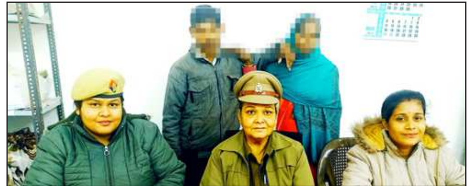
सुलह कराती पुलिस टीम।