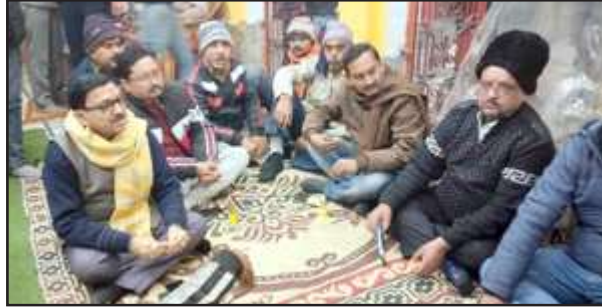
हनुमान मंदिर की बैठक में मौजूद मंदिर समिति के पदाधिकारी।

प्रतापगढ़। हनुमान मंदिर पर हनुमान भक्तों की एक बैठक हनुमान जी महाराज की अध्यक्षता में संपन्न हुई। बैठक में मुख्य रूप से सभी भक्तों ने 22 जनवरी को मयादां पुरुषोत्तम भगवान श्रीराम के मंदिर व प्राण प्रतिष्ठा के दिन विभिन्न कार्यक्रम आयोजित करने की रूपरेखा बनी। 21 जनवरी को राम कीर्तन का शुरुआत किया जाएगा जो 24 घंटे तक चलेगा। 22 जनवरी को 12 बजे पूणाहृति होगी। मंदिर परिसर को फूल मालाओं एवं विद्युत झालरों से सजाया जाएगा। मंदिर परिसर में भक्तों के लिए एलइडी बॉल, एलइडी टीवी लगाई जाएगी। शाम पांच बजे 5100 दीप जलाकर दीपोत्सव