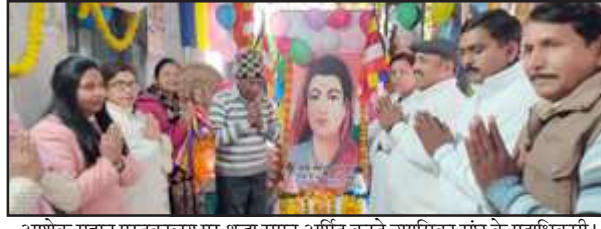
अशोक महान पुस्तकालय पर श्रद्धा सुमन अर्पित करते उपासिका संघ के पदाधिकारी।