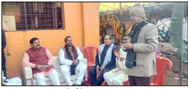
श्रद्धांजलि कार्यक्रम में बैठे सांसद, विधायक व जनप्रतिनिधि।