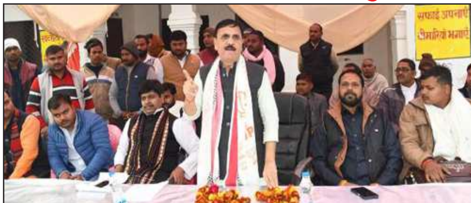
कार्यक्रम में बोलते सांसद विनोद सोनकर।

उक्त बातें बुधवार को क्षेत्र के मऊदारा में विकसित भारत संकल्प यात्रा मोदी की गारण्टी गाड़ी चैपाल कार्यक्रम में बतौर मुख्य अतिथि सांसद कौशाम्बी, संसदीय आचार समिति लोकसभा के सभापति, दादरा नगर हवेली एवं दमन दीव के प्रभारी विनोद सोनकर ने उपस्थित जन