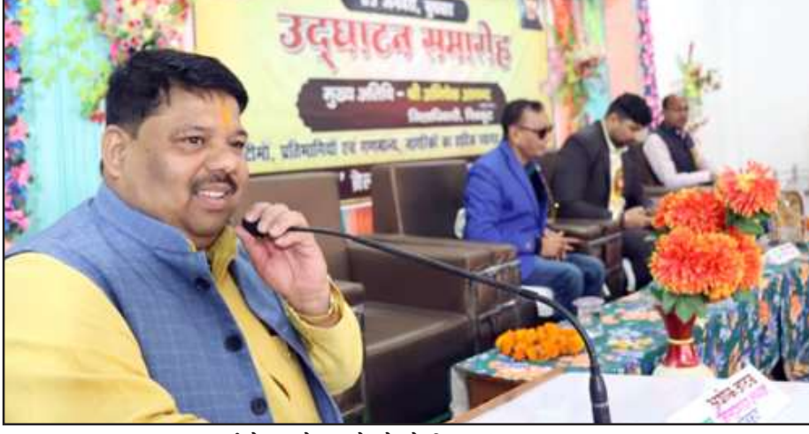
लुई ब्रेल महोत्सव में बोलेते जिला पंचायत अध्यक्ष।