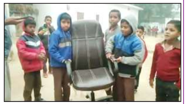
कुर्सी ढोने में लगे नौनिहाल।

विकसित भारत संकल्प यात्रा के नाम पर भाजपाई इन दिनों जोर-शोर से गांव-गली को खाक छान रहे हैं। अधिकारी व कर्मचारी को भी शामिल किये हैं। प्रधान- सचिवों समेत सहायक विकास अधिकारियों व बीडीओ को भी विकसित भारत संकल्प यात्रा करा रहे हैं। इस यात्रा में भीड़ जुटाने को प्रधानों को खासी