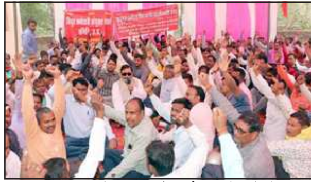
चिलबिला कार्यालय पर प्रदर्शन करते बिजली कर्मचारी।

चले जाने से पूरे जिले की आपूर्ति चरमरा गई। विद्युत विभाग के अधीक्षण अभियंता ने कमान संभाली और प्राइवेट लाइनमैनों के सहारे शहर में सुबह से परेधान नागरिकों को सुबह नौ बजे बिजली मिल गयी, तब लोगों ने पानी भरा और लोगों की नित्य क्रिया शुरू हुई।