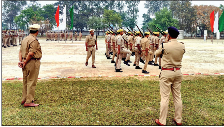
परेड का निरीक्षण करते आईजी

डीसीआरबी आंकिक शाखा, अभियोजन शाखा, अपराध शाखा, विशेष जांच प्रकोष्ठ, फील्ड यूनिट, महिला सहायता प्रकोष्ठ, डीसीआरबी, स्थानीय अभिसूचना इकाई