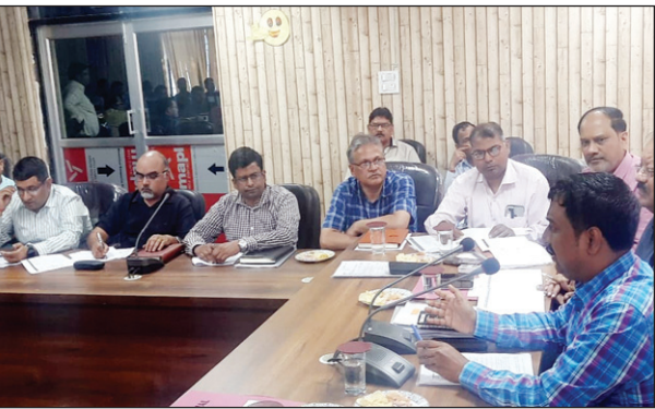
बैठक को संबोधित करते जिलाधिकारी

कौशाम्बी। जिलाधिकारी सुजीत कुमार द्वारा सम्बन्धित अधिकारियों के साथ मुख्य चिकित्साधिकारी सभागार में जिला स्वास्थ्य समिति की समीक्षा बैठक की गई बैठक में जिलाधिकारी ने सीएमएस एवं सभी प्रभारी चिकित्साधिकारियों से कहा कि यदि किसी मरीज की दुर्भाग्यवश मृत्यु हो जाती है तो उसके परिजनों को शव वाहन तत्काल उपलब्ध कराया जाय किसी भी स्तर पर लापरवाही न बरती जाय। उन्होंने परिवार कल्याण कार्यक्रमों की समीक्षा के दौरान सभी प्रभारी चिकित्साधिकारियों समुदायिक स्वास्थ्य केन्द्र को प्रगति लाने के निर्देश दिए। उन्होंने जननी सुरक्षा योजना के तहत संस्थागत प्रसव की समीक्षा के दौरान अंशेति प्रगति न पाये जाने पर नाराजगी प्रकट करते हुए सभी प्रभारी चिकित्साधिकारियों को आशाओं के प्रगति सुनिश्चित करने के निर्देश