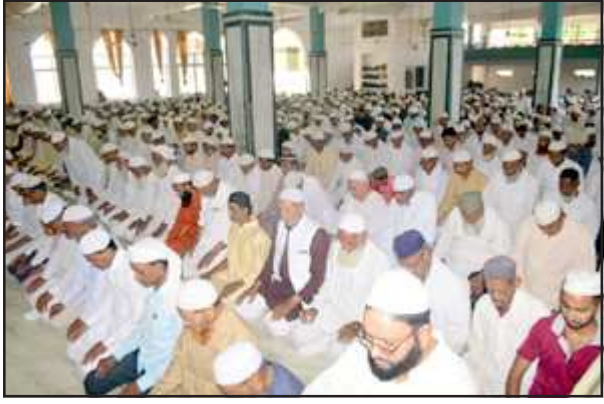
जामा मस्जिद में जुमा के नमाज अदा करते रोजेदार।

यू तो हर मुसलमान अमूमन जुमे की नमाज अता करने में कोई कोताही नहीं करता लेकिन जो कुछ लोग किसी मजबूरी के तहत जुमे की नमाज अता नहीं कर पाते वे रमजान के मुबारक महीने में पड़ने वाले जुमे की नमाज को जाया नहीं जाने देते। अजान के बाद हर मुसलमान मस्जिद में दाखिल होने के बाद सुन्नत पढ़ता है उसके बाद पेशावर मखतब पढ़ते हैं और फिर फर्ज नमाज पढ़ी जाती है। नगर