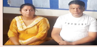
मुख्यमंत्री चौहान ने शुकवार को मीडिया से बातचीत करते हुए कहा कि राज्य सरकार इस

भोपाल: हिंसाग्रस्त देश सूडान की राजधानी खार्तूम में हजारों भारतीयों फंसे हुए हैं। इनमें मध्य प्रदेश की राजधानी भोपाल का भी एक युवक है। म्प के मुख्यमंत्री शिवराज सिंह चौहान ने आज कहा कि सूडान की असामान्य परिस्थितियों में फंसे इस युवक को सुरक्षित बाहर निकालने के प्रयास किए जा रहे हैं।