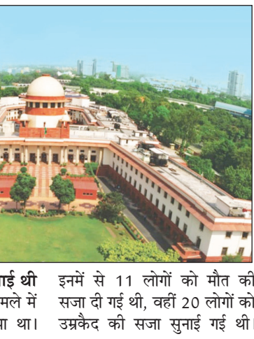
दयाल कोर्ट ने 31 को सुनाई थी सजा: ट्रायल कोर्ट ने इस मामले में 31 लोगों को दोषी ठहराया था।

नई दिल्ली: सुप्रीम कोर्ट ने 2002 के गोधरा में साबरमती एक्सप्रेस की बोगी जलाने के 8 दोषियों को शुकवार को जमानत दे दी। ये दोषी उभ्रकैद की सजा काट रहे थे, कोर्ट ने जेल में बिताए गए 17-18 साल के समय और अपराध में उनकी भूमिका को ध्यान में रखते हुए जमानत दी। वहीं, अन्य 4 दोषियों को जमानत देने से इनकार कर दिया। इसी मामले में सोमवार को सुप्रीम कोर्ट ने उन 11 दोषियों की जमानत अर्जियां खारिज कर दी थीं, जिन्हें ट्रायल कोर्ट ने मौत की सजा सुनाई थी। इनमें से 11 लोगों को मौत की सजा दी गई थी, वहीं 20 लोगों को उभ्रकैद की सजा सुनाई गई थी।