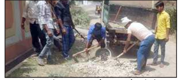
ईदगाह की बदहाल सड़क को दुरुस्त करते कर्मचारी।