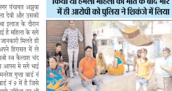
महिला की मौत के बाद घर पर मौजूद रिश्तेदार