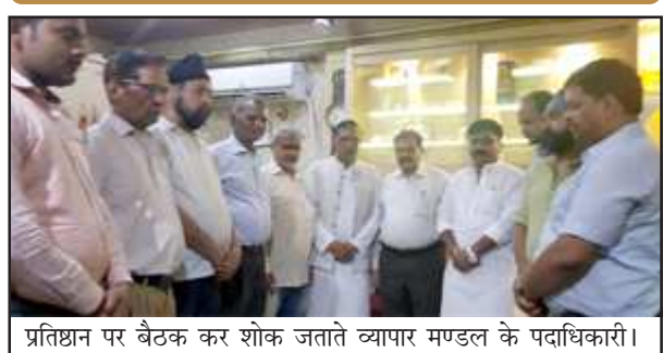
प्रतिष्ठान पर बैठक कर शोक जताते व्यापार मण्डल के पदाधिकारी।

पुत्र नन्हें फल वाले के बच्चों का लखनऊ जाते समय एक्सीडेंट हो जाने पर दर्दनाक हादसे में मृत्यु बंधाया। लगभग चार दिनों पूर्व सीधे, सरल व मितव्ययी जुनियर बार एसोसिएशन (पुरातन) के पूर्व