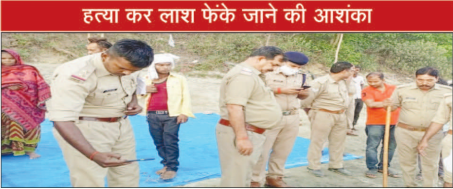
हत्या कर लाश फेंके जाने की आशंका

अज्ञात लाश की जानकारी पर घटनास्थल पहुंची पुलिस