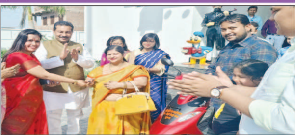
विजेता मम्मी को सम्मानित करते स्कूल की प्रिंसिपल

कौशाम्बी भरवारी। स्थित किड्जी स्कूल में आज ग्रेजुएशन डे प्रोग्राम मनाया गया जिसमें किड्जी के छोटे-छोटे प्यारे बच्चों ने अपनी प्रतिभा का प्रदर्शन किया बच्चों ने कार्यक्रम के दौरान भारतीय संस्कृतियों का मेल, आधुनिक संस्कृति से होने वाली हानियां, अधिक पढ़ाई पर जोर देना, खेल कूद का महत्व, माता पिता का बच्चों के लिए समय देना आदि नुस्खे मंचन के माध्यम से समाज को संदेश देने का काम किया और यह संदेश दिया कि कभी भी बच्चों के ऊपर भरपूर पढ़ाई का जोर नहीं देना चाहिए पढ़ाई के साथ साथ सामाजिक सांस्कृतिक बंधुओं को भी बच्चों को बताना चाहिए और यह भी संदेश दिया कि बच्चों को पढ़ाई की कोन सी स्ट्रीम बेचनी है बच्चों के व्यक्तिगत इंटेरेस्ट के आधार पर उन्हें उस लाइन पर ले जाना चाहिए। ग्रेजुएशन डे के मौके पर बच्चों की मॉमियों के बीच