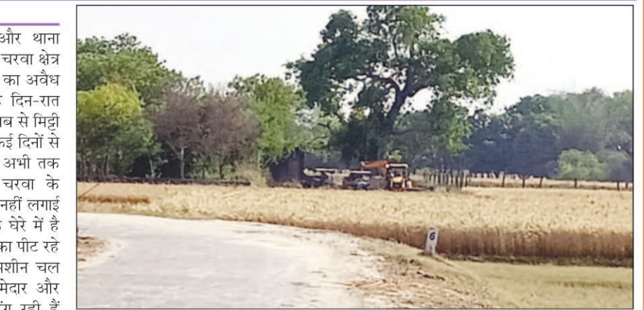
तालाब से मिट्टी खनन करता जेसीबी मशीन

कौशाम्बी। नगर पंचायत चरवा और थाना पुलिस की साठगांठ से नगर पंचायत चरवा क्षेत्र के मोरन पर सरकारी तालाब से मिट्टी का अवैध खनन बेखोफ तरीके से हो रहा है दिन-रात जेसीबी मशीन लगाकर सरकारी तालाब से मिट्टी खनन कर बेचने में माफिया लगे हैं कई दिनों से मिट्टी के अवैध खनन के मामले में अभी तक थाना पुलिस और नगर पंचायत चरवा के जिम्मेदारों ने तालाब खुदाई पर रोक नहीं लगाई है जिससे उनकी भूमिका सवालियों के घेरे में है खनन माफिया इस समय जोरो पर डंका पीट रहे हैं चारो तरफ धडल्ले से जेसीबी मशीन चल रही हैं नगर पंचायत चरवा के जिम्मेदार और पुलिस के कान में जु तक नहीं रेंग रही हैं आखिर किसके इसारे पर खनन माफिया बेखोफ तरीके से सरकारी तालाब की मिट्टी का खनन कर रहे हैं अगर सूत्रों के माने तो खनन माफिया कहते हैं कि हमारी मारी सेंटिंग रहनी है अगर कोई किसी अधिकारी से भी शिकायत कोई करता है तो हमें जिम्मेदार विभाग के