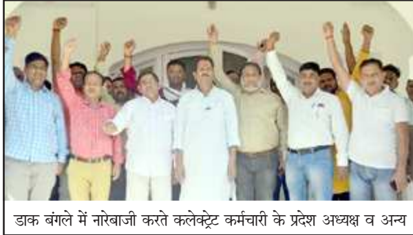
डाक बंगले में नारेबाजी करते कलेक्ट्रेट कर्मचारी के प्रदेश अध्यक्ष व अन्य