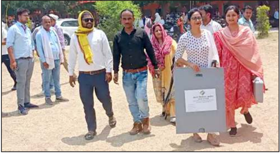
बूथों में रवाना होती पोलिंग पार्टी।