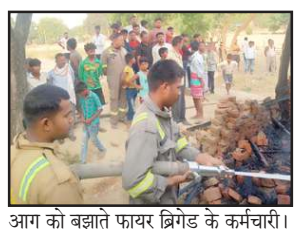
आग को बुझाते फायर ब्रिगेड के कर्मचारी।