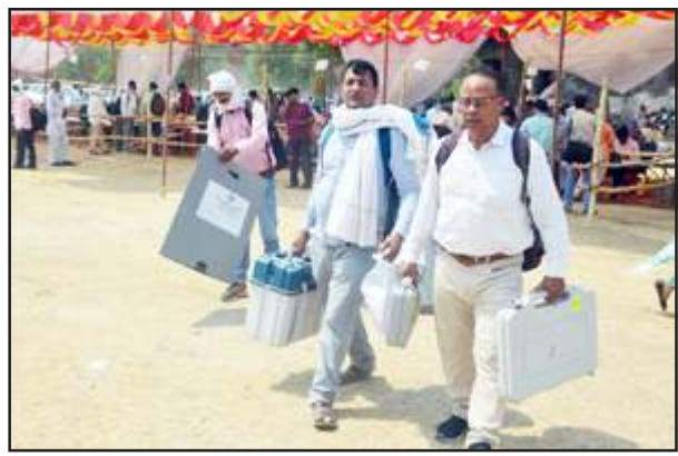
एटीएल ग्राउण्ड से बस्ता लेकर जाती पोलिंग पार्टियां।

बता दें कि कौशाम्बी संसदीय क्षेत्र में कौशाम्बी की तीन विधान सभा क्षेत्र तथा प्रतापगढ़ की दो विधान सभा क्षेत्र कुण्डा व बाबागंज शामिल हैं। कुण्डा में 373 बूथों पर 327407 मतदाता और बाबागंज विधान सभा क्षेत्र में 346 बूथों पर 365942 मतदाता के वोट देने की व्यवस्था पूरी कर ली गई है। संवेदनशील बूथों पर विशेष सुरक्षा