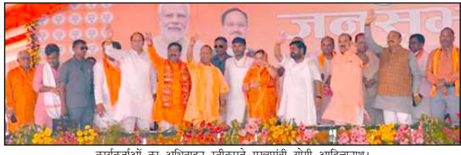
कार्यकर्ताओं का अभिवादन स्वीकारते मुख्यमंत्री योगी आदित्यनाथ।

रामपुर खास के नयापुरवा में योगी को सुनने उमड़ी भीड़, राम नाम सत्य की यात्रा में चले गए हिंदू पर्व के दंगाई