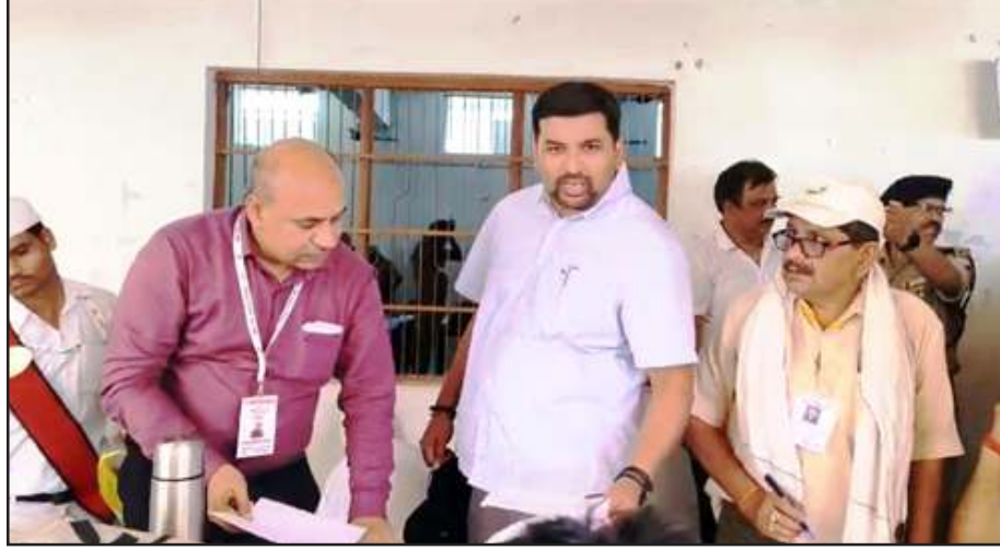
पोलिंग पार्टियों को निर्देश देते डीएम।