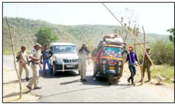
मप्र सीमा देवांगना घाटी पर लगा बैरियर।