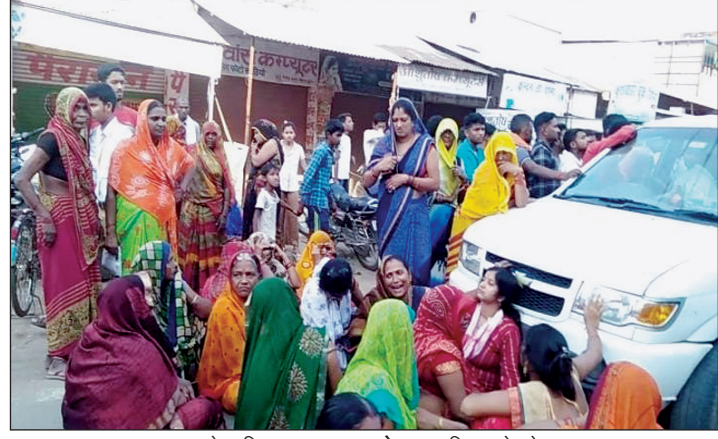
मृतक के परिजन लाश वाहन रोक कर विलाप करते हुए

सुन कर हर कोई घटना स्थल पर पहुंचा और हत्याकांड की निंदा की। पुलिस ने हत्या कांड में सलिप हत्यारों की गिरफ्तारी के लिए निरंतर दबिस दे रही है। घटना का खुलासा लगभग होने के कगार पर आ पहुंचा है। फिलहाल घटना में जिन और युवकों