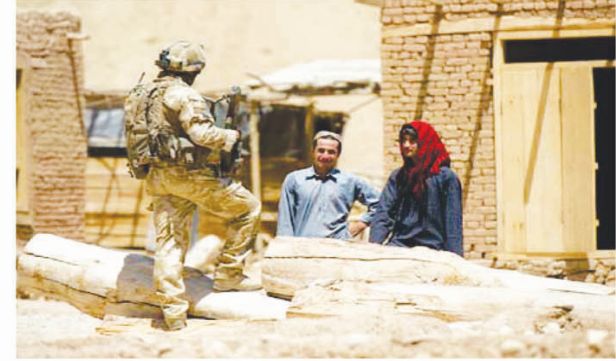
“आतंकवादी” समूह नामित किया गया था। विद्रोही समूह की ओर से इस संबंध में अब तक कोई जानकारी नहीं दी गयी है।

कीव। पाकिस्तानी सुरक्षाबलों ने देश के अशांत दक्षिण-पश्चिम में चार विद्रोहियों को उनके ठिकाने पर छापेमारी के दौरान मार गिराया। अधिकारियों ने यह जानकारी दी। पाकिस्तान के आतंकवाद निरोधक विभाग की ओर से जारी एक बयान के अनुसार, यह छापेमारी बलूचिस्तान प्रांत की राजधानी क्वेटा से 350 किलोमीटर (210 मील) पश्चिम में खारन जिले में हुई। विभाग ने कहा कि मारे गए लोग गैरकानूनी बलूचिस्तान लिबरेशन आर्मी के सदस्य थे, जिसे 2019 में अमेरिका द्वारा