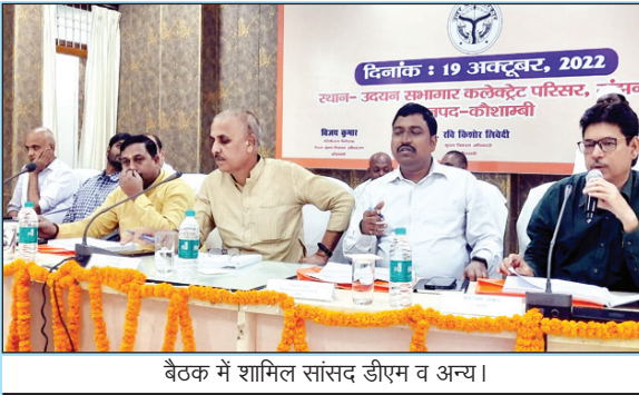
बैठक में शामिल सांसद डीएम व अन्य।

नहरों को और संचालित कराने विशेष अभियान चलाकर फागिंग एवं एण्टीलार्वा का छिड़काव कराने किसान की अनुमति के बिना प्रीमियम की किरत न काटें जाने ग्रामीण ज्योति योजना के कार्यों की जांच सहित विभिन्न निर्देश जारी