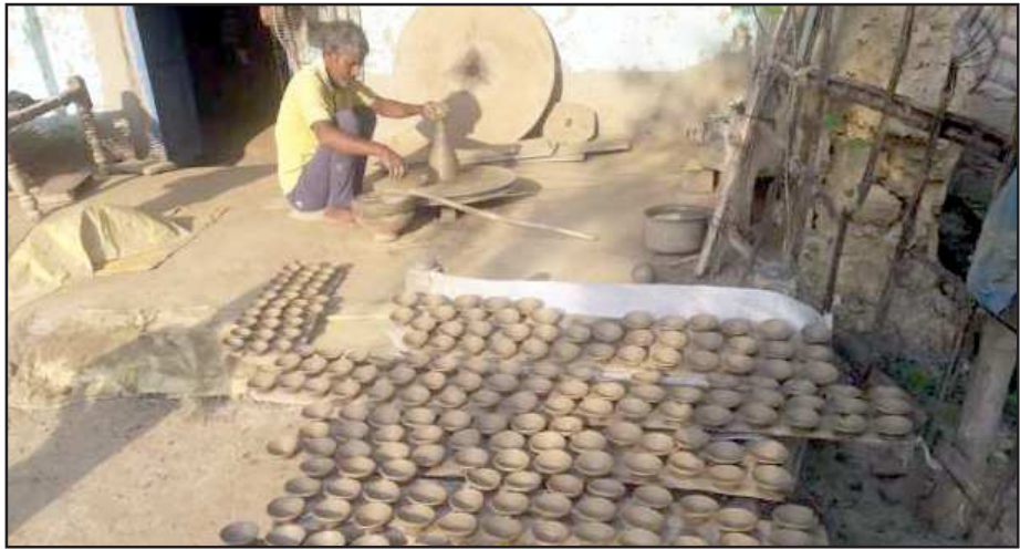
मिट्टी के दीये बनाता कुम्हार।

आधुनिकता के दौर में मिट्टी के बर्तनों के चलन पर लोगों ने ध्यान हटा कर विद्युत झालरों को