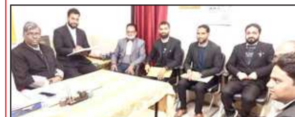
राष्ट्रीय लोक अदालत के बैठक में मौजूद अधिकारीगण।