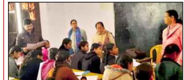
जीजीआईसी में परीक्षा देती छात्राएं।