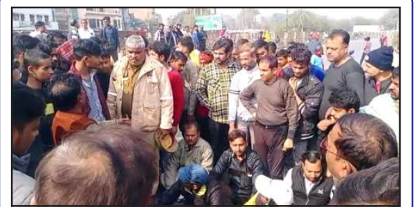
नए पुल मार्ग पर लोगों ने किया चक्काजाम सड़क चौड़ीकरण के विरोध में पुलिस प्रशासन के काफी प्रयास के बाद जाम को हटाया गया