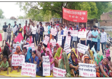
जनसभा में विरोध प्रदर्शन करते हुए

और छूटे हुए राशन कार्ड पंजीकृत करने, डीजल पेट्रोल के दाम आधा करने, बिजली के बड़े दाम वापस लेने, बिजली में प्रीपैड योजना रद्द करने, 300 यूनिट घरेलू बिजली मुफ्त करने, गांव में दिव जा रहे सरकारी रोजगार में न्यूनतम वेतन 25हजार रुपए करने, अग्निपथ योजना रद्द करने,