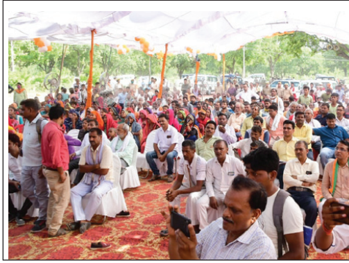
डिप्टी सीएम के कार्यक्रम में उपस्थित जनसमूह

किसानों को रोपाई के कार्य में दिक्कत न होने पाये, सिंचाई हेतु पर्याप्त पानी की उपलब्धता हेतु सभी समुचित उपाय सुनिश्चित किया जाय। उन्होंने कहा कि शीघ्र उपलब्ध कराया जाय, ताकि जनपद का सर्वांगीण विकास सुनिश्चित हो सके। उन्होंने जनपद में निर्माण कराये जा रहे कार्ययोजना एवं अमृत सरोवरों के निर्माण कार्य की प्रगति की भी विस्तृत समीक्षा की।