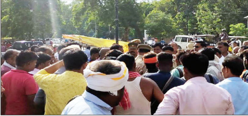
सिविल लाइंस बस स्टैंड पर लगी भीड़