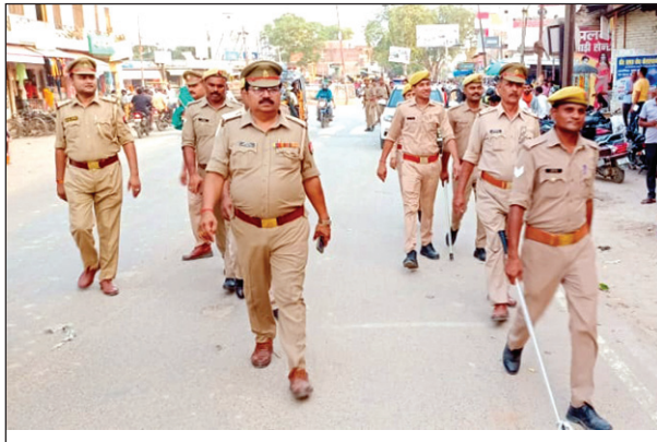
पैदल भ्रमण करती पुलिस टीम