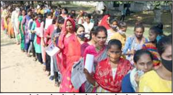
केपी कालेज में परीक्षा में प्रवेश करते परीक्षार्थी।

11700 परीक्षार्थियों में पहली बेला में 810 व दूसरी बेला में 805 रहे अनुपस्थित