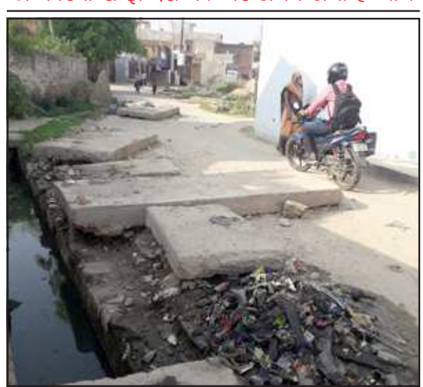
इस तरीके से मार्ग पर अवरोध करने से लोगों को हो रही असुविधा।

अव्यवस्था से इन्द्रा चैक पर लगने लगा है जाम