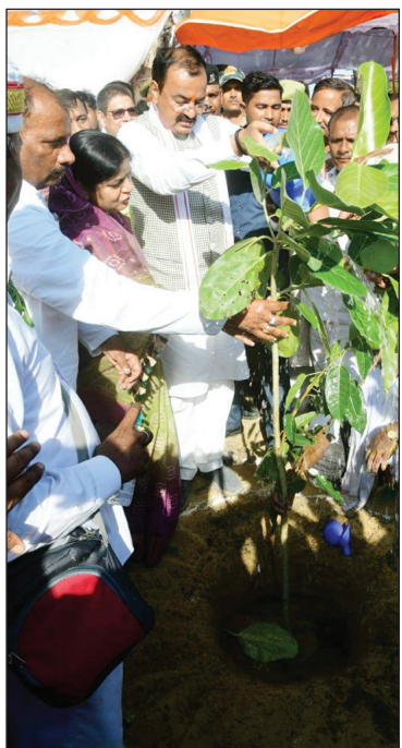
पौधा रोपण करते डिप्टी सीएम

कौशाम्बी। उप मुख्यमंत्री केशव प्रसाद मौर्य ने ग्राम सिपाह में पौधरोपण करने के पश्चात आयोजित वन महोत्सव कार्यक्रम में उपस्थित लोगों को सम्बोधित करते हुए कहा कि सरकार द्वारा पौधरोपण का अभियान चलाया जा रहा है। उन्होंने कहा कि प्रदेश में कल दिनांक 05 जुलाई 2022 को लगभग 25 करोड़ पौधरोपण किया गया है तथा 10 करोड़ और पौधरोपण किया जायेगा। उन्होंने सिपाह ग्रामवासियों को धन्यवाद देते हुए कहा कि आप लोगों ने पेड़ों को संरक्षित करने का कार्य किया है, जिसके फलस्वरूप गाँवों में काफी हरियाली दिखाई दे रही है। उन्होंने कहा कि वृक्ष हमें शुद्ध हवा, फल एवं हरियाली प्रदान करने के साथ ही पर्यावरण संतुलन के लिए बहुत ही आवश्यक हैं। पर्यावरण संतुलित रहेगा तो वर्षा भी पर्याप्त होगी। उन्होंने आमजन से पेड़ों को अपने सन्तान की तरह देख-भाल करने तथा बड़े पेड़ों को अपने माता-पिता की तरह सेवा करने का आग्रह किया उप मुख्यमंत्री ने कहा कि डबल इंजन की सरकार द्वारा बिना किसी भेदभाव के