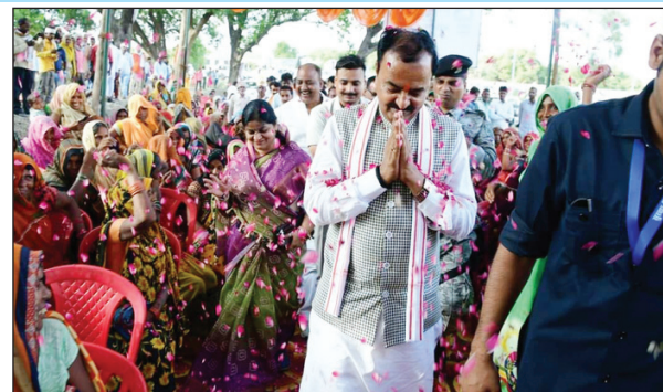
सरोवर निरीक्षण के दौरान महिलाओं से वार्ता करते डिप्टी सीएम

कौशाम्बी। उप मुख्यमंत्री ने ग्राम गनपा में अमृत सरोवर के निर्माण कार्य का स्थलीय निरीक्षण कर जायजा लिया तथा सम्बन्धित अधिकारियों को अमृत सरोवर का निर्माण कार्य उत्कृष्ट तरीके से कराने के निर्देश दिये। इस अवसर पर आयोजित कार्यक्रम में उपस्थित ग्रामवासियों विशेषकर महिलाओं से संवाद कर विभिन्न योजनाओं-स्वयं सहायता समूह के तहत बी0सी0सखी एवं मरनेगा मेठ, आवास, शौचालय, निःशुल्क राशन, उज्वला गैस कनेक्शन आदि से लाभान्वित होने की जानकारी प्राप्त किया। उन्होंने गाँव में विद्युत आपूर्ति की जानकारी प्राप्त करते हुए कहा कि आगामी समय में 24 घण्टे बिजली आपूर्ति