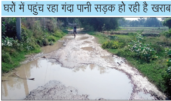
सड़क में भरा पानी और गड्ढे का दृश्य

हरियापुर कौशाम्बी। मूरतगंज ब्लाक के अंतर्गत आदमपुर नादिर अली में डेरवा के पास जल निगम की सप्लाई का पानी दो जगह लीकेज होने से पानी सड़कों पर बह रहा है सप्लाई बंद होने के बाद सड़क का गंदा पानी पाइप में खींच लेता है और जब दोबारा सप्लाई दी जाती है तो लोगों के घरों में गंदा पानी पहुँचता है जल निगम के पाइप लीकेज के चलते सड़के खराब हो रही हैं सड़क में जलभराव रहता है सड़क में जगह-जगह गड्ढे हो गए हैं लेकिन जिम्मेदार देखने वाले अंजान बने हुए हैं सड़के खराब होने से लोगों को आवागमन में भी दिक्कत होती है कई बार मामले की शिकायत ग्रामीणों ने अधिकारियों से की लेकिन 14 महीने बीत जाने के बाद भी सप्लाई का पानी सड़क पर बहना बंद नहीं हो सका है जिससे अधिकारियों के कार्य करने की क्षमता का अंदाजा लगाया जा सकता है। ग्राम प्रधान का भी गजब का कारनामा देखने को मिल रहा है जल