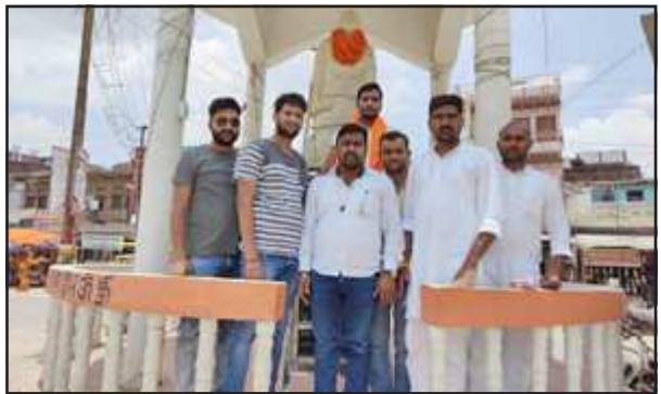
फोटो 4-डा0 श्यामा प्रसाद मुखर्जी की प्रतिमा पर माल्यार्पण करते भाजयुमो