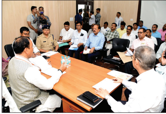
अधिकारियों के साथ बैठक करते डिप्टी सीएम

कौशाम्बी। उप मुख्यमंत्री केशव प्रसाद मौर्य ने आज मां शीतला देवी अतिथिगृह, सयारा परिसर में स्थापित महापुरूषो-चक्रवर्ती सम्राट अशोक, तथागत भगवान गौतम बुद्ध, बाबा साहब डॉ0 भीमराव आम्बेडकर, सरदार बल्लभभाई पटेल एवं भारत रत्न अटल बिहारी वाजपेयी की मूर्ति पर माल्यार्पण किया तथा 42 लाभार्थियों को ई-रिक्शा वितरित किया। तत्पश्चात उप मुख्यमंत्री केशव प्रसाद मौर्य ने मां शीतला देवी अतिथिगृह, सयारा में जनपद के अधिकारियों के साथ बैठक की। उप मुख्यमंत्री ने अधिशासी अभियंता सिंचाई को निर्देशित किया कि धान की रोपाई का कार्य चल रहा है, नहरों में पर्याप्त पानी की उपलब्धता सुनिश्चित किया जाय। इसके साथ ही उन्होंने अधिशासी अभियंता विद्युत को निर्देशित किया कि यह सुनिश्चित किया जाय कि नलकूप के ट्रांसफार्मरों की क्षमता पर्याप्त रहे तथा किसी भी प्रकार की समस्या आने पर तत्काल ठीक कराया जाय ताकि