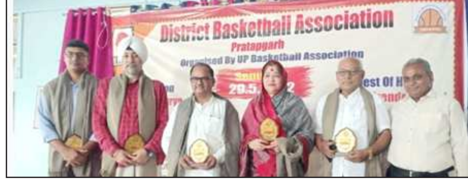
साकेत गर्ल्स पीजी कालेज में आयोजित सेमिनार में अतिथिगण।