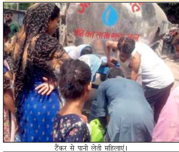
टैंकर से पानी लेती महिलाएं।