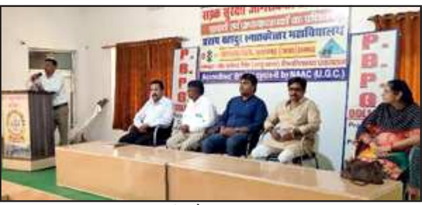
जागरूकता कार्यक्रम में मौजूद प्राचाय व प्राध्यापकगण।

इसके पूर्व प्रथम सत्र में जनपद के महाविद्यालय के प्राचायों एवं प्राध्यापकों को यातायात सम्बन्धित