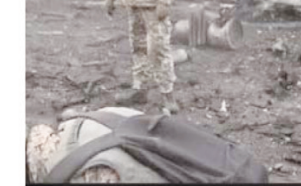
विशेषज्ञ मारे गए। 24 घंटों में 48 यूक्रेनी सैन्य ठिकानों पर हमला रूसी रक्षा मंत्रालय के प्रवक्ता

मेजर जनरल इगोर कोनाशेनकोव ने कहा कि रूस की वायुसेना ने पिछले 24 घंटे में यूक्रेन के 48