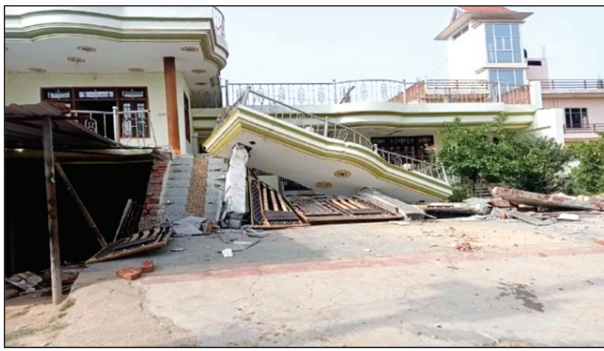
पीडीए ने हत्या आरोपियों के घर को बुलडोजर से गिराया