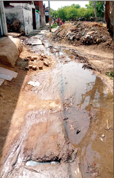
गांव में व्याप्त गंदगी

अखंड भारत संदेश कौशाम्बी। स्वच्छ भारत अभियान के अंतर्गत स्वच्छता मिशन में करोड़ों की रकम सरकारी खजाने से खर्च करने के बाद गांव की हालत बदतर बनी हुई है जिले के अधिकतर गांव में सफाई व्यवस्था पूरी तरह से चौपट हो चुकी है योजना से जुड़े अधिकारी लगातार स्वच्छता मिशन की सफलता का ढिंढोरा पीट रहे हैं आए दिन कार्यक्रम आयोजित कर स्वच्छता अभियान की सफलता पर बड़े बड़े भाषण दिए जा रहे हैं जबकि हकीकत इससे बहुत दूर है गांव-गांव भीषण गंदगी व्याप्त है जिले में साफ सफाई व्यवस्था पूरी तरह से चौपट है आधे से अधिक सफाई कर्मी गांव में सफाई करने नहीं जाते हैं कुछ सफाई कर्मी अपने स्थान पर दैनिक मजदूरी की इ्यूटी लगा कर महीने में कुछ दिन गांव की सफाई करा देते हैं डियूटी ना देने वाले सफाई कर्मियों की फर्जी उपस्थिति दर्ज कर सफाई कर्मचारियों को प्रत्येक महीने करोड़ों का भुगतान भी किया जा रहा है स्वच्छता अभियान में अधिकारियों की कारगुजारी बेहद चौकाने वाली है। एक तरफ मोदी और योगी सरकार स्वच्छ भारत अभियान में