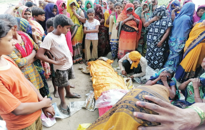
घटनास्थल पर लगी ग्राम वासियों की भीड़