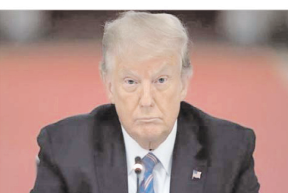
संशोधन का हवाला देते हुए लिखा, 'एक अपराधिक जांच