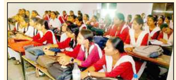
सुरक्षा सुरक्षा सम्बन्धी बैठक में मौजूद छात्राएं।