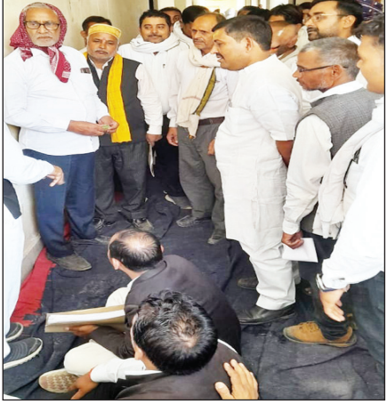
अनशन पर बैठे अधिवक्ता

मेजा के बजाय कोराव तहसील में ही 151 सीआरपीसी आदि की निगरानी पर अड़े अधिवक्ता