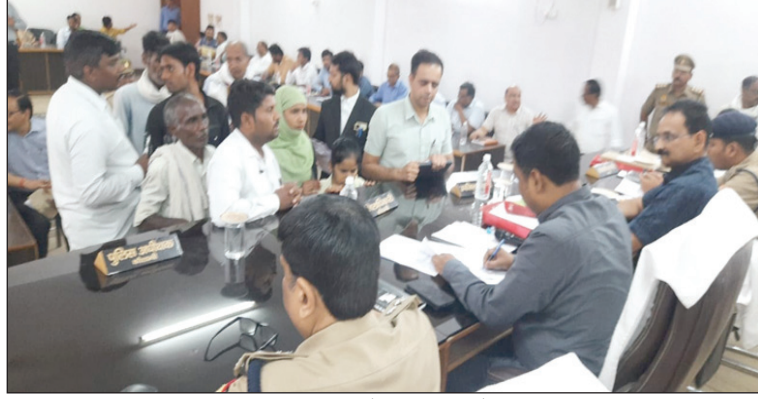
तहसील समाधान दिवस में फरियाद सुनते डीएम एसपी