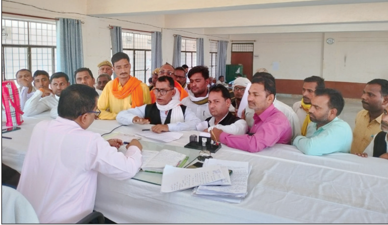
समाधान दिवस कोरांव में बार बेंच के मध्य वार्ता का दृश्य

अखंड भारत संदेश कोरांव। शनिवार को चुनाव के बाद पहली बार आयोजित सम्पूर्ण समाधान दिवस तहसील कोरांव अधिवक्ता संघ की जायज मांगों को ले कर हुए अनशन से फरियादी निराश दिखे, अधिवक्ता संघ एसीपी मेजा कार्यालय के बजाय कोरांव तहसील में ही एसीपी मेजा के स्तर से ही शांति भंग आदि मामलों की निगरानी, जमानत कार्यवाही किए जाने की मांग कर रहे। दरअसल प्रयागराज पुलिस