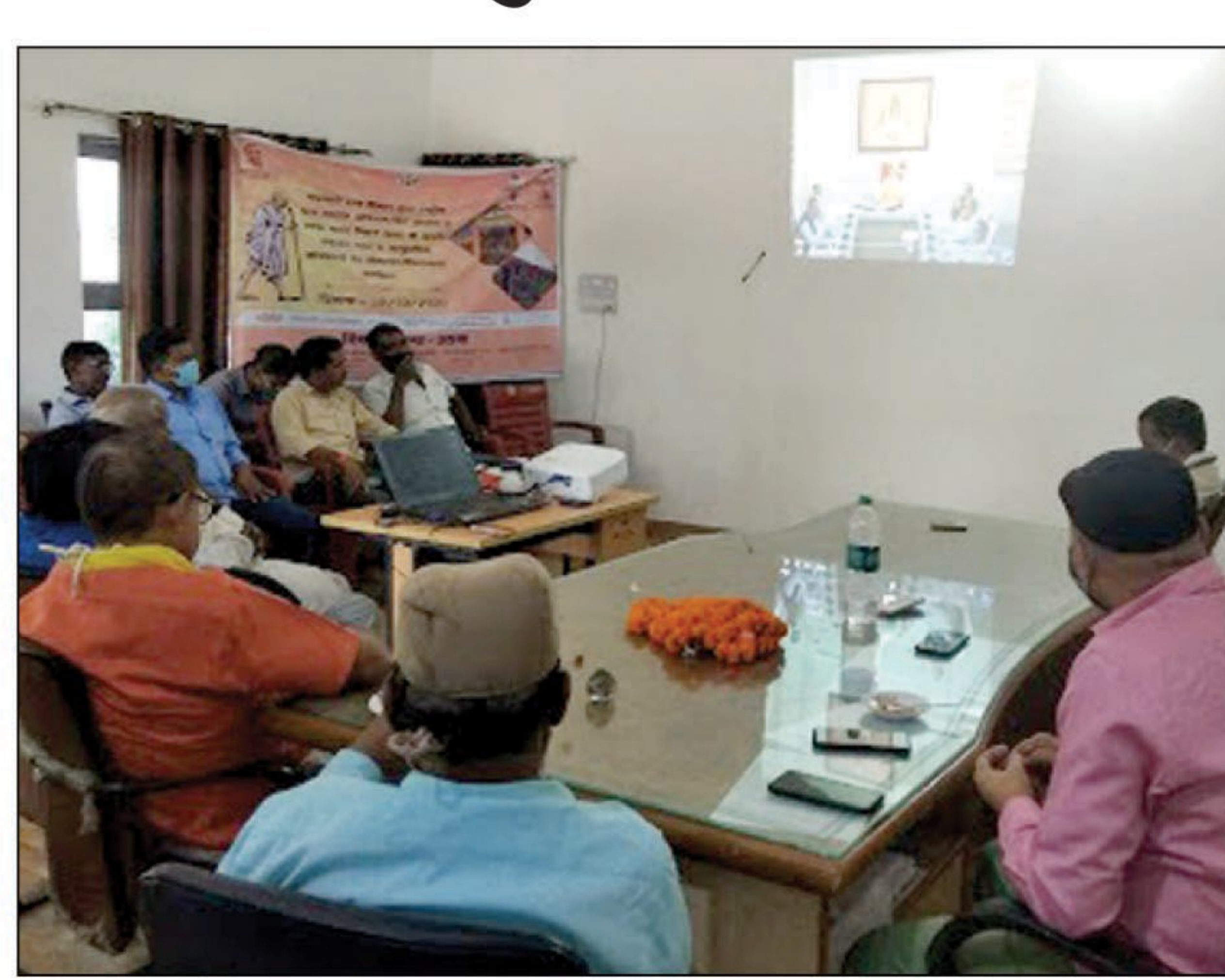
वीडियो कांफ्रेंसिंग से जुड़े लोग

मुख्यमंत्री ने उरुवा ब्लाक में सामुदायिक शौचालयों का किया वर्चुअल उद्घाटन