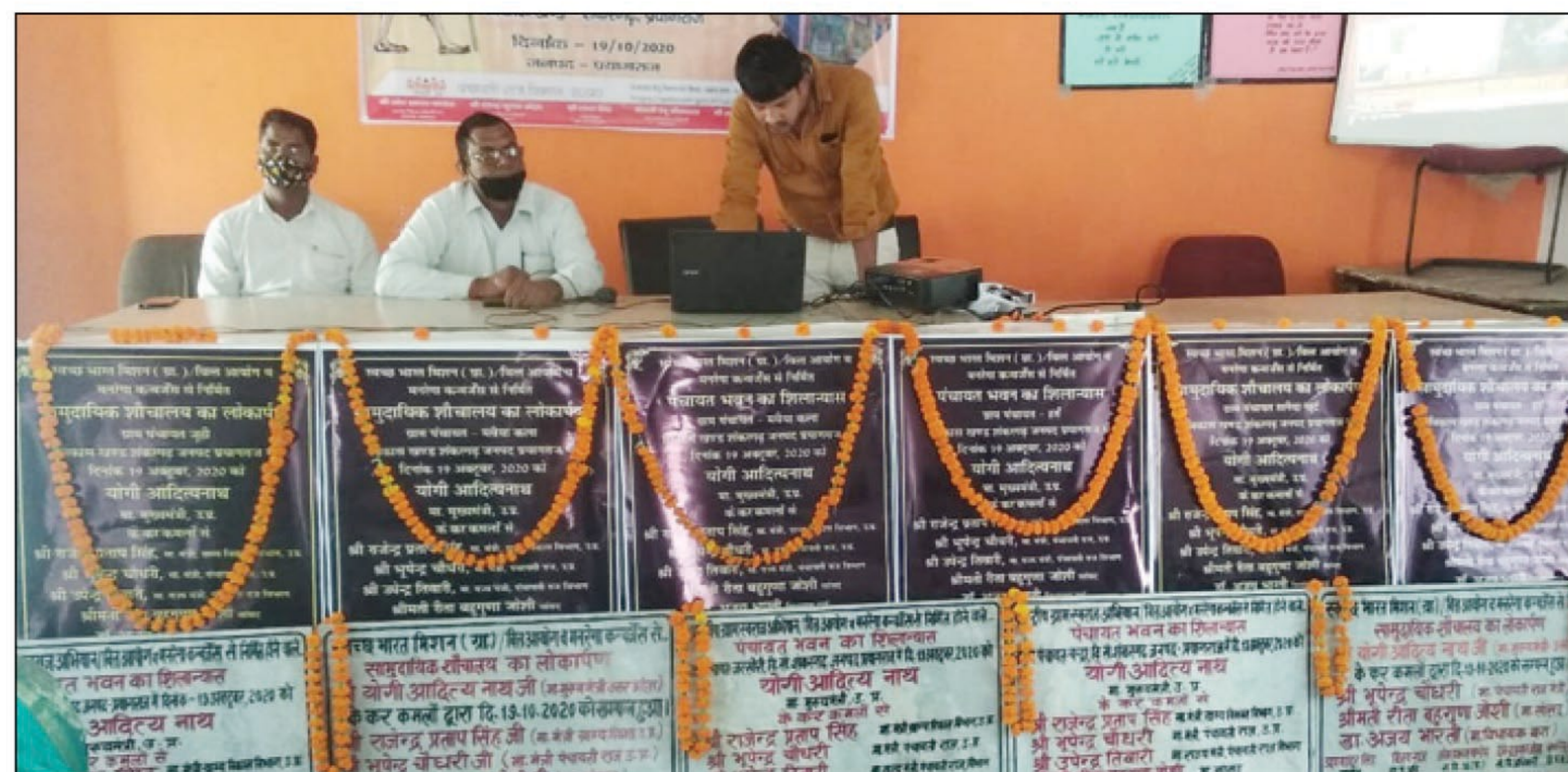
मुख्यमंत्री द्वारा किया गया सामुदायिक शौचालय व पंचायत भवन का लोकार्पण

शंकरगढ़। मुख्यमंत्री योगी आदित्यनाथ ने वीडियो कांफ्रेंसिंग के माध्यम से ग्राम स्वराज अभियान/वित्त आयोग, स्वच्छ भारत मिशन (ग्रामीण) व मनरेगा के अंतर्गत बने सामुदायिक शौचालयों व पंचायत भवन का लोकार्पण किया। सोमवार को मुख्यमंत्री योगी आदित्यनाथ जी के द्वारा वीडियो कांफ्रेंसिंग के माध्यम से प्रदेश पर की ग्राम पंचायतों में नव चुके सामुदायिक शौचालयों व पंचायत भवन का लोकार्पण किया गया और शेष ग्राम पंचायतों में सामुदायिक शौचालय व पंचायत भवन बनाने के लिए शिलान्यास किया गया। जिसमें विकास खण्ड शंकरगढ़ के 70 सामुदायिक शौचालयों का भी लोकार्पण किया गया तथा 24 पंचायत भवन व 6 सामुदायिक शौचालय का शिलान्यास किया