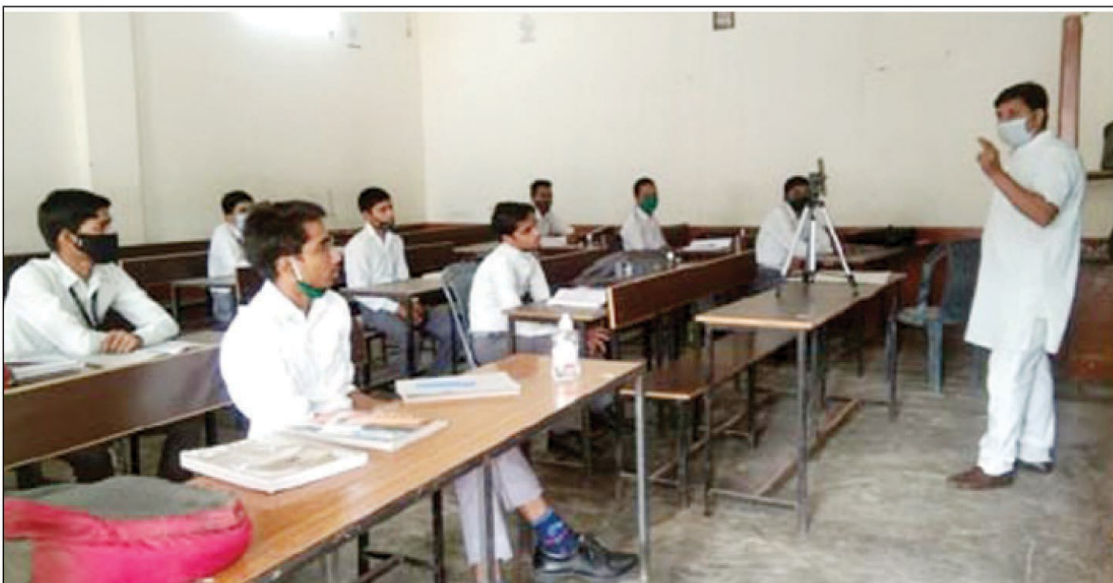
विद्यालयों में अध्ययन करते बच्चे