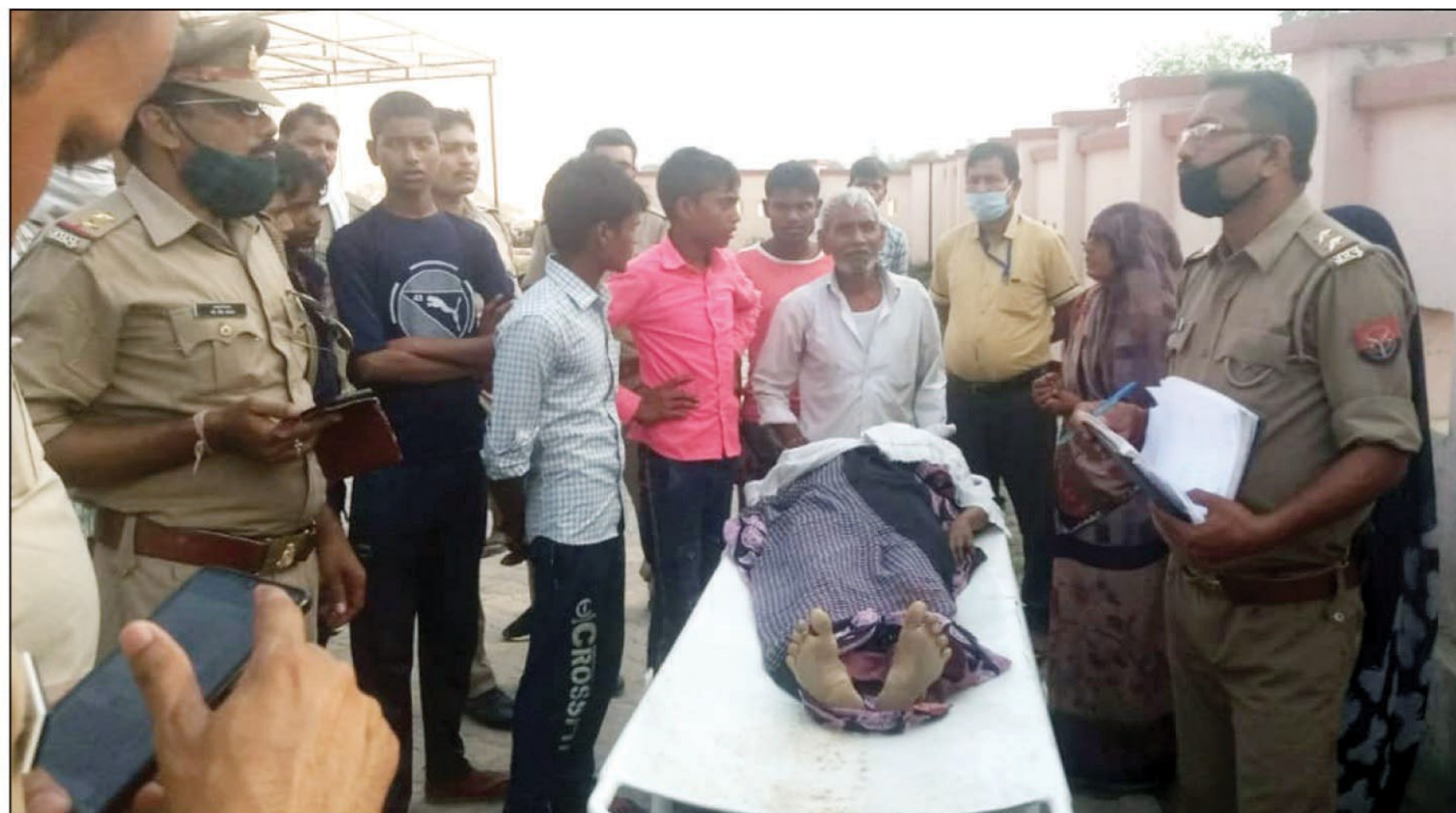
मऊआइमा सीएवसी में शवों को अपने कब्जे में लेती पुलिस