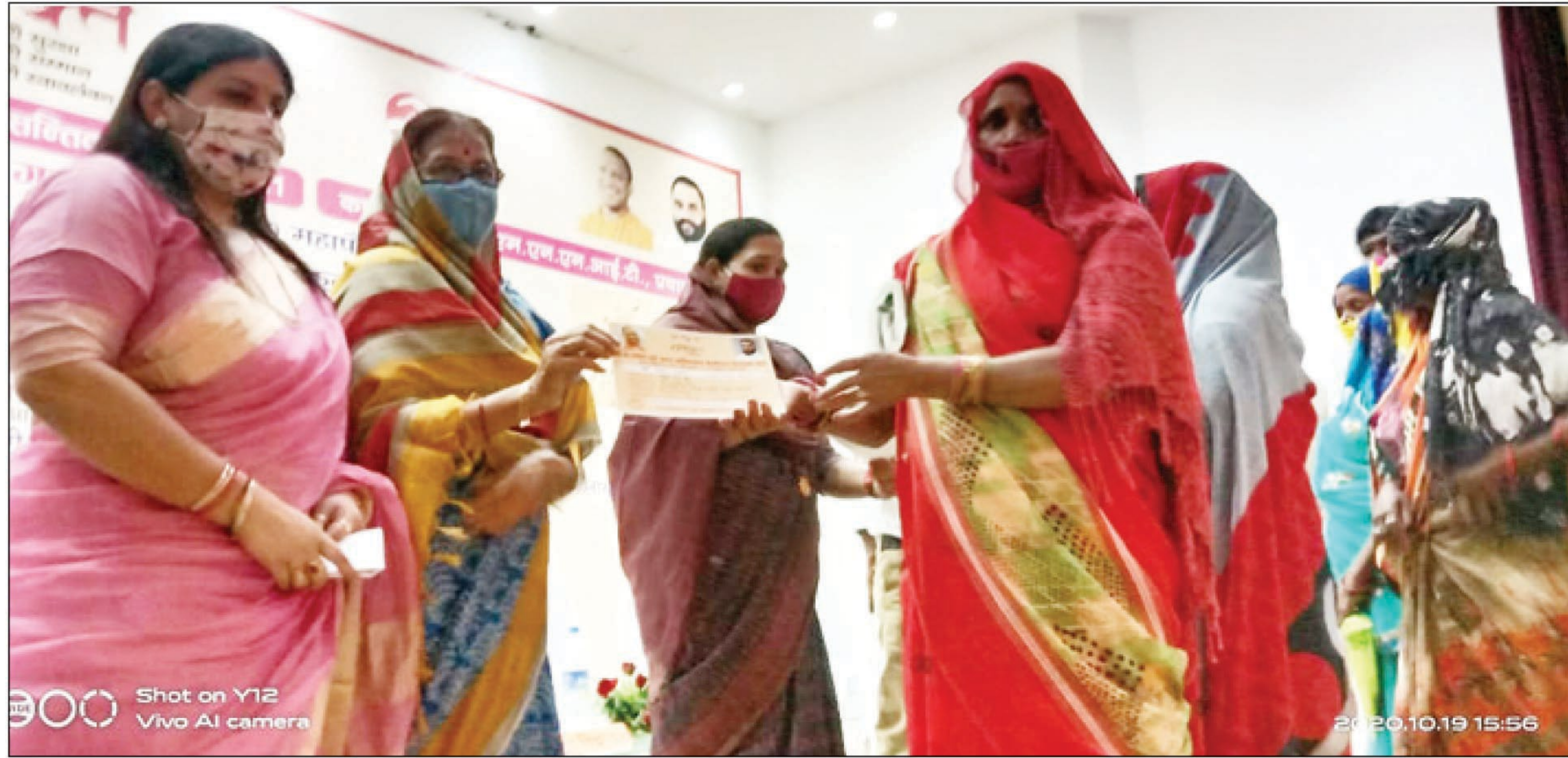
महिलाओं को प्रमाण पत्र वितरित करती सांसद