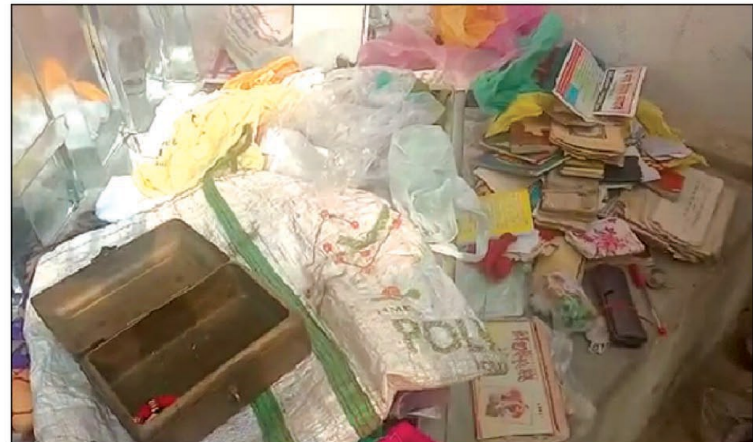
चोरी के बाद बिखरा सामान

हंडिया। हंडिया थाना क्षेत्र के बरौत चौकी क्षेत्र में इन दिनों चोरों के हौसले बुलंद होते जा रहे हैं। वही बरौत चौकी क्षेत्र में चोरी की घटना दिन पे दिन बढ़ती ही जा रही है। चोरों को न तो पुलिस प्रशासन का भय है। ना किसी अन्य का। वह जहां चाह रहे हैं वहां चोरी का अंजाम दे रहे हैं। इसमें पुलिस प्रशासन भी मौन धारण कर के बैठे हैं। आए दिन चोरियां होती रही है। सूत्रों के मुताबिक रविवार को रात्रि में कई गांव में चोरों ने अपनी चोरी का अंजाम देते जा रहे हैं। बताया जाता है कि बिलारी, टेला गांव में भी चोरों ने अपनी जान की बिना परवाह किए। किसी का भी घर में धावा बोल दे रहे हैं। यहां तक कि