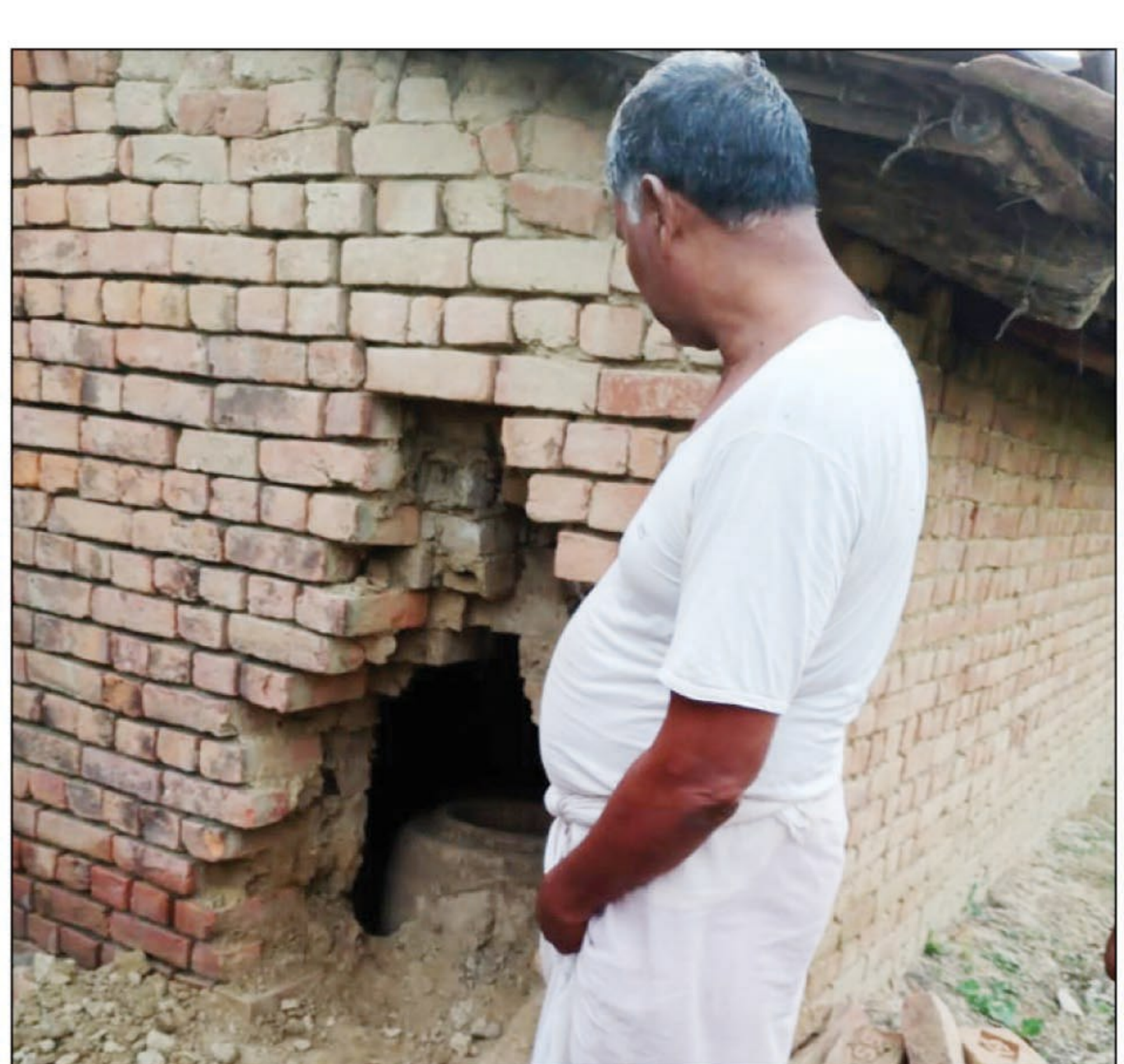
चोरों द्वारा की गई सेंधमारी

एक टुकड़ा बेंच कर बेटी की शादी की तैयारियों में लगे थे। नवरात्रि में बेटी की सगाई की रस्म अदायगी के लिए तैयारियां चल रही थीं कि रविवार रात अज्ञात चोरों की नजर लग गई, परिवार के सभी लोग शाम खाता खिचकर अपने-अपने कमरे सोने चले गए, उसी दरम्यान मध्यरात्रि अज्ञात चोरों का एक गिरोह उनके कच्चे मकान की दीवार में सेंध लगा कर पूरा घर खगाल ले गए। घर में रखवा बाक्स, अलमारी से नगदी समेत जेवरता आदि लगभग ढाई लाख रुपये तक की चीट पहुंचाते हुए चोर आसानी से अंजाम दे डाला, सुबह परिजनों की आंख खुलीं घर अंदर का नजारा देख दंग रह गए। सूचना इलाकाई पुलिस प्रशासन को दी गई जो मौका मुआयना कर लौट आयी, पीड़ित ने अज्ञात चोरों के खिलाफ कार्रवाई किए जाने को लेकर थाने में तहरीर दी है।