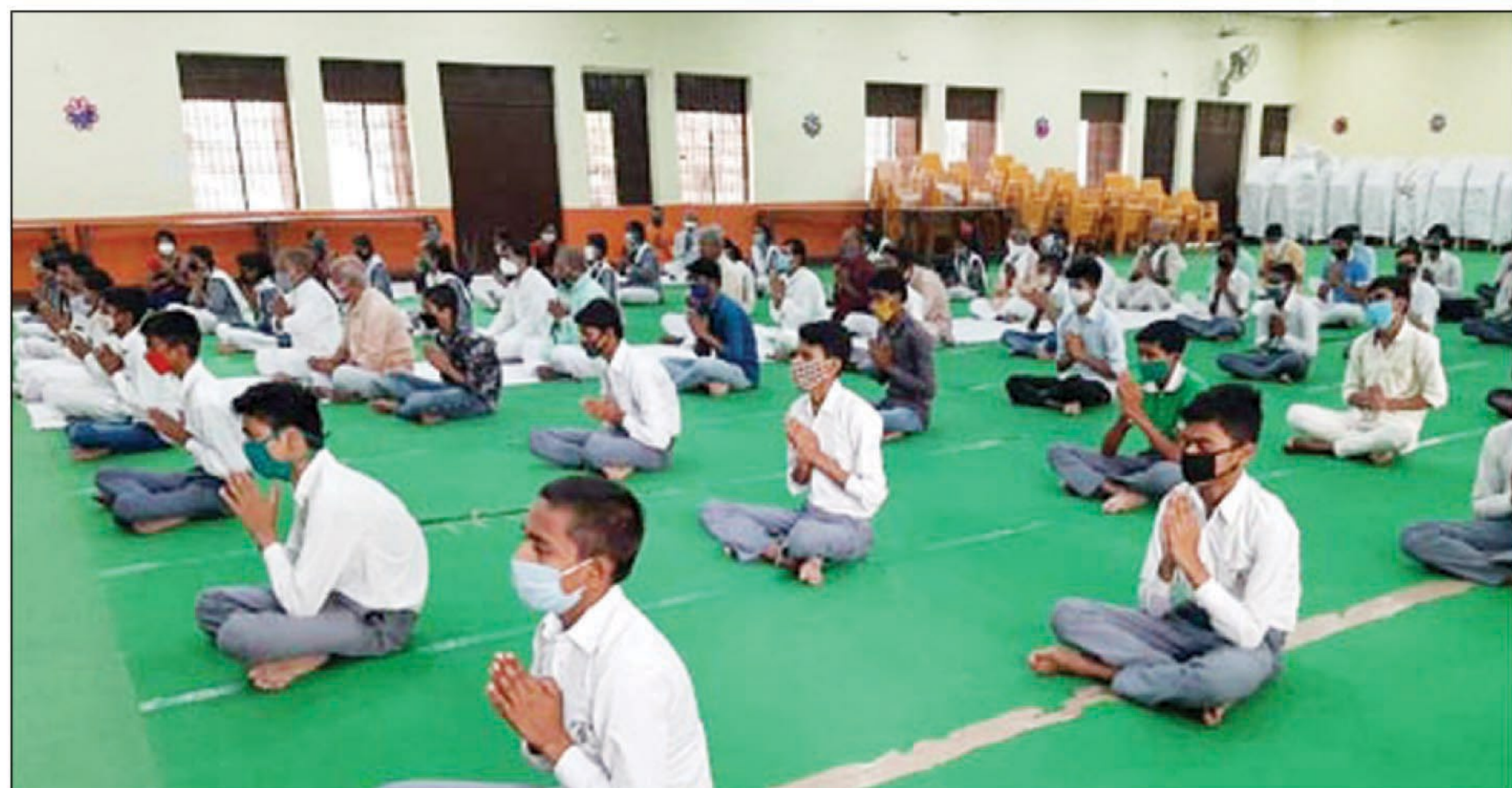
विद्यालयों में अध्ययन करते बच्चे

सराहनीय रहा। इसी प्रकार खरकौनी नैनी स्थित माधव ज्ञान केन्द्र में प्रशासन व शिक्षा विभाग के आदेशानुसार कक्षा नवम एवं दशम की कक्षाएं प्रथम पाली में तथा एकदश व द्वादश की द्वितीय पाली में प्रारम्भ हुयी। प्रशासन द्वारा कोविड-19 से सम्बन्धित बचाव हेतु दिये गये निर्देशों का पालन करते हुए आज आफ्लाइज शिक्षण प्रारम्भ