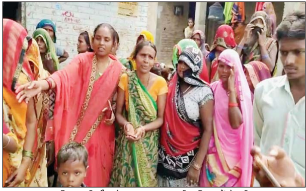
बालिका की मौत के बाद घर पर लगी महिलाओं के भीड़