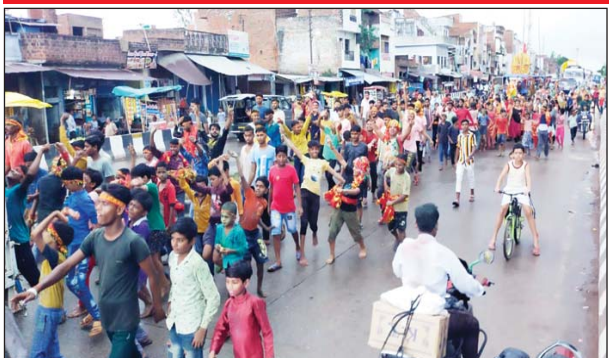
अखंड भारत संदेश

अशुवा कौशांबी। दुर्गा पूजा की समाप्ति के बाद मां दुर्गा की प्रतिमाओं के विसर्जन का सिलसिला शुरू हो गया, नगर पंचायत अशुवा क्षेत्र अजमतपुर, बीच का पुरवा रसूलपुर मटिया मई की 36 मूर्तियां, 9 विसर्जन स्थल सहित सहित नगर पंचायत में प्रतिस्थापित मां दुर्गा प्रतिमाओं का विसर्जन किया गया श्रद्धालुओं ने मंगल कामना के साथ मां दुर्गा की प्रतिमाओं को ससुर खदेरी नदी में विसर्जित किया है। दोपहर बाद श्रद्धालुओं ने गाजे बाजे डीजे के साथ पूजा स्थल से शोभायात्रा निकाली जो नगर पंचायत की गलियों में जन्यकार लगाते रहे शोभायात्रा में हजारों नर नारी बच्चे बड़े नवजवान शामिल रहे! इस वर्ष नवमी के दिन बरसात की हल्की फुहारें पड़ रही थीं मौसम बहुत खुशनुमा था शोभायात्रा में श्रद्धालुओं का इतना बड़ी मात्रा में शामिल होना उनकी भक्ति को प्रदर्शित कर रहा था। नवरात्रि भर मां जगत जननी का गुणगान करके बुधवार को नवमी को पूजन कर कन्या भोज का आयोजन कर भक्तों ने आदि शक्ति दुर्गा मां को दशमी को विदा किया है बीती मंगलवार की रात नगर पंचायत अशुवा के वार्ड में 12 नयानगर में आयोजकों ने दुर्गा आरती के समय भक्ति मय कार्यक्रम भी कराया आयोजकों ने शाम को भंडो का आयोजन भी किया जिसमें नगर तथा ग्रामीण क्षेत्र के लोगों ने प्रसाद ग्रहण किया है तत्पश्चात् कथावाचक जिनका कार्यक्रम पिछले 9 दिनों से चल रहा था जिसमें नगर के भक्त सहित ग्रामीण क्षेत्रों के भक्त आकर संगीतमय भक्ति रसों का श्रवण कर मां के पंडाल में शेरारवाली का जन्यकार लगाते रहे उपस्थित लोग मां के जन्यकार पर झूमते रहे बीच बीच में छोटे छोटे बच्चों बच्चियों द्वारा झांकियों एवम गरबा नृत्य का उकृष्ट प्रदर्शन किया गया। वहीं आज बुधवार दोपहर बाद