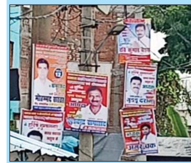
नगर के प्रमुख स्थानों, खम्भो में होर्डिंग लगाकर अपनी दावेदारी कर रहे मजबूत

अशुवा कौशांबी। नगरीय निकाय के चुनाव को लेकर भले ही अभी अधिकृत घोषणा न हुई हो लेकिन दावेदार नगर पंचायत के प्रमुख स्थानों विद्युत पोली, चौराहो पर दीवारों में अपने होर्डिंग टैंगवाकर अपनी दावेदारी को हवा दे रहे हैं दावेदार निकाय चुनाव को लेकर अपनी सियासी गोट विजने में जुट गए हैं विभिन्न राजनीतिक दलों में आस्था रखने वालों ने अपने सिपहसालारों को चुनाव में मतदाताओं को अपने पाले में जुटाने का पुरजोर प्रयास करना शुरू कर दिया है देवी पंडालों धार्मिक कार्यक्रमों में दावेदार बढ़चढ़ कर हिस्सा लेने को उतावले हुए जा रहे हैं बीती नवरात्रि में तमाम दावेदारों ने दुर्गा पूजा पंडाल पहुंचकर दिल खोलकर दान दक्षिणा करते नजर आए हैं नगर के मतदाताओं के प्रत्येक कार्य में पहुंच कर अपनी हवा देने में लग गए हैं नगर पालिका नगर पंचायतों में अभी न तो चुनाव की तिथि की घोषणा हुई न तो अभी सीट निर्धारण का आरक्षण हुआ किंतु दावेदार अपनी तैयारी में जुट चुके हैं सोसल मीडिया में जमकर अपने पोस्टर बैनर को हवा देकर माहौल बनाने में जुटे हैं वहीं नगर वासी भी बड़े चाव से उनके बैनर पोस्टर को देख मजे लेकर अपने दावेदार को सोच परख रहे हैं।