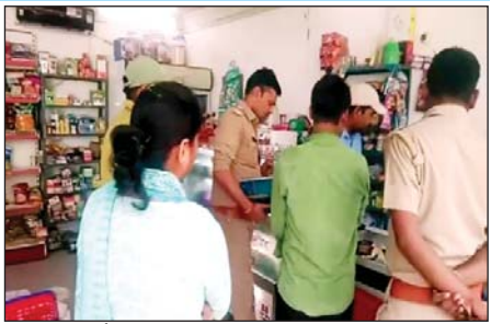
चोरी की घटना की जांच करती पुलिस

कौशांबी। जिले के विभिन्न थाना क्षेत्रों में चोरी की घटनाएं नहीं रुक रही है आम जनमानस चोरी की बढ़ती घटनाओं से भयभीत है आए दिन किसी न किसी थाना क्षेत्र में चोरी की घटनाओं को अंजाम देकर चोर गिराह के सदस्य फरार हो जाते हैं और पुलिस लकीर पीटते रह जाती है बीती रात फिर चरवा थाना क्षेत्र के महागाव चौकी अंतर्गत फैमिली मार्केट में चोरों ने धावा बोल दिया है फैमिली मार्केट से चोरों ने लाखों की चोरी की घटना को अंजाम दिया है। फैमिली मार्केट के संचालक के अनुसार बीती रात चोरों ने फैमिली मार्केट की छत के ऊपर से नीचे आए और ताला तोड़कर मार्केट के अंदर घुस गए और काउंटर के ड्रॉल में रखे नगदी सवा लाख रुपए व पन्द्रह डी वी आर कैमरा समेत कीमती सामान उठा ले गए, सुबह जब मार्केट का ताला खोलकर संचालक अंदर गया तो मार्केट का हाल देखकर उसके होश उड़