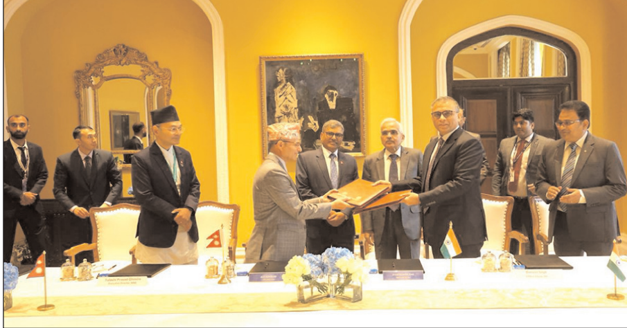
एक संयुक्त नियामक तंत्र की स्थापना की जाएगी। मुंबई में आज दोनों देशों के गवर्नरों के बीच हुए समझौते के बाद इसे आर्थिक क्षेत्र में ऐतिहासिक दिन के रूप में बताया गया है। नेपाल राष्ट्र बैंक ने