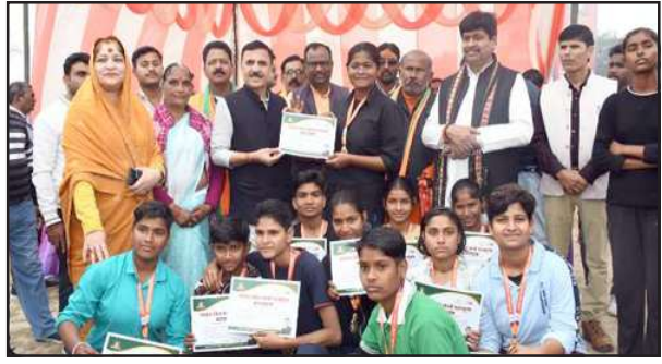
खिलाड़ियों को प्रमाण पत्र देते सांसद विनोद सोनकर

उक्त बातें बुधवार को कौशाब्बी सांसद, संसदीय आचार समिति लोकसभा के सभापति, दादा नगर हवेली एवं दमन दीव के प्रभारी विनोद सोनकर ने कुण्डा विधानसभा के उंचा गांव में गांव चलो अभियान में उपस्थित जनसमूह के बीच कही। सांसद