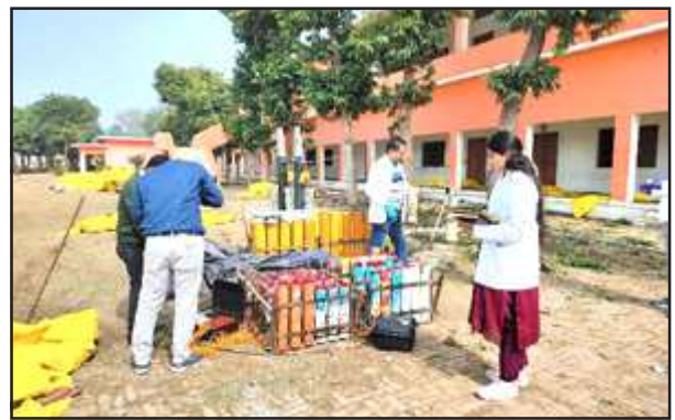
बम विस्फोट की जांच करती टीम।