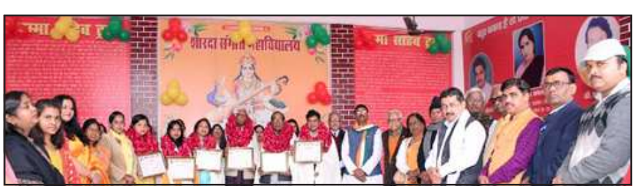
शारदा संगीत महाविद्यालय में आयोजित कार्यक्रम में सम्मानित अतिथिगण।

उक्त अवसर पर समारोह के मुख्य अतिथिगण क्रमशः जनता