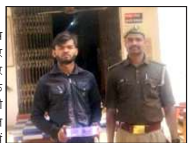
पुलिस गिरफ्त में चोर।