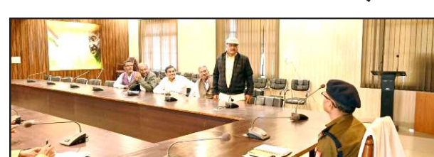
बैठक में बोलते एसपी।

बुधवार को पुलिस कार्यालय राघव प्रेक्षागार में पुलिस अधीक्षक की अध्यक्षता में व्यापारियों से सामस्यायें पूछीं। समस्या समाधान के प्रति भरोसा दिया। पुलिस अधीक्षक ने सभी से अपील किया कि अपनी-अपनी दुकानों, मकानों व प्रतिष्ठानों के सामने सीसीटीवी कैमरे अवश्य लगवायें, ताकि कोई अप्रिय घटना होने पर संपूर्ण