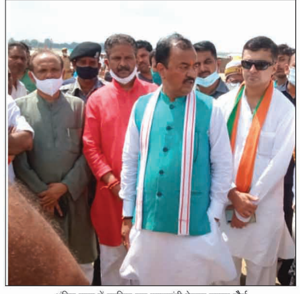
अंतिम यात्रा में शामिल उप मुख्यमंत्री केशव प्रसाद मौर्य