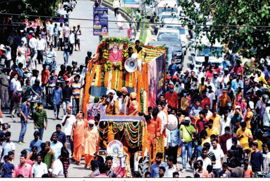
दिवंगत महंत के अंतिम यात्रा में उमड़ा जनसैलाब