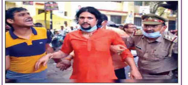
कड़ी सुरक्षा के बीच 14 दिन के लिए भेजा गया नैनी जेल