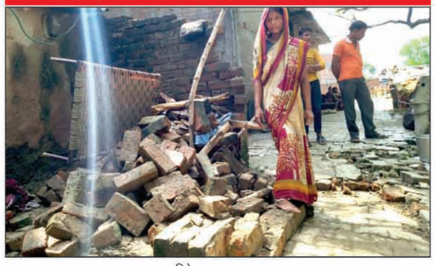
गिरे घर का दृश्य

गया है बर्तन कपड़ा विस्तर अनाज आदि भी अब उसके पास जीविकोपार्जन के लिए नहीं बचा है लंबे चौड़े भाषण देने वाले सत्ता पक्ष और विपक्ष के भी नेता भी गरीब महिला का हाल लेने नहीं पहुंच सके