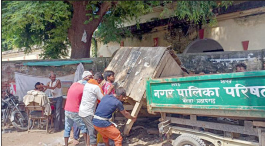
पालिका उठा ले गई। फिर पंजाबी मार्केट, फलमण्डी, ठठैरी बाजार में भी गुमटियां इसी तरीके से अतिक्रमण करने वाली को हटाया गया तथा एक-एक हजार का जुर्माना ठोका गया। नाले-नालियों तथा सड़क पर अतिक्रमण करने वालों से लगभग

अखंड भारत संदेश प्रतापगढ़। नगर पालिका ने बुधवार को नगर में विभिन्न स्थानों पर अतिक्रमण विरोधी अभियान चलाकर नाले-नालियों पर कब्जा करने वाले गुमटियों को न केवल हटाया बल्कि उन पर जुर्माना भी ठोका। सबसे पहले नगर पालिका के कर्मचारी राजकीय बालिका इंटर कालेज के चारों तरफ चूड़ी, कपड़ा बेंचने वाले नाले-नालियों पर गुमटी रखकर अतिक्रमण किये हुए थे। उनकी गुमटियां हटाई गईं। दो गुमटी नगर