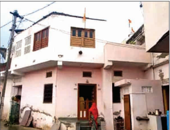
राजस्थान स्थित आनंद गिरि का मकान