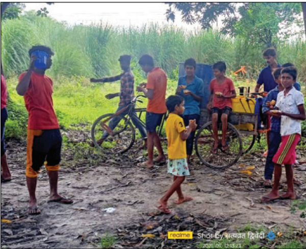
हरदुआ गांव में वृद्ध रूप से स्वच्छता अभियान चलाकर गांव के युवाओं ने सार्वजनिक जगहों स्कूल मंदिर आदि की सफाई कार्य करते।

माफियाओं ने लेखपाल को पटा कर अभिलेखों में दूसरों के नाम कर दी गई है। जिंदा से मुर्दा बनी महिला का पति और आधा दर्जन बेटे बहू मौजूद है। और जिला मजिस्ट्रेट से भू माफिया और राजस्व कर्मियों को तत्काल बखर्स्त कर जेल भेजे जाने की मांग की। इस प्रकरण को प्रशासन ने खुफिया एजेंसी से भी जांच कराई। जिसकी रिपोर्ट प्रशासन को जा चुकी है। यह भी चर्चा है कि उक्त लेखपाल की रिश्तेदारी देवघाट और आसपास के गांवों में है। जिनके रिश्तेदारों द्वारा ज्यादातर जमीनें लोग अवैध कब्जा हैं। और पूरी मुख्य मार्गों पर अनाधिकृत रूप से काबिज हैं, जिससे लोक सम्पत्ति निवारण अधिनियम का उल्लंघन हो रहा है। किन्तु उनके विरुद्ध कार्यवाही न करके अपने रिश्तेदारों के विपक्षियों का लोकल राजनीति में आकर किसी का मकान गिरवाने तो किसी को तरह तरह से परेशान करने का कार्य कर रहा है।