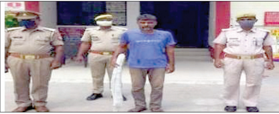
पत्नी की हत्या में नामजद पति परदेश भागने की फिराक में था पुलिस ने धर दबोचा