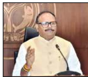
डिप्टी सीएम बृजेश पाठक।

शुक्रवार को हुई बैठक में सुबे के डिप्टी सीएम बृजेश पाठक ने