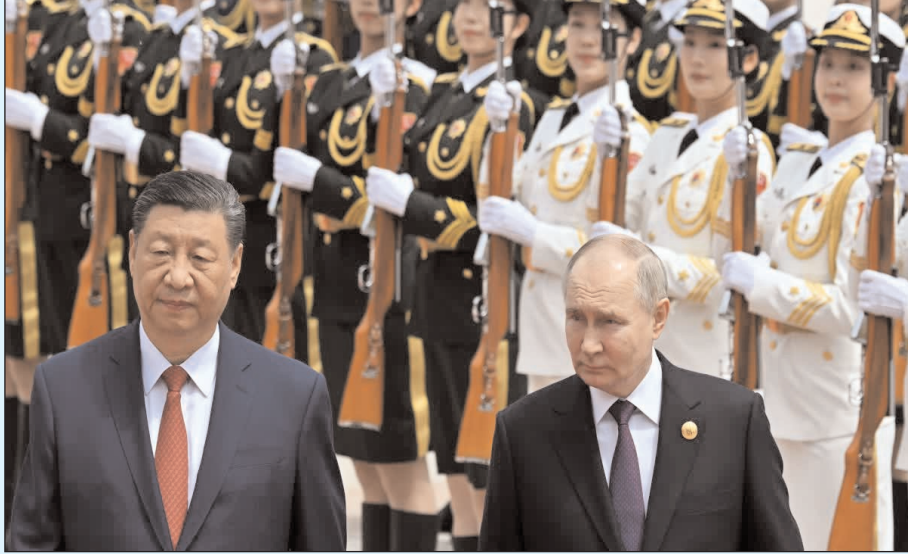
कहा कि चीन-रूस संबंधों का भविष्य उज्वल है और उन्होंने कहा कि इस वर्ष चीन-रूस

बीजिंग : राष्ट्रपति शी जिनपिंग ने शुक्रवार को कहा कि अमेरिका के विरोध के बावजूद चीन और रूस के बीच रणनीतिक संबंध एक ऐतिहासिक शुरुआती बिंदु पर हैं। उनके रूसी समकक्ष व्लादिमीर पुतिन ने यूक्रेन में युद्ध खत्म करने के लिए समझौता बातचीत के लिए तत्परता व्यक्त करते हुए अपनी दो दिवसीय यात्रा समाप्त कर दी है। पुतिन मार्च में दोबारा चुने जाने के बाद चीन की अपनी पहली यात्रा के लिए गुरुवार को यहां पहुंचे और अपनी रणनीतिक सहयोग साझेदारी को जारी रखने के लिए एक विजन डॉक्यूमेंट पर हस्ताक्षर करने के अलावा शी के साथ कई दौर की बातचीत की। राष्ट्रपति शी ने हार्बिन में 8वें रूसी-चीनी एक्सपो में अपने संदेश में