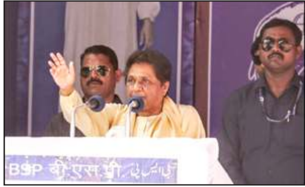
जनसभा को सम्बोधित करती पूर्व मुख्यमंत्री मायावती।

मायावती ने आरोप लगाया कि भाजपा, कांग्रेस व अन्य पार्टियों ने बांड के जरिये करोड़ों रुपये कम्पनी से लिया है। इसका खुलासा सर्वोच्च न्यायालय ने किया है। मायावती ने कहा कि भाजपा ने अपने शासन में अल्पसंख्यकों की स्थिति को खराब कर दिया है। आज उनकी स्थिति