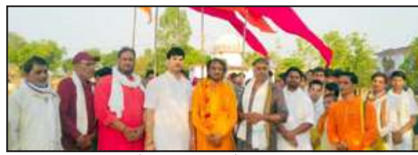
शोभायात्रा निकालते ग्रामीण।