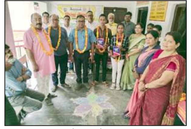
शिक्षक चौपाल में मौजूद शिक्षकगण।