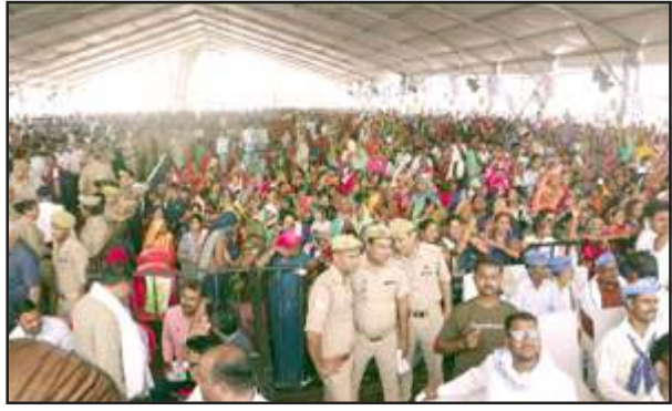
जनसभा में उमड़ी भीड़।

उन्होंने कहा कि टिकट बंटवारे में हमने सर्व समाज को उचित भागीदारी दी जिससे बेहतर परिणाम की आशा है। आज इस कड़ाके की धूप में आई बड़ी भीड़ से उत्साहित