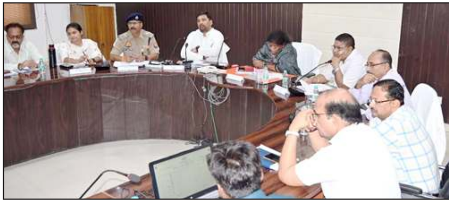
प्रेक्षकों को जानकारी देते डीएम।

शुक्रवार को कलेक्टर ड्रट सभागार में जिलाधिकारी ने स्टाइड से पोलिंग स्टेशन, सेक्टर मजिस्ट्रेट, जोनल मजिस्ट्रेट, कैश सीजर, ज्वलंत/क्रिटिकल पोलिंग बूथ, अंतर्राज्यीय सीमाओं पर चेक पोस्ट, चेक पोस्ट बैरियर आदि बिंदुओं पर प्रेक्षक को जानकारी दी। जिलाधिकारी ने बताया कि जिले में 20 मई को मतदान है। भारत निर्वाचन आयोग की