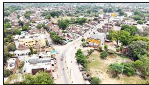
ड्रोन कैमरे से सीतापुर का दृश्य।