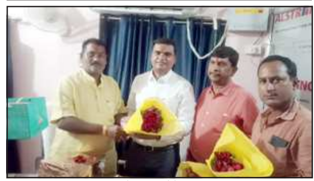
अधिशाषी अभियंता को विदाई देते अध्यक्ष व कर्मचारीगण।

द्वारा ईओ के स्थानांतरण के बाद अभी किसी की तैनाती नहीं हो