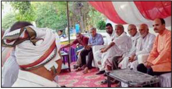
प्रबंध समिति की बैठक में मौजूद पदाधिकारीगण।

किसी भी प्रकार के वाहन निषिद्ध होंगे, साथ ही क्षेत्रीय लोगों की मदद से निजी स्टैन्ड व पार्किंग व्यवस्था