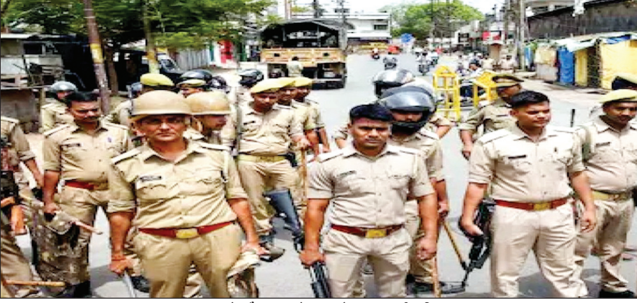
नमाज के दौरान पुराने शहर में गस्त करती पुलिस