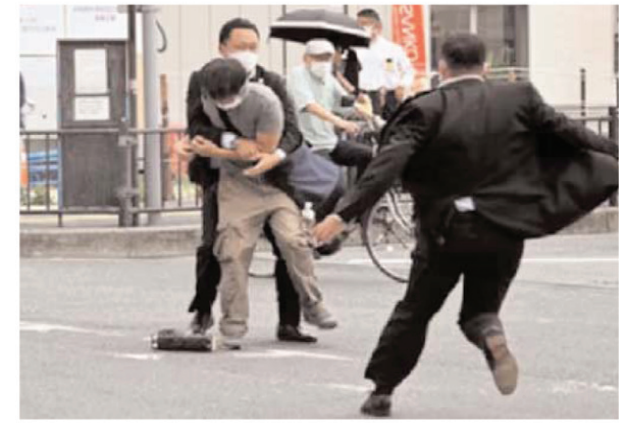
साफ हुआ कि उन पर पीछे से