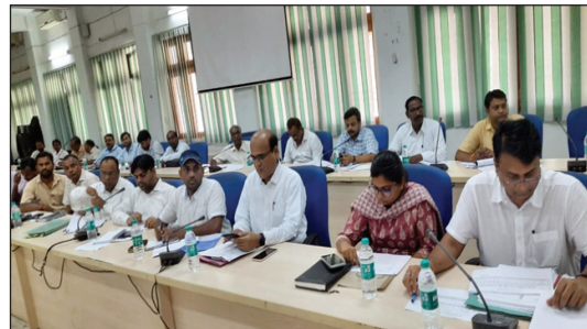
समीक्षा बैठक में उपस्थित विभिन्न विभाग के अधिकारी

विभागीय अधिकारी को जिम्मेदारी तय कर कार्यवाही की जायेंगी उन्हेोंने सभी कार्यवाही संस्थाओं को निर्माणधीन कार्यों को गुणवत्तापूर्ण समयान्तर्गत तेजी से पूर्ण कराने के निर्देश दिये इसके साथ ही उन्हेोंने विभागीय अधिकारियों को भी निर्माण कार्यों को विशेष ध्यान देकर पूर्ण करवाने के निर्देश दिये बैठक में हर-घर तिरंगा कार्यक्रम की समीक्षा के दौरान जिला विकास अधिकारी ने बताया कि तिरंगा बनाने हेतु 277 स्वयं सहायता समूहों को चिन्हित कर प्रशिक्षण दिया गया है जिस पर जिलाधिकारी ने मुख्य विकास अधिकारी को डीपीआरओ जिलापूर्ति अधिकारी सहित