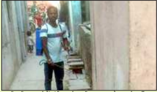
चिलबिला वार्ड में एंटी लार्वा का छिड़काव करते सफाई कर्मी।

इन अधिकारियों के आदेशों के चलते आज शुक्रवार की पाम