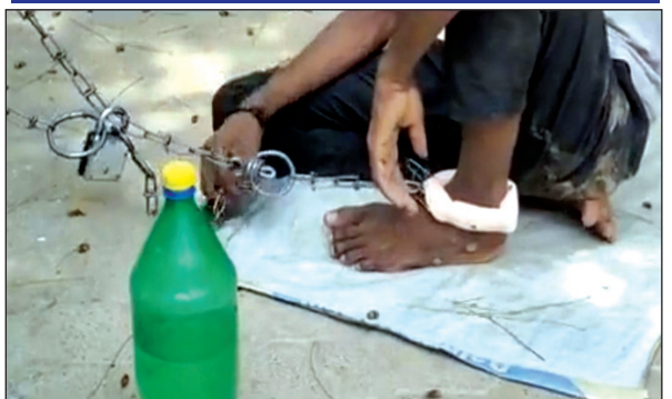
जंजीरों में जकड़ा मानसिक रोगी

परिजनों को लगता है कि इनके ऊपर किसी अहश्य ताकत का साया है। और मजार पर जंजीर से बांध देने से वो ठीक हो जाएगा