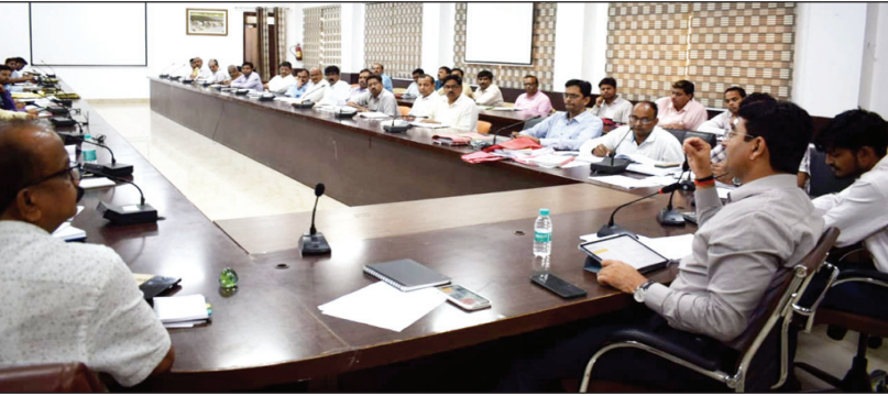
विकास कार्यों को लेकर समीक्षा बैठक करते जिलाधिकारी

कायाकल्प योजना के तहत विद्यालयों में शौचालयों का निर्माण कार्य शत-प्रतिशत पूर्ण कराये जाने का निर्देश दिया है। गोवंश आश्रय स्थलों में संरक्षित गोवशों की समीक्षा करते हुए उन्होंने संरक्षित सभी गोवशों की ईंटर टैगिंग एवं टीकाकरण अनिवार्य रूप से कराये जाने तथा गोसंरक्षण केन्द्रों में और निराश्रित गोवशों को संरक्षित किए जाने का निर्देश दिया है। जिलाधिकारी ने पीडब्ल्यूडी एवं सेतु निगम के अधिकारियों को निर्माणधीन सड़कों एवं सेतुओं के निर्माण कार्य को लक्ष्य के सापेक्ष शत-प्रतिशत पूर्ण किए जाने का निर्देश दिया है। उन्होंने निर्माण कार्यों में गुणवत्ता एवं समयबद्धता का विशेष ध्यान दिए