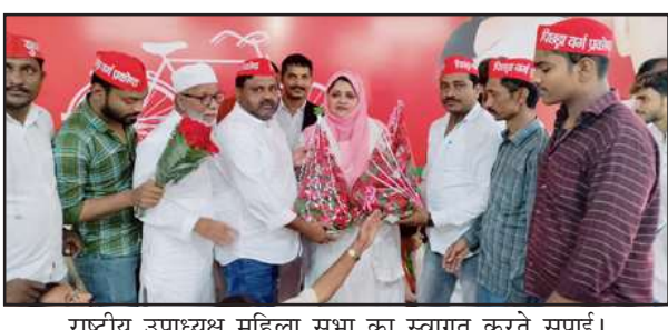
राष्ट्रीय उपाध्यक्ष महिला सभा का स्वागत करते सपाई।