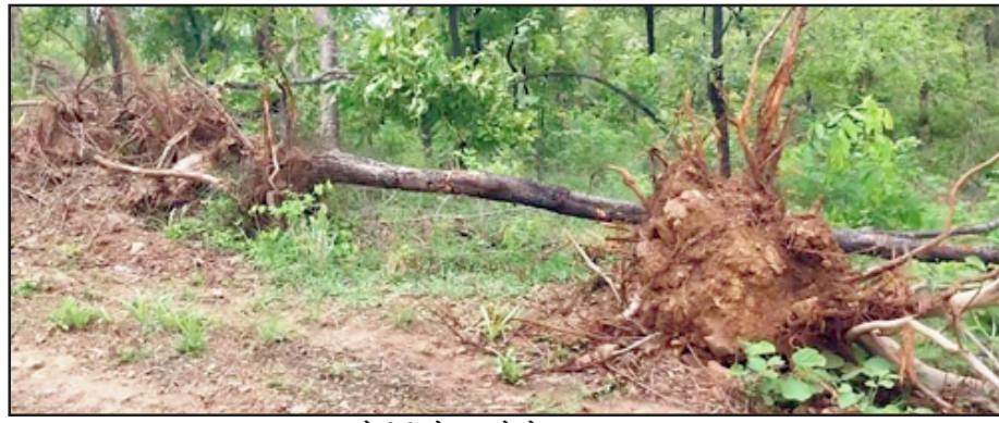
जेसीबी से उखाड़े पेड़ का दृश्य।

चित्रकूट। सूबे के मुख्यमंत्री आदित्यनाथ के प्रदेश में पेड़ लगाओ-पेड़ बचाओ अभियान में लोग बढ़-चढ़कर हिस्सा ले रहे हैं। इस अभियान को मारकुण्डी रेंज में पलीता लगाया जा रहा है। अभियान से उलट हरे-भरे जंगलों को उजाड़ा जा रहा है। ये खुलासा मानिकपुर तहसील के मारकुण्डी रेंज में हुआ। बताया गया कि रानीपुर टाइगर रिजर्व मारकुण्डी रेंज-2 के जंगलों में खूलेआम जेसीबी से पेड़ों को नष्ट किया जा रहा है। जिम्मेदार कार्यवाही की जायज खासोश है। मानिकपुर-इटावा डुडैला मार्ग के मारकुण्डी स्थित मार्कंडेय फील्ड स्टेशन के पास