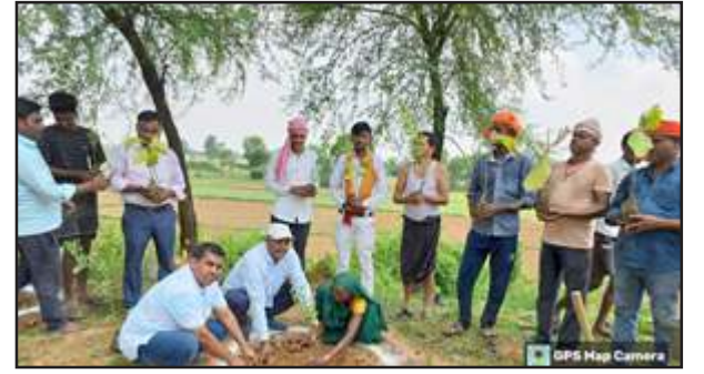
वृक्ष लगाते बीडीओ आदि।