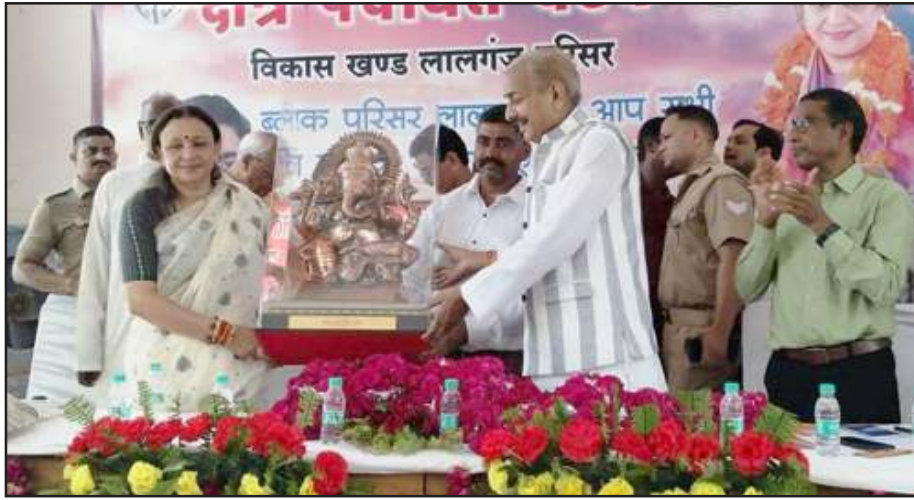
बैठक में सांसद व विधायक को सम्मानित करते प्रमुख व अन्य।