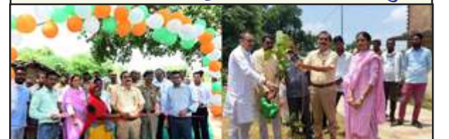
वृक्षारोपण का शुभारंभ करते व अटल पार्क में पौधा लगाते कमिश्नर आदि।

लोडवारा के हरे-भरे वृक्षों को देख जताई खुशी