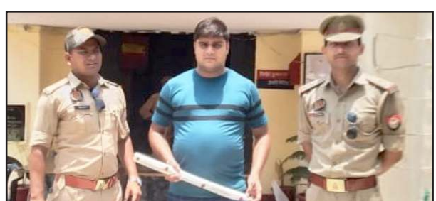
पुलिस गिरफ्त में हमलावर।