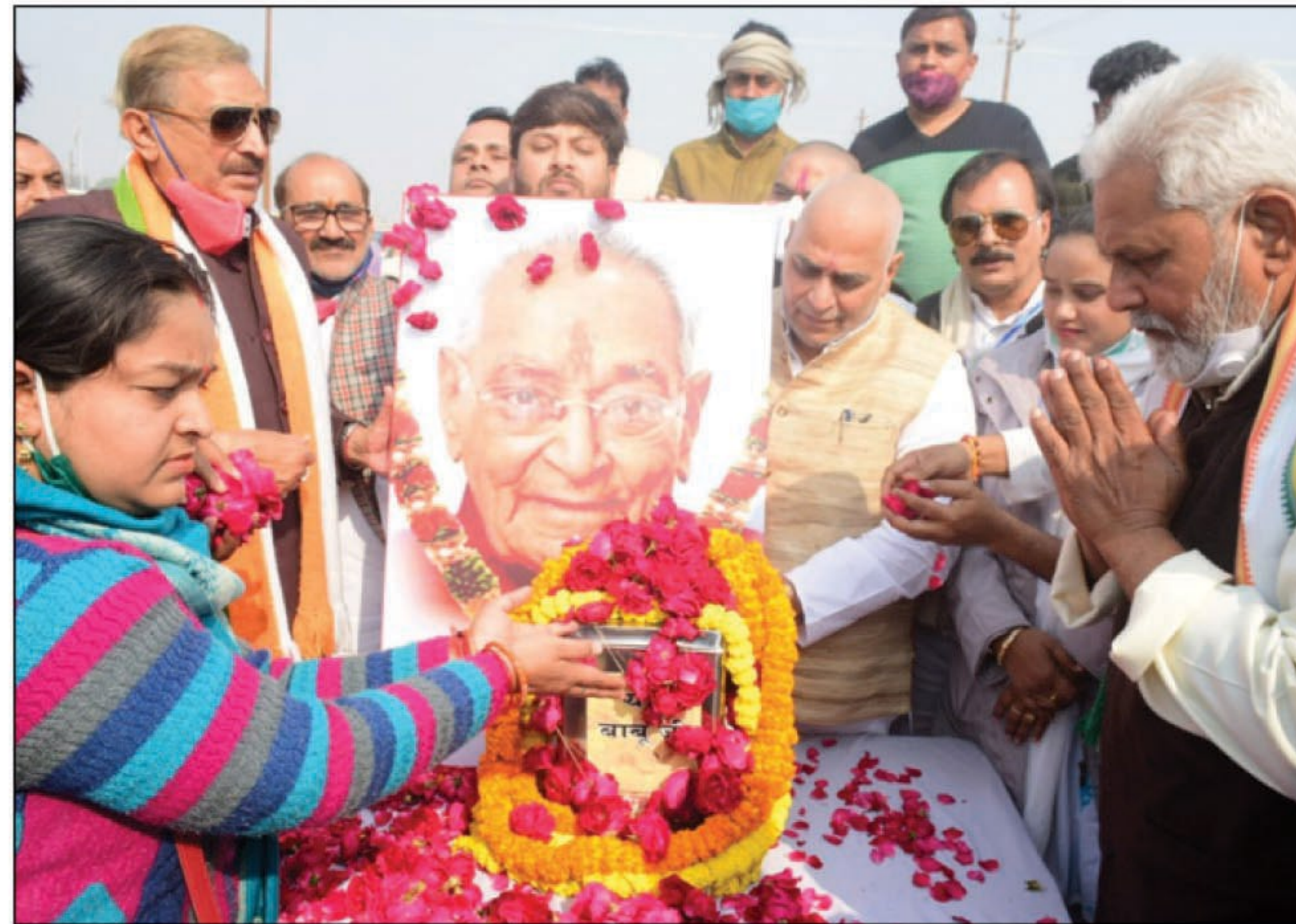
पूर्व राज्यपाल मोतीलाल वोरा के चित्र पर पुष्प अर्पित कर श्रद्धांजलि देते व संगम में अस्थियां विसर्जित करने जाते कांग्रेस नेता