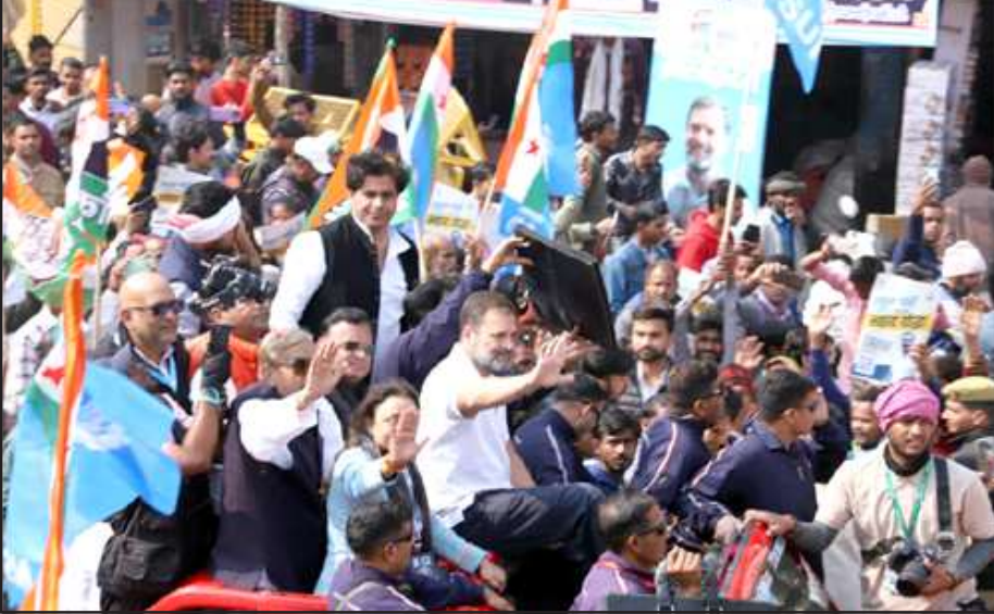
लोगों का अभिभावदन स्वीकार करते राहुल गांधी।

उन्होंने कहा कि मोदी सरकार हक और अधिकार की आवाज उठाने पर ईडी, सीबीआई, प्रवर्तन दल के जरिये देश में भय का माहौल बनाये हुए है। इससे लोकतंत्र कमजोर हो रहा है। उन्होंने कहा कि भाजपा सरकार में किसानों को दर्द झेलना पड़ रहा है तो देश के