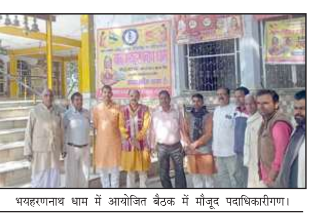
भयहरणनाथ धाम में आयोजित बैठक में मौजूद पदाधिकारीगण।