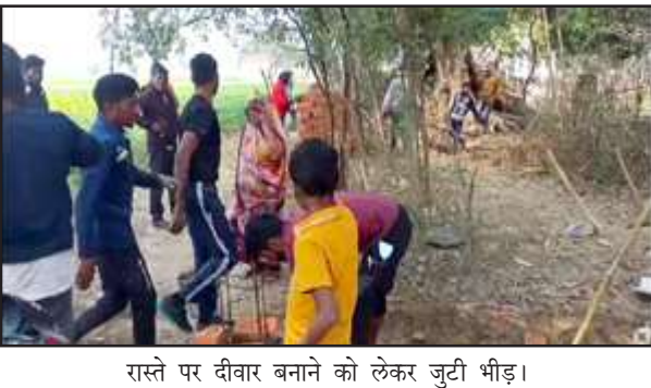
रास्ते पर दीवार बनाने को लेकर जुटी भीड़।

कुण्डा, प्रतापगढ़। बाधराय थाना क्षेत्र के सिया गांव में पीड़ियों पहले बने रास्ते पर दीवार बनाकर रास्ता बंद करने का मामला प्रकाश में आया है। दीवार बनाते देख ग्रामीणों ने पहले मना किया लेकिन जब काम नहीं रुका तो पुलिस को सूचना दिया। सूचना पाकर पहुंची बाधराय पुलिस ने एहतियात बरतते हुए काम बंद करवा दिया और दोनों पक्षों से अपने अपने दस्तावेज और राजस्व विभाग की रिपोर्ट दिखाने की बात कही है। बता दें कि दो दिन पूर्व सिया गांव के कुछ लोगों ने दशकों पुराने रास्ते को यह कहकर बंद करना चाहा की रास्ता उनकी भूमिधरी जमीन से निकलता है