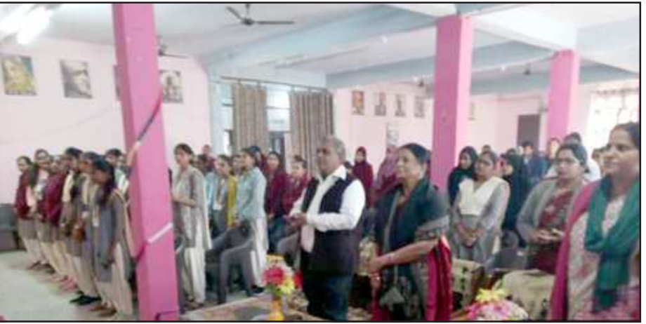
साकेत गर्ल्स पीजी कालेज में आयोजित कार्यक्रम में मौजूद प्राचार्या व प्रबंधक।