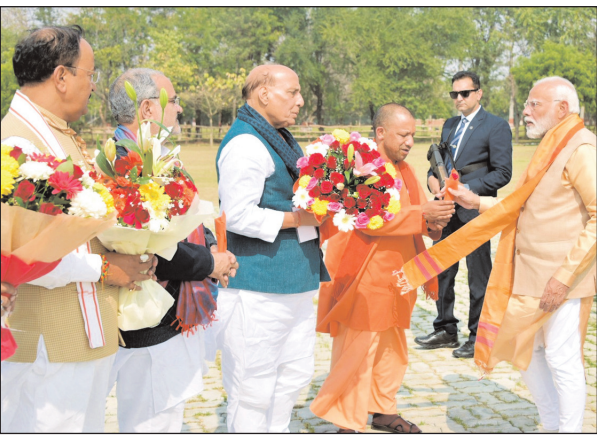
'लाखों युवाओं के लिए बड़ी रोजगार की संभावनाएं'

मुख्यमंत्री योगी आदित्यनाथ ने सोमवार को चौथी ग्राउंड ब्रेकिंग सेरेमनी के शुभारंभ के लिए प्रदेश आगमन पर प्रधानमंत्री नरेन्द्र मोदी का आभार जताया और 10 लाख करोड़ से अधिक की परियोजनाओं को धरातल पर उतारने के लिए इंदिरा गांधी प्रतिष्ठान में आए हुए निवेशकों व उद्यमियों का भी स्वागत किया। इस अवसर पर सीएम योगी ने कहा कि आज यूपी अपनी प्रतिभा और अनलिमिटेड पोटेंशियल को पहचान कर सुरक्षा, सुशासन और विकास से जुड़ चुका है। सीएम योगी ने कहा कि यह भूमि भगवान श्रीराम की है, गोपेश्वर श्रीकृष्ण की है, बाबा विश्वनाथ की है, ऋषि मुनिों की कृपा भूमि है, मां गंगा, यमुना और सरयू जैसी नदियों का आशीर्वाद भी इसको प्राप्त हुआ है, यह धन्य भूमि है, पुण्य भूमि है, यह उद्यम और उद्यमता की भी भूमि है। आज उत्तर प्रदेश भारत के श्रम शक्ति पुंज को एक अर्थशक्ति पुंज के रूप में बनाने की ओर अग्रसर हुआ है। मुख्यमंत्री ने कहा कि पिछले 10 वर्षों में हमारा देश 11वीं अर्थव्यवस्था से 5वीं अर्थव्यवस्था के रूप में स्थापित हुआ है। प्रधानमंत्री मोदी जी के तीसरे कार्यकाल में भारत दुनिया की तीसरी अर्थव्यवस्था बनेगा, इसमें किसी को कोई संदेह नहीं। यह मोदी जी की गारंटी है, इस पर यूपी को भी यकीन है। इस संकल्प के साथ जुड़ते हुए उत्तर प्रदेश ने स्वयं को वन टूरिलिसम डॉलर की अर्थव्यवस्था बनाने का लक्ष्य रखा है। इसके लिए हमने स्किटल, स्केल और