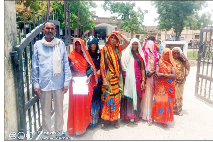
अवैध अतिक्रमण की शिकायत लेकर तहसील पहुंचे ग्रामीण

कौशाम्बी। मंझनपुर तहसील क्षेत्र के रकसीली गांव के कई दर्जन ग्रामीण मंझनपुर तहसील के समाधान दिवस में पहुंचे और समाधान दिवस में शिकायती पत्र देकर बताया कि गांव के खलिहान और तालाबी भूमि पर 4 दर्जन दवर्गों ने कब्जा कर लिया है ग्रामीणों ने बताया कि अवैध कब्जा हटाने के नाम पर गांव के गरीब लोगों की झोपड़पट्टी को हटा दिया गया है लेकिन तालाब और खलिहान की भूमि पर बने दर्जनों पक्के घरों पर तहसील प्रशासन ने कार्यवाही नहीं की है ग्रामीणों का कहना है कि तहसील प्रशासन अवैध कब्जे हटाने के मामले में पक्षपात कर रहा है इसके पहले भी तमाम ग्रामीणों ने कलेक्ट्रेट में प्रदर्शन कर जिला अधिकारी कार्यालय में शिकायत पत्र देकर तालाब और खलिहान की भूमि पर अवैध तरीके से बनाए गए चार दर्जन पक्के घरों को हटाने की मांग की थी लेकिन उसके बाद भी तालाब और खलिहान की भूमि पर बने चार दर्जन अवैध पक्के मकान नहीं हटाए