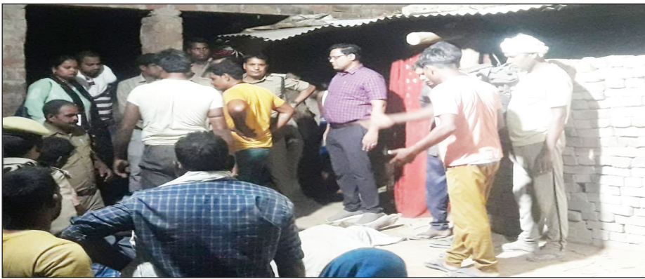
पेड़ गिरने से अघेड़ की मौत के बाद घर पर मौजूद अधिकारी और पुलिस