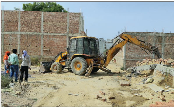
अवैध प्लांटिंग पर चलता पीडीए का बुलडोजर

ब्लाक प्रमुख द्वारा पंद्रह बीघे पर की गई थी अवैध प्लांटिंग