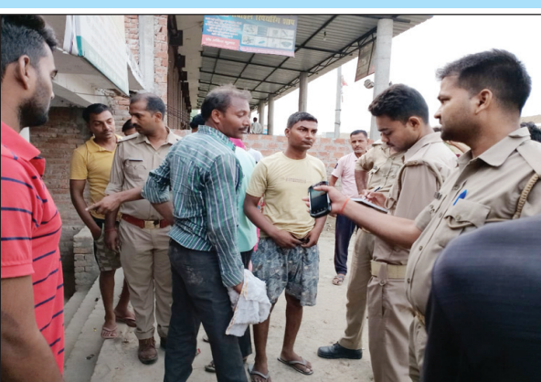
चोरी की घटनाओं की जांच करती पुलिस

जनरल स्टोर मेडिकल स्टोर इलेक्ट्रॉनिक और बैटरी की दुकान से लाखों का माल उठा ले गए चोर