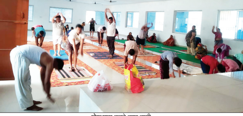
योगभ्यास करते नगर वासी