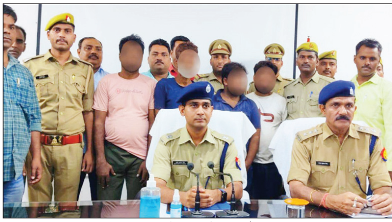
पुलिस के गिरफ्त में शांति चोर