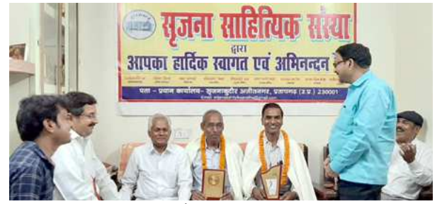
सम्मान समारोह में मौजूद साहित्यकार व अतिथिगण।