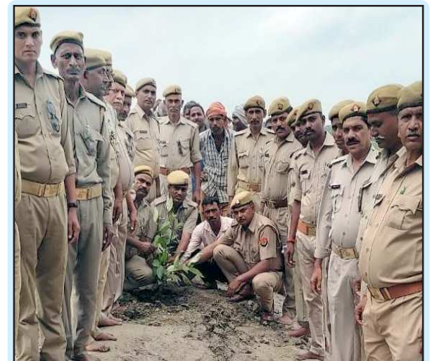
अमृत सरोवर तालाब में पौधरोपण करते होमगार्ड के जवान।