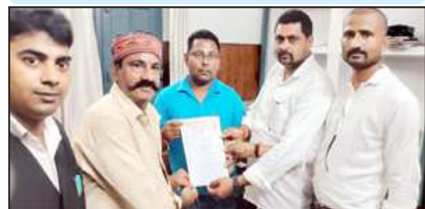
अधिशासी अभियंता को ज्ञापन सौंपते परशुराम सेना के पदाधिकारी।

गिट्टी डामर आदि का मानक अनुसार मिश्रण किए जाने से संबंधित ज्ञापन देकर सभी बिंदुओं पर नियमानुसार कार्यवाही की मांग की गई।