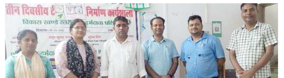
कार्यशाला में मौजूद अतिथिगण।