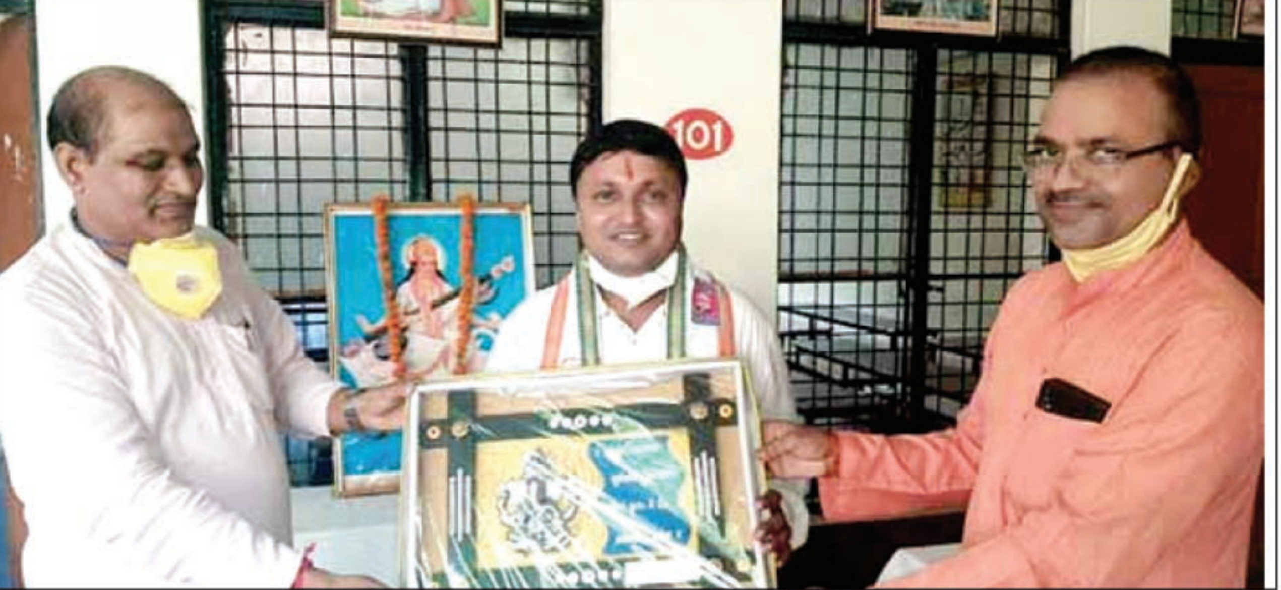
पूर्व छात्र को सम्मानित करते