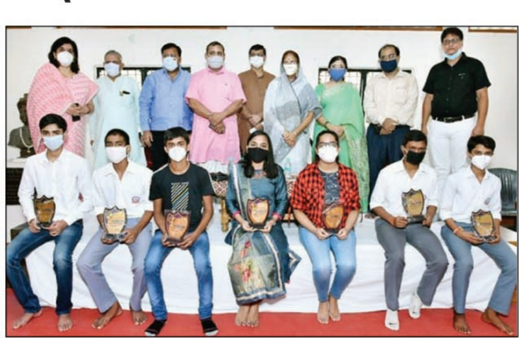
सम्मानित छात्र एवं अतिथिगण