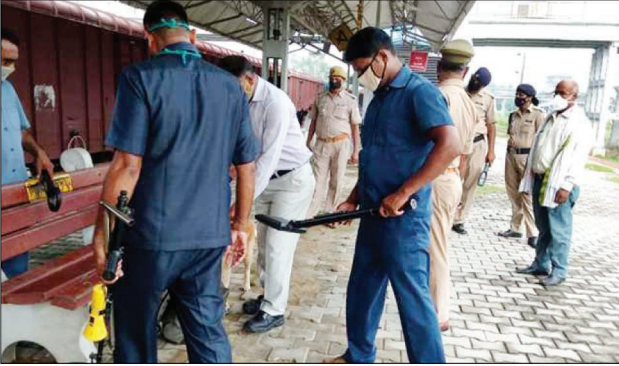
रेलवे स्टेशन पर जांच पड़ताल करती टीम

सुरक्षा के मद्देनजर शुक्रवार देर रात तक पुलिस ने शहर के होटलों, धर्मशालाओं में चेकिंग अभियान चलाया। इस दौरान होटलों और धर्मशालाओं में ठहरे लोगों के बारे में