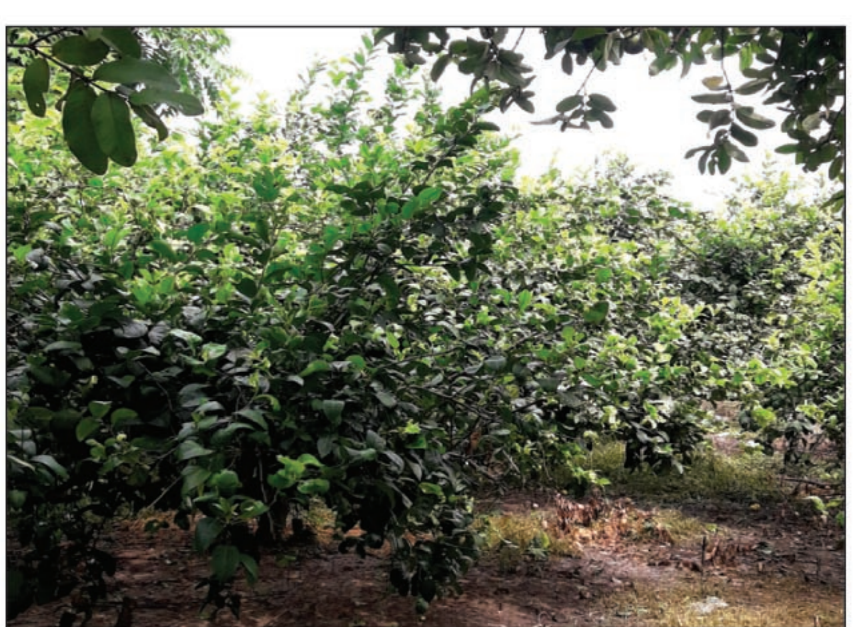
नींबू के बगीचे

नींबू की उपयोगिता :- नींबू एक ऐसा फल है जिसको लोग अपने भोजन की थाली से लेकर स्किन रोगों को दूर करने एवम त्वचा को साफ सुथरा रखने में भी