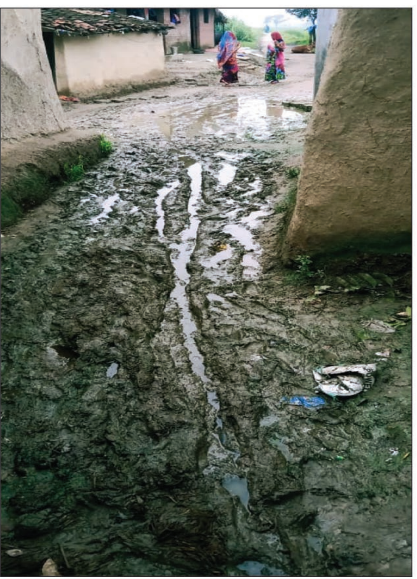
कीचड़युक्त गांव की गलियां