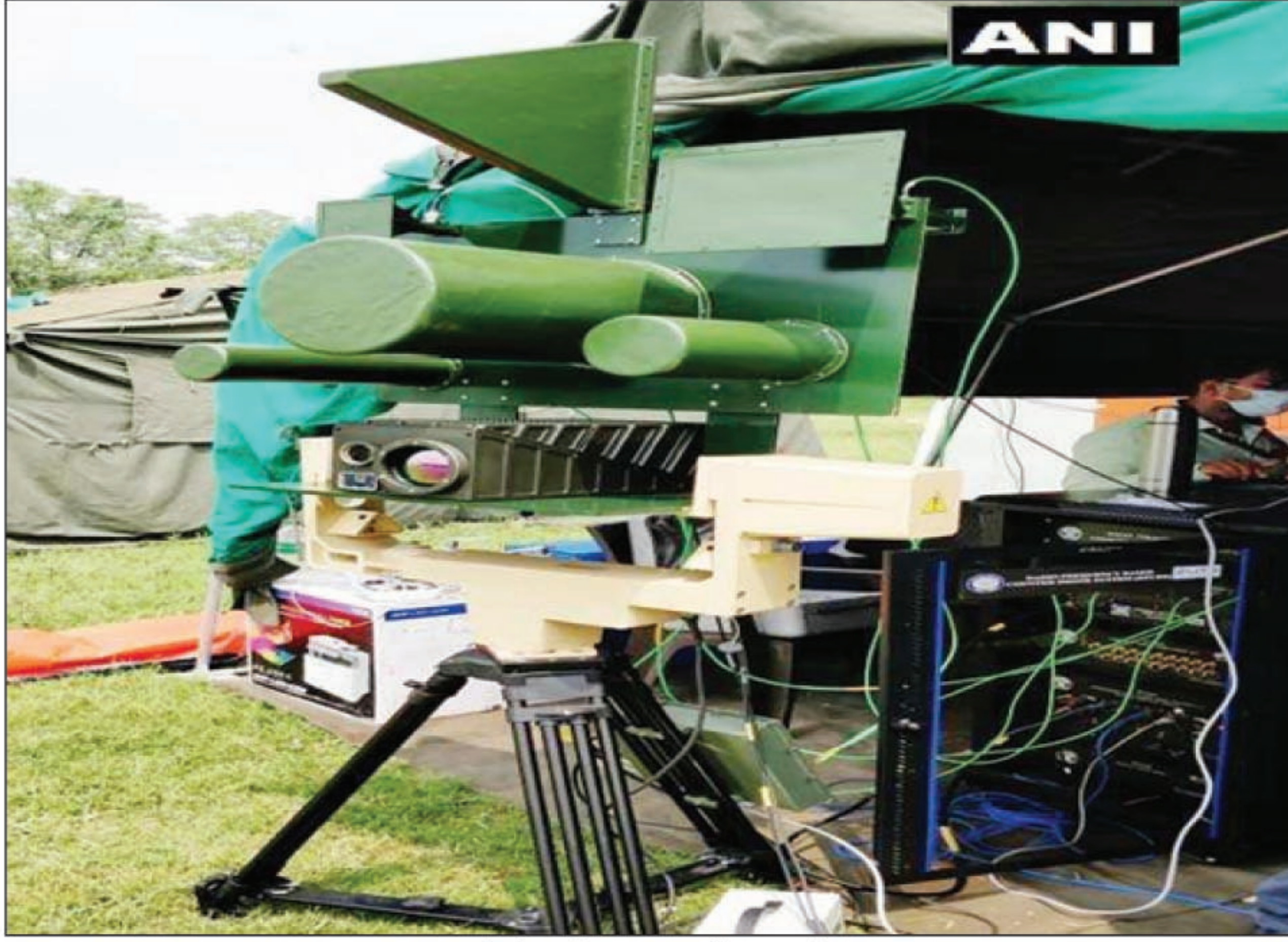
एंटी ड्रोन सॉल्यूशन तकनीक तकनीक