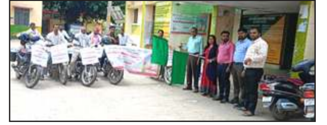
प्रचार वाहन को हरीझंडी दिखाते डीडीए कृषि।

मंगलवार को उपकृषि निदेशक राजकुमार ने बताया कि जिलाधिकारी के निर्देश पर कृषि बाबत योजनाओं के प्रचार-प्रसार को रैली निकाली जा रही है। ये रैली गांव-गांव जाकर लोगों को कृषि बाबत योजनाओं की जानकारी देगी। उपकृषि निदेशक ने कहा कि जिले में 340801 हेक्टेयर कृषि योग्य भूमि है। खरीफ फसलें 88752 हेक्टेयर में बोई जाती हैं। यहां ज्यादातर फसलें