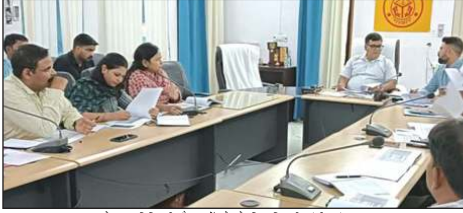
पोषण समिति की बैठक में बोलते जिलाधिकारी संजीव रंजन।

प्रतापगढ़। जिलाधिकारी संजीव रंजन की अध्यक्षता में कैम्प कार्यालय के सभागार में जनपद स्तरीय कन्वर्जेंस/पोषण समिति की बैठक सम्पन्न हुई। बैठक में आपूर्ति पोषाहार, बच्चों के पोषण स्तर में सुधार, एनआरसी प्रगति विवरण, वीएचएसएनडी, खाद्यान्न वितरण सम्बन्धी सूचना, आंगनबाड़ी केन्द्र निर्माण, पोषण बाटिका आदि के सम्बन्ध में विस्तृत चर्चा की गयी। जिलाधिकारी ने बाल विकास परियोजना अधिकारियों व अन्य सम्बन्धित अधिकारियों को निर्देशित किया कि वे अपने-अपने क्षेत्रों के