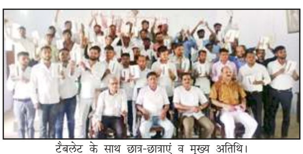
टैबलेट के साथ छात्र-छात्राएं व मुख्य अतिथि।

परियावां प्रतापगढ़। विकास क्षेत्र कालाकांकर के अंतर्गत मदन मोहन मालवीय स्नातकोत्तर महाविद्यालय कालाकांकर में उत्तर प्रदेश सरकार की महत्वकांक्षी स्वामी विवेकानंद सशक्तिकरण योजना के अंतर्गत एएए व एमकाम के विद्यार्थियों को टैबलेट वितरण किया गया।