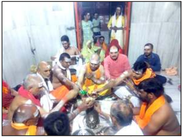
भयहरणनाथ धाम में सामूहिक रुद्राभिषेक करते श्रद्धालुगण।

प्रतापगढ़। प्रसिद्ध पांडव कालीन भयहरण नाथ धाम में सावन मास के द्वितीय मंगलवार को परम्परागत मेले के नाते भक्तों का रेला लगा रहा। पंचिगण्ड दर्शन व नी सुव्यवस्थित व्यवस्था की सराहना भक्तों व श्रद्धालुओं द्वारा हो रही थी। पुलिस व कार्यकर्ताओं की उत्तम व्यवस्था रही।