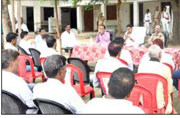
चौपाल में सम्बोधित करते डीएम।

मंगलवार को डीएम ने कहा कि प्रधान व व्यापार मंडल के सहयोग से व्यवस्था होती है। अर्की मोड पर ज्यादा पानी भरने से