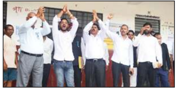
सदर तहसील में एसडीएम के विरुद्ध नारेबाजी करते अधिवक्ता।

प्रतापगढ़। सदर तहसील में आज भी अधिवक्ताओं द्वारा एसडीएम सदर के विरुद्ध जमकर नारेबाजी की गई। बता दें कि सदर तहसील के अधिवक्ता एसडीएम के दुर्व्यवहार से क्षुब्ध होकर आंदोलन कर रहे हैं। अधिवक्ताओं के आंदोलन से तहसील का कामकाज भी प्रभावित हो रहा है।