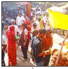
परानू बाबा मेला का दृश्य।

बरगढ़/चित्रकूट। परानू बाबा आश्रम में बारहमासी अन्तर्राष्ट्रीय मेला भगवान भरोसे लगता है। मेला में कई प्रान्तों के लाखों श्रद्धालु आते हैं। ये स्थान भक्तों के आश्रम नहीं किये। परानू बाबा आश्रम मऊ तहसील के कलचिहा जंगल में राष्ट्रीय राजमार्ग 35 के बरगढ़ मोड़ चैराहा से ढाई किमी दूर उत्तर दिशा में है। मंगलवार को परानू बाबा आश्रम में वैसे तो हर दिन भरक आते-जाते हैं। अषाढ़, सावन, कार्तिक व फाल्गुन में ज्यादा भीड़ रहती है। वर्तमान में चित्रकूट मेला