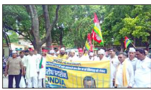
विरोध-प्रदर्शन करते आप व सपा।

प्रताड़ित किया जा रहा है। मंगलवार को दिल्ली के मुख्यमंत्री अरविंद केजरीवाल को पिछले कई महीनों से दिल्ली शराब घोटाले के नाम पर राजनैतिक साजिश से गिरफ्तार कर जेल भेजा गया है। आज तक उनके खिलाफ कोई सबूत इंडी व सीबीआई कोर्ट में पेश नहीं कर सकी। अरविंद केजरीवाल की लोकप्रियता से परेशान भाजपा आम आदमी पार्टी को समाप्त करने के प्रयास में जुटी है। साजपा सत्ता का दुरुपयोग कर अरविंद केजरीवाल को जेल के अंदर प्रताड़ित कर रही है। केजरीवाल को सुपार का सही