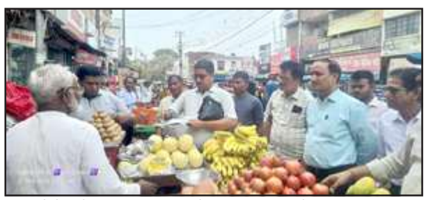
ठेलेवाले का चालान काटते नगर पालिका के अधिकारी।

प्रतापगढ़। नगर पालिका ने आज गुरुवार को अपराह्न शहर में राजकीय इंटर कालेज से लेकर चौक घंटाघर तक अतिक्रमण विरोधी अभियान चलाया जिसमें 10 दुकानदारों तथा पांच गुमटी वालों पर 9500 जुमाना ठेका तथा चेतावनी दी गई कि दुकानदार सड़कों पर ठेला व सामान बिखेरकर अतिक्रमण न करें। ठेले वालों को सचेत किया गया कि वह घूम-घूमकर गलियों में अपना व्यवसाय करें। ऐसा न करने पर दुबारा सड़क पर अतिक्रमण करने पर नगर पालिका सख्त