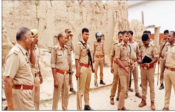
खूनी संघर्ष के बाद गांव में तैनात पुलिस फोर्स