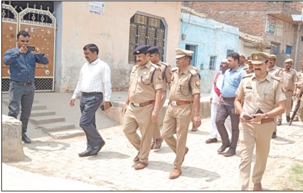
खूनी संघर्ष के बाद गांव में पुलिस फोर्स के साथ भ्रमण करते डीएम एसपी