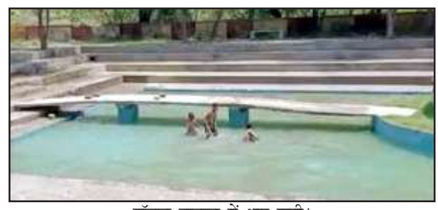
मॉडल तालाब में भरा पानी।

पानी भरवा दिया गया। अब पशु-पक्षियों के साथ ही मवेशी अपनी प्यास बुझा सकेंगे। स्थानीय ब्लॉक परिसर स्थित मॉडल तालाब का सौंदर्यकरण पिछले वर्ष शुरू कराया गया। लेकिन लापरवाही के चलते वर्ष बीत गया फिर भी