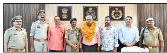
दरोगा को विदाई देते एसपी आदि।