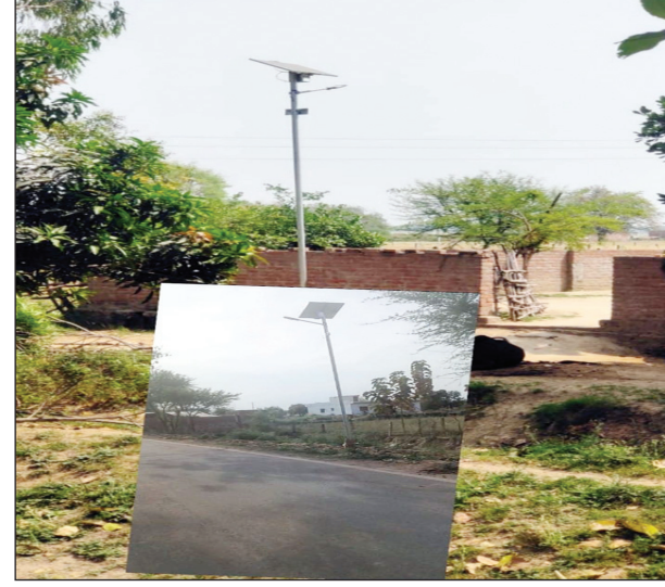
फोटो में पहले कहाँ लगा रहा था अब कहाँ लगा है देखा जा सकता है