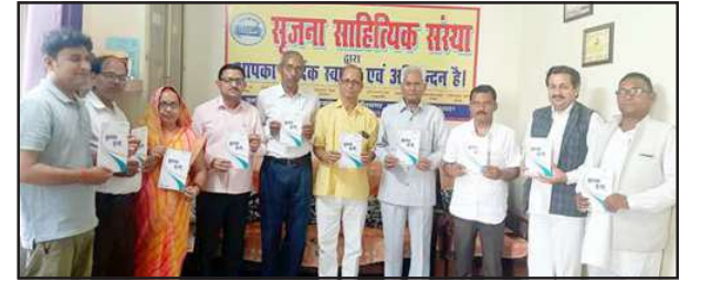
कहानी संग्रह का लोकार्पण करते अतिथिगण।