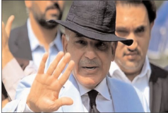
महीने की शुरुआत में दूसरी बार प्रधानमंत्री पद की शपथ ली है।

आर्थिक और सुरक्षा चुनौतियों से जुड़ा रहे पाकिस्तान के प्रधानमंत्री शहबाज शरीफ ने शनिवार को देश की आर्थिक स्थिति को बदलने का संकल्प लिया। उन्होंने सरकारी मीडिया को बताया कि सभी मंत्रालयों के साथ पांच साल की योजना को साझा किया गया है। रैंडियो पाकिस्तान की एक रिपोर्ट के अनुसार शरीफ ने मंत्रिमंडल की बैठक के दौरान सभी मंत्रालयों के साथ एक पांचवर्षीय योजना साझा की है, जिसमें उनके लिए लक्ष्य निर्धारित किए गए हैं। शरीफ ने इस