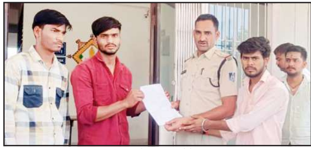
थानाध्यक्ष को तहरीर देते छात्र।