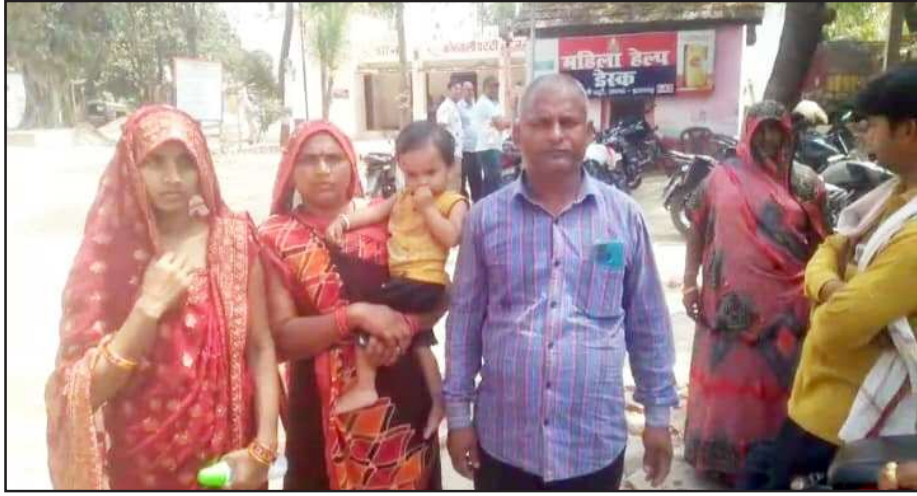
ईंट भट्टा से मुक्त बंधवा मजदूर।