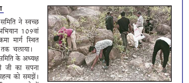
सफाई करते समिति के लोग।