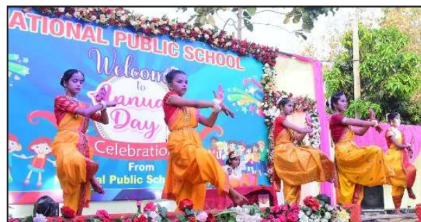
वार्षिकोत्सव समारोह में सांस्कृतिक कार्यक्रम प्रस्तुत करते बच्चे।