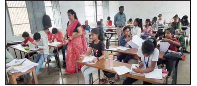
टैलेंट परीक्षा देते छात्र-छात्रावें।